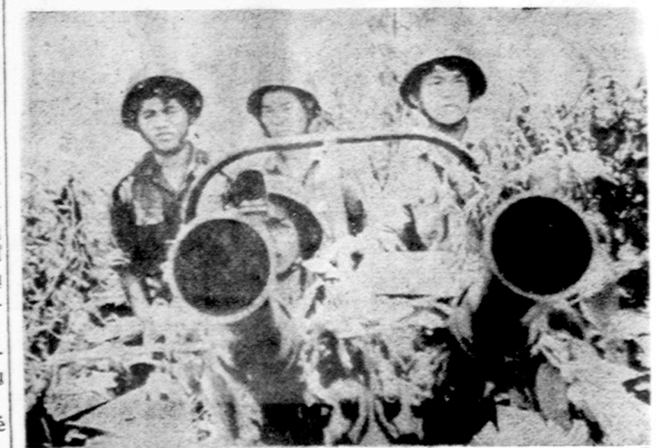
Šiaurės Vietnamo kariai Laose. Ten paliaubų dar nėra.

WASHINGTONAS. — Taika ar karas daugiausia priklauso ne nuo Hanojus, bet nuo Maskvos ar Pekino, pareiškė Kissingeris. Jis atsiskakė pasakyti, ką Amerika darytų, jei Šiaurės Vietnamas sulaužytų paliaubas, atnaujintų karą, bet galima buvo suprasti, jog bombardavimai galėtų būti atnaujinti.