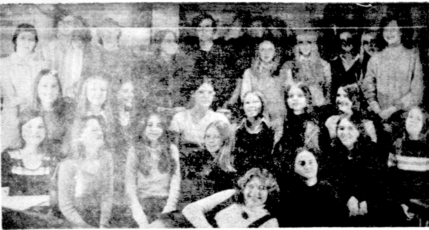
Chicago's MAS Lipniūno kuopos gruodžio 9 susirinkimo dalyviai.