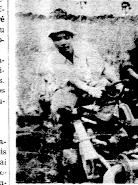
Ir komunistinė Kinija padeda ūkiškai atsilikusioms tautoms. Žemės ūkio specialistai slūgėdami į Tanzaniją, Afriką

Iranas neseniai žadėjo JAV garyti lengvatą naftos šaltiniams panaudoti, Sausio 23 d.