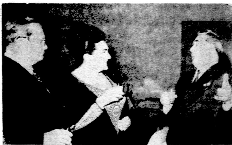
Brežnevas Titui: "Į mano palapinę tau durys dieną naktį atdaros"

Saulėta, bet šalta, temperatūra naktį netoli 0, dieną apie 20 laipsnių.