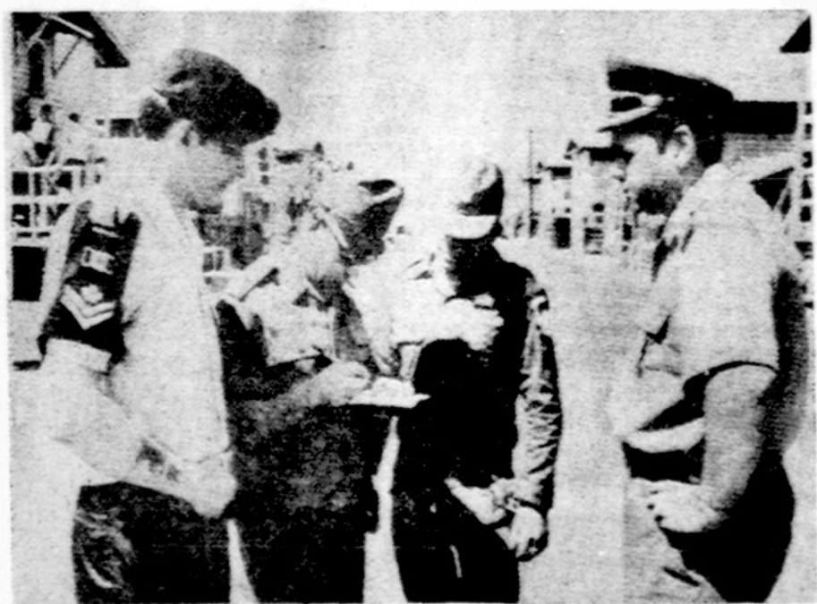
Keturių neutralių atstovai tariasi viename Pietų Vietnamo miestely. Iš k. d.: Kanados, Vengrijos, Indonezijos, Lenkijos

PHNOM PENH. — Kambodijoje komunistai tebeuola, ir paskutiniomis dienomis savo pozicijas prie Mekong upės praplėtė. Tūkstančiai kambodiečių palikę namus atbėgo į sostinę. Pietų Vietnamo ramybės dar nėra. Saigonas praneša apie naujus paliubų pažeidimus.