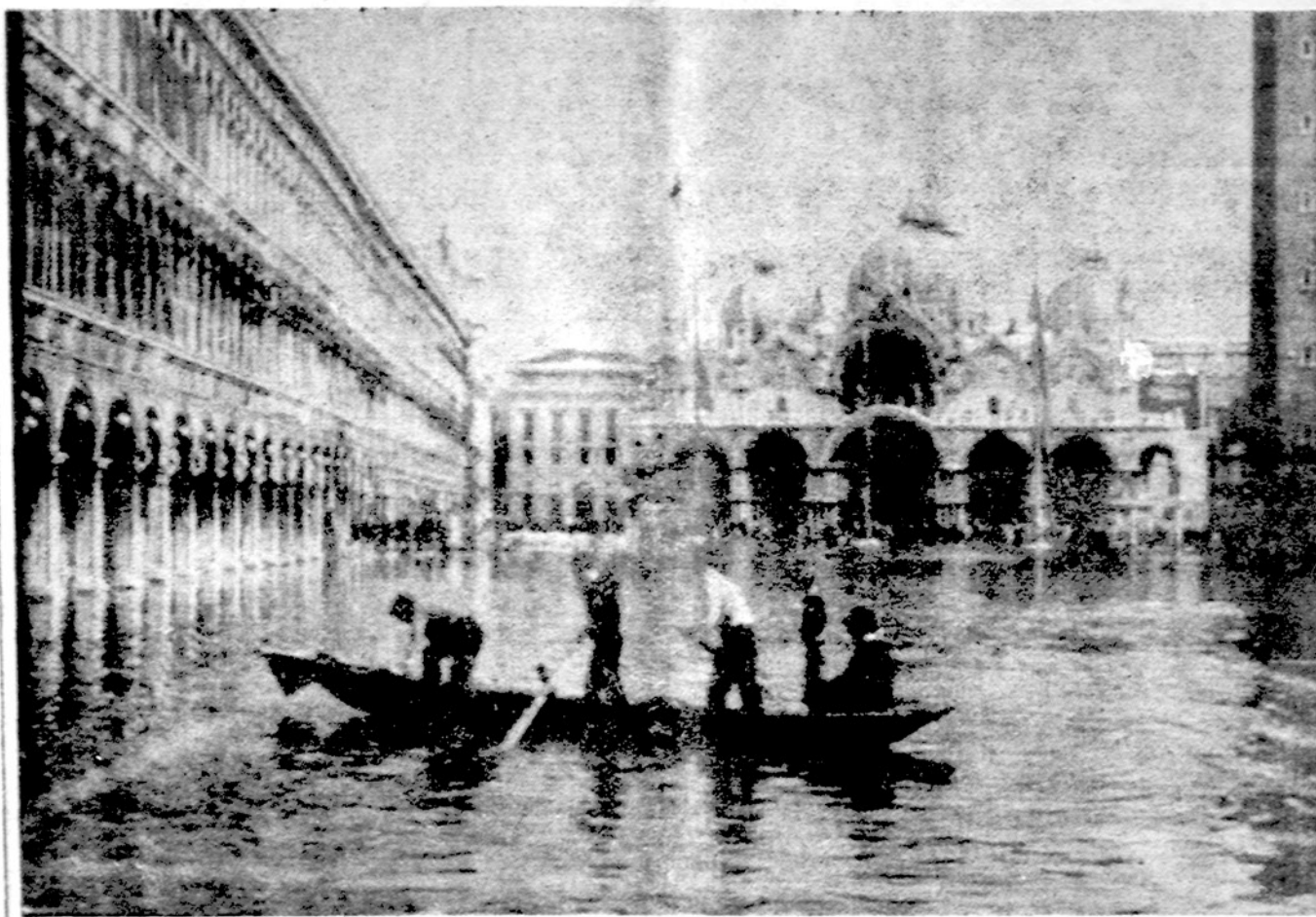
Venecija. Sv. Morkaus aikštė po vandeniu. Tolumoje šv. Morkaus bažnyčia

OTTAWA. — Užsienio reikalų ministeris Mitchell Sharp parlamente pasakė, kad Kanada pripažino Hanojų, užmezgę diplomatinius santykius su šiaurės Vietnamu. Kol kas ambasadoriais nebus pasikeista, bus pasistenkta tik žemesnio laipsnio diplomatais. Tuo pačiu metu Sharp pakartojo, kad Kanada pripažino Hanojų, užmezgę diplomatinius santykius su šiaurės Vietnamu. Kol kas ambasadoriais nebus pasikeista, bus pasistenkta tik žemesnio laipsnio diplomatais. Tuo pačiu metu Sharp pakartojo, kad Kanada pripažino Hanojų, užmezgę diplomatinius santykius su šiaurės Vietnamu. Kol kas ambasadoriais nebus pasikeista, bus pasistenkta tik žemesnio laipsnio diplomatais. Tuo pačiu metu Sharp pakartojo, kad Kanada pripažino Hanojų, užmezgę diplomatinius santykius su šiaurės Vietnamu. Kol kas ambasadoriais nebus pasikeista, bus pasistenkta tik žemesnio laipsnio diplomatais.