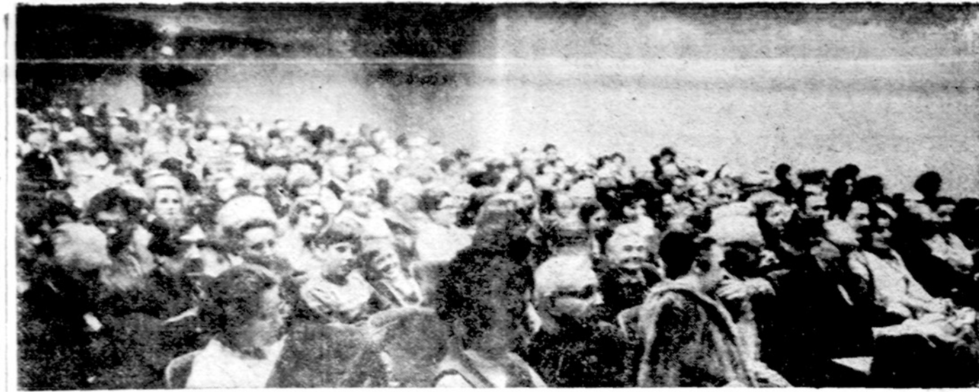
Svečiai operos Bohemos pastatyme Chicagoj vasario 4 d.

× Užgavėnių vakaras — balius rengiamas Ateitininkų Sąjungos Vyresniųjų Giedrininkų įvyks vasario 24 d. Nekalto Prasidėjimo parapijos salėje, 4420 So. Fairfield Ave. Pradžia 7:30 val. vak. Auka 5 dol. Programa, šilta vakarienė, šokiai. Stalai po 10 ir po 8 asm. Prašome visus dalyvauti. Teirautis tel. LA 3-2315, arba 778-2172. (pr.)