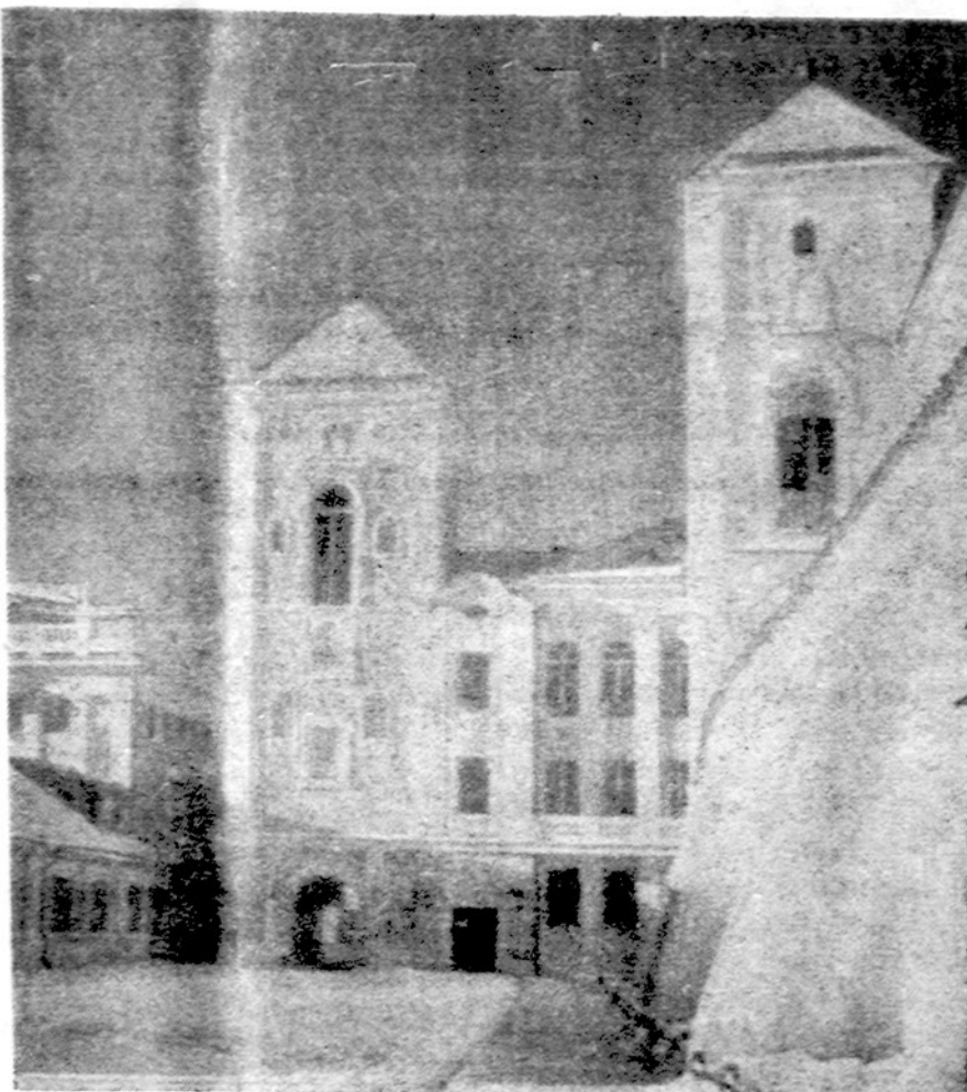
Kauno senamiesčio kampelis — šv. Trejybės bažnyčia, Bažnytinio meno muziejus ir kampas arkivyskupijos rūmų.

PARYŽIUS. — Pasteuro institutas Paryžiuje tikisi laike penkerių metų pagaminti skiepus nuo visų rūšių gripo. Dabar veikiančieji skiepai apsaugoja tik nuo vienos rūšies ligos.