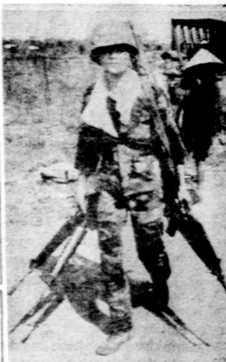
Pietų vietnamietis karys grįžta namo. Rankose karo grobis.

SAIGONAS. — Pagal turimus duomenis, nuo 1961 iki 1972 metų Vietnamo konfliktas pareikalavo 1,181,090 gyvybių aukų, neskaitant civilių gyventojų, žuvusių bombardavimų ir įvairių atentatų metu. Zuvusiųjų tarpe yra 977,000 šiaurės vietnamiečių ir priklausančių Vietkongo daliniams; daugiau negu 158, 000 pietų vietnamiečių ir beveik 46,000 amerikiečių.