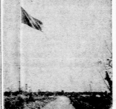
Demilitarizuota zona tarp dviejų Vietnamų

Paskutinis Kissingerio ir Ču En-lajaus susitikimas truko penkis valandas. Plačiau nieko nežinoma, bet sakoma, kad pasikalbėjimai buvo "atviri ir apėmė daugelį sričių". Iš viso, nuo ketvirtadienio iki sekmadienio Kissingeris su Ču, Mao ir kitais vadais bediskutuodamas praleido 20 valandų.