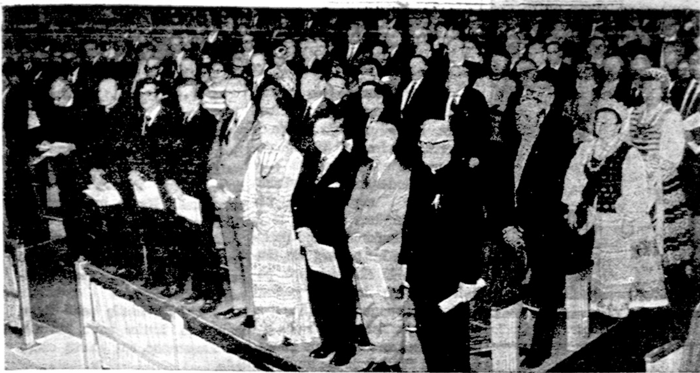
Svečiai Vasario 16-sios minėjime Chicagoje.