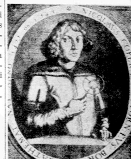
N. Kopernikas. Nuo Koperniko gimimo vasario 19 suėjo 500 metų. Jo gimimo sukaktį lenkai visam pasauliui švenčia labai iškilmingai

Norint sustabdyti infliaciją, šiais metais nebus leista prekių kainoms pakilti daugiau, negu 5 su puse ar šešis procentus, taip, kaip ir praėjusiais metais.