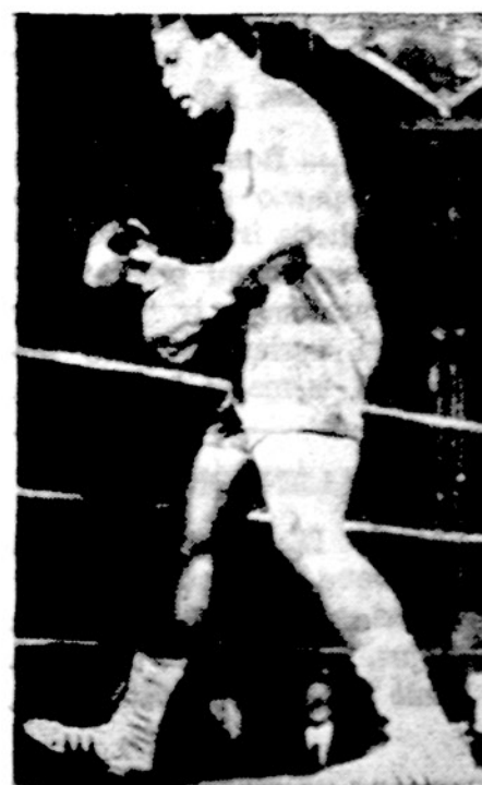
George Foreman, 25 m. amžiaus, neseniai laimėjęs pasaulio bokso čempiono titulą