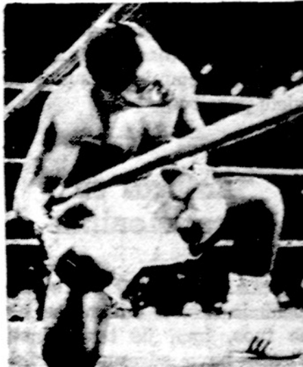
Joe Frazier, 25 m. amžiaus, neseniai pralaimėjęs pasaulio bokso čempionatą

Atsilūs orui Lietuvoje ir futbolininkai išbėgo į aikštę. Pirmose rungtynėse Elektronika nugalėjo Žalgirį 1:0.