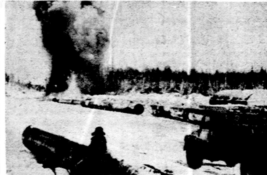
Sovietai visomis išgalėmis stengiasi eksploatuoti ir natūralių degamųjų dujų atsargas Vakarų Sibire. Čia matome tiesiamas vamzdynų linijas. Darbams vadovauja vokiečiai specialistai. Vokietija duoda ir vamzdynus.

Apskaičiuojama, kad visame pasaulyje yra per šimtas milijonių arabų. Nemažai arabų gyvena Europoje ir Amerikoje, ar tai studijuodami, ar versdamiesi kokia nors profesija, ar amatu. Iš spaudos teko pastebėti, kad arabai, gyvenę Europoje