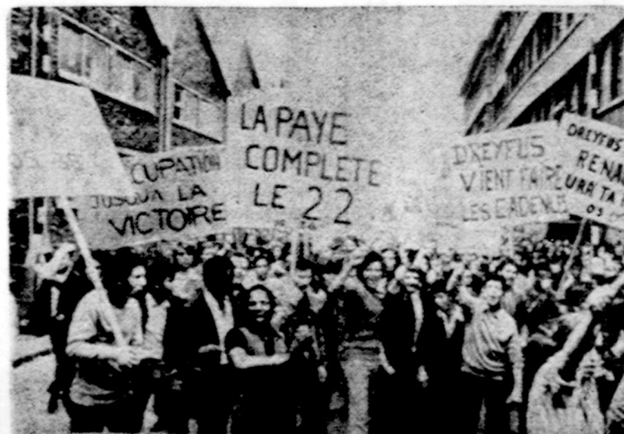
Prancūzų maoistai ruošiasi parlamento rinkimams

Vėliau policija pranešė, kad jie jau žino, kur yra karstas, ir jis bus sugrąžintas į Yeu salą. Tikimasi, jog gali būti demonstracijų pačioj saloj, kai bus atvežtas karstas, ir policija imasi atsargumo priemonių. Kas paskui? Ar policija ir turės saugoti kapines, kad vėl kas neišvogtų?