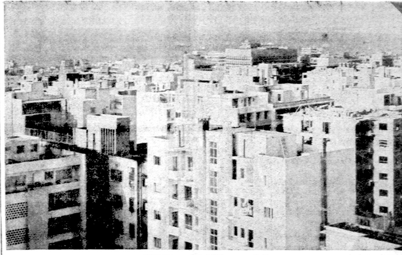
Beirutas, moderni Libano sostinė