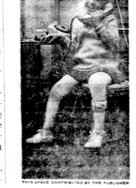
Just calling to say Thank You for giving to the March of Dimes.

VALOME KILIMUS IR BALDUS Plauname ir vaskuojame visų rūšių grindis J. BUBNYS, tel. RE 7-5168