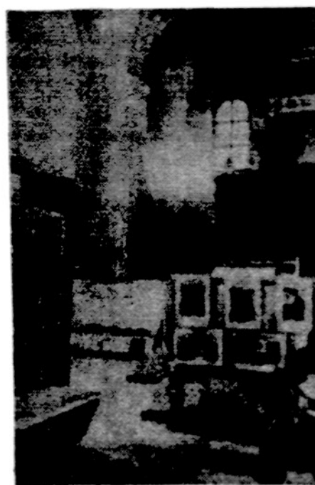
Išniekinta bažnyčia. Vilniaus šv. Mykolo bažnyč. vidus. Bažnyčia pavesta sanitarijnį reikmenų paroda

Kongreso metu vyks ta daug visokių suvažiavimų, posėdžių, parodų, religinių koncertų. Kongresas baigiamas rytoj.