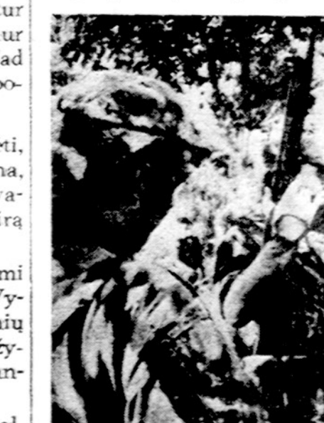
Portugalų karo vadai Afrikos Gvinėjoje, kur jie veda karą prieš kolonistus sukėličius vietinius gyventojus. Viduryje generolas De Spinoza.

Saudi Arabijos sienos gana saugios, išskyrus jos pietinius