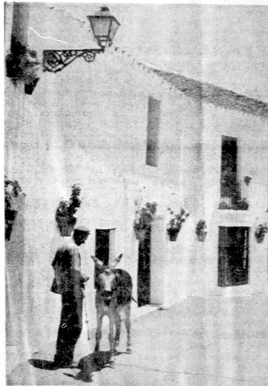
Būdingas Ispanijos kampelis, Mijas mieste, prie Viduržemio jūros, vadinamam "Saulės pakraštį"