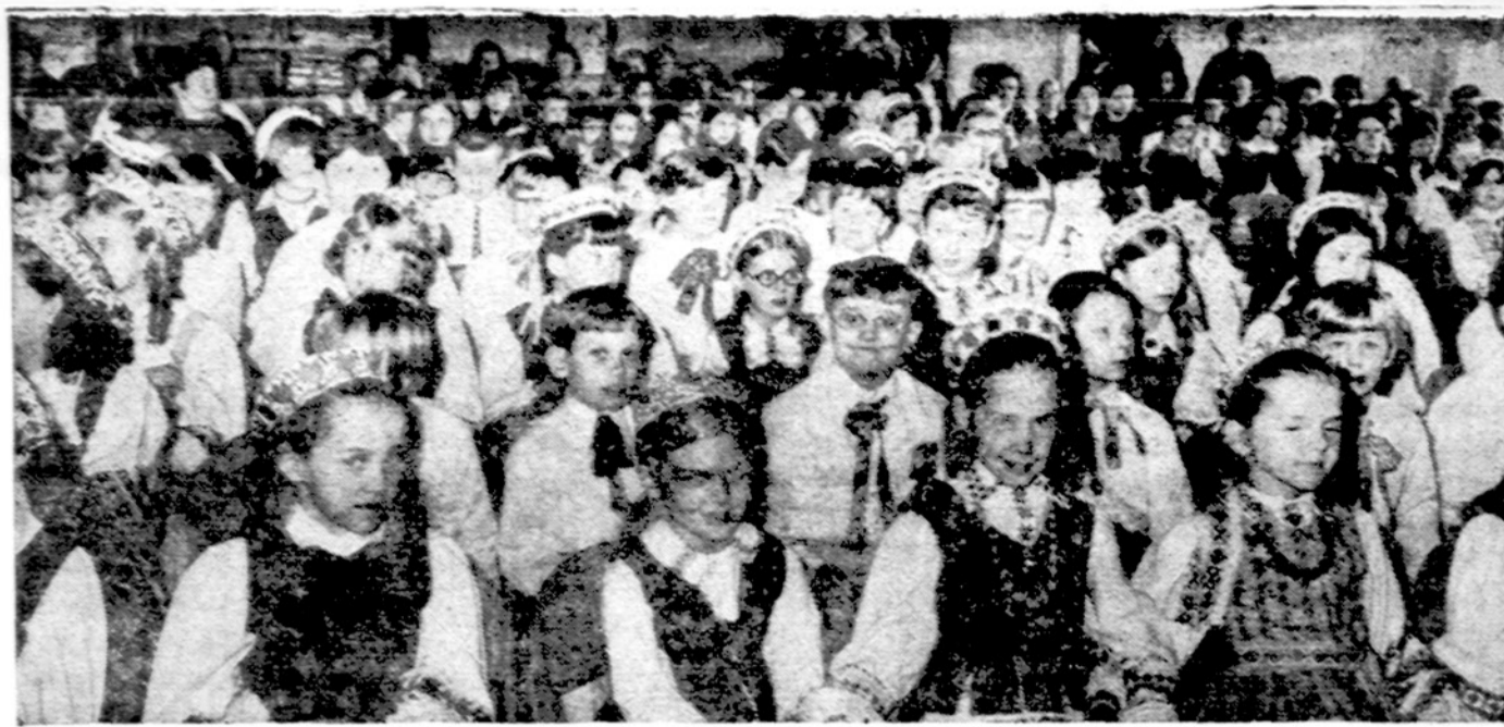
Marquette Parko Šv. P. M. Gimimo parapijos mokyklos mokiniai mini Vasario 16-ją.