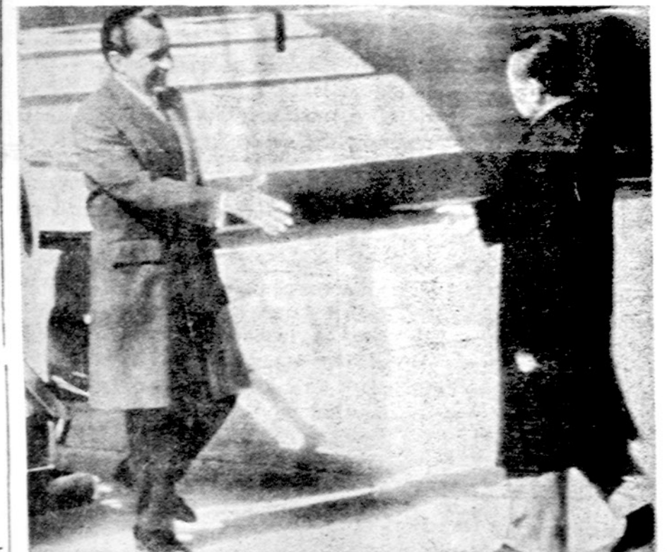
Prisiminti pirmąjį Amerikos ir Kinijos vadų kontaktą, prieš metus pradėjusį naują erą. Nixonas ir Ču En-lai.