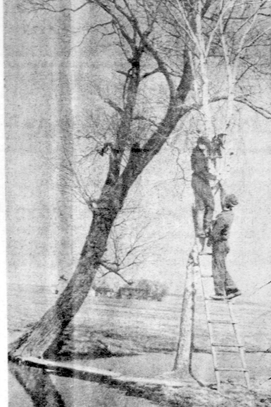
Jiems didelė šventė. Prieš paukščiųjams sugrįžtant iš šiltųjų kraštų, Lietuvos kaimo jaunimas į berželį kelia inkilą.

WASHINGTONAS. — Balandžio 17-18 dienomis Washingtone lankysis Italijos ministras pirmininkas Giulio Andreotti ir tarsis su prezidentu Nixonu.