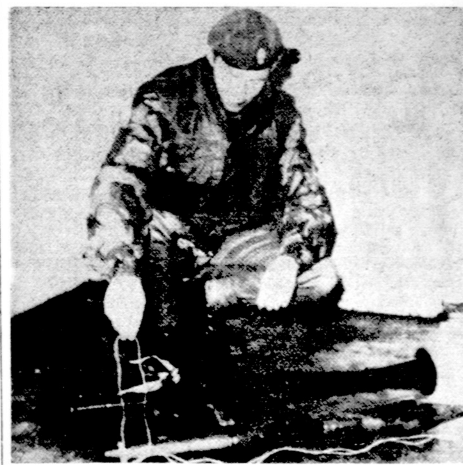
Britų karys šiaurės Airijoje nagrinėja iš teroristų atimtą sovietų gamybos raketų svaidytoją

WASHINGTONAS. — Geležinkeliniai kontraktas su darbdaviais baigiasi birželio 30, ir deramasi dėl naujo. Jau žinoma, kad susitarta veiks visais klausimais, išskyrus pensijų reikalus. Kitą savaitę tikimasi ir čia išsiaiškinti, kas neišsė. Tokiu būdu atrodo, jog streiką šią vasarą nebus.