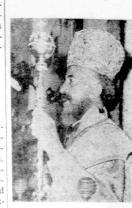
Makarios: ir ortodoksu arkivyskupas, ir respublikos prezidentas

Makarios pusę palaiko Kipro kunigai. 20 vyresniųjų dvasiųjų, įskaitant šešių vienuolių viršininkus, paskelbė, kad vyskupai neįsakydami atsakomybės, ir jų reikalavime nieko daugiau, kaip savanaudiškumas.