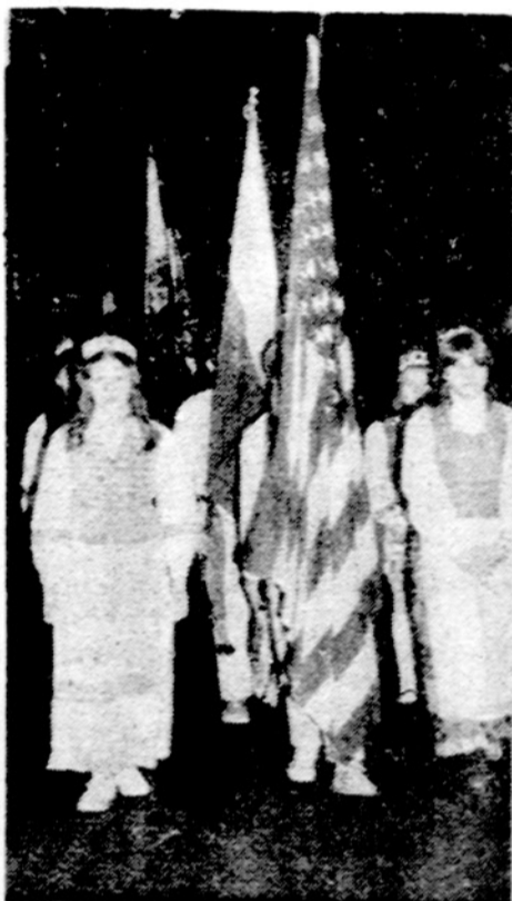
Vasario 16-sios minėjimą švenčiant Nekalto Prasidėjimo parapijos bažnyčioje nešamos vėliavos. Minėjimą suruošė LB Brighton Parko apylinkė.

Pasaulio Bažnyčių ekumeninė taryba Ženevoje, kuriai priklauso 2655 krikščionių bendruomenės, paskelbė kreipimąsi į tikinčiuosius, kviesdama ateinančių trejų metų laikotarpyje surinkti penkis milijonus dolerių Indokinijos tautų Vietnamo, Laos ir Kambodijos kraštų sutaikymui ir atstatymui. Numatyta kasmet surinkti daugiau negu pusantro milijono dolerių, kurie pirmoje eilėje bus panaudoti karo pabėgėlių, našlaičių, sužeistųjų ir kitų nuo karo veiksmų nukentėjusių reikalams.