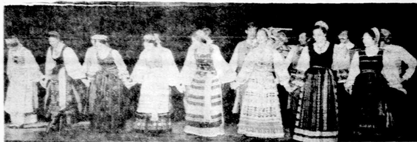
Jaunimo centro studentų ansamblio Chicagoje Vasario 16-sios minėjime atliko programą.