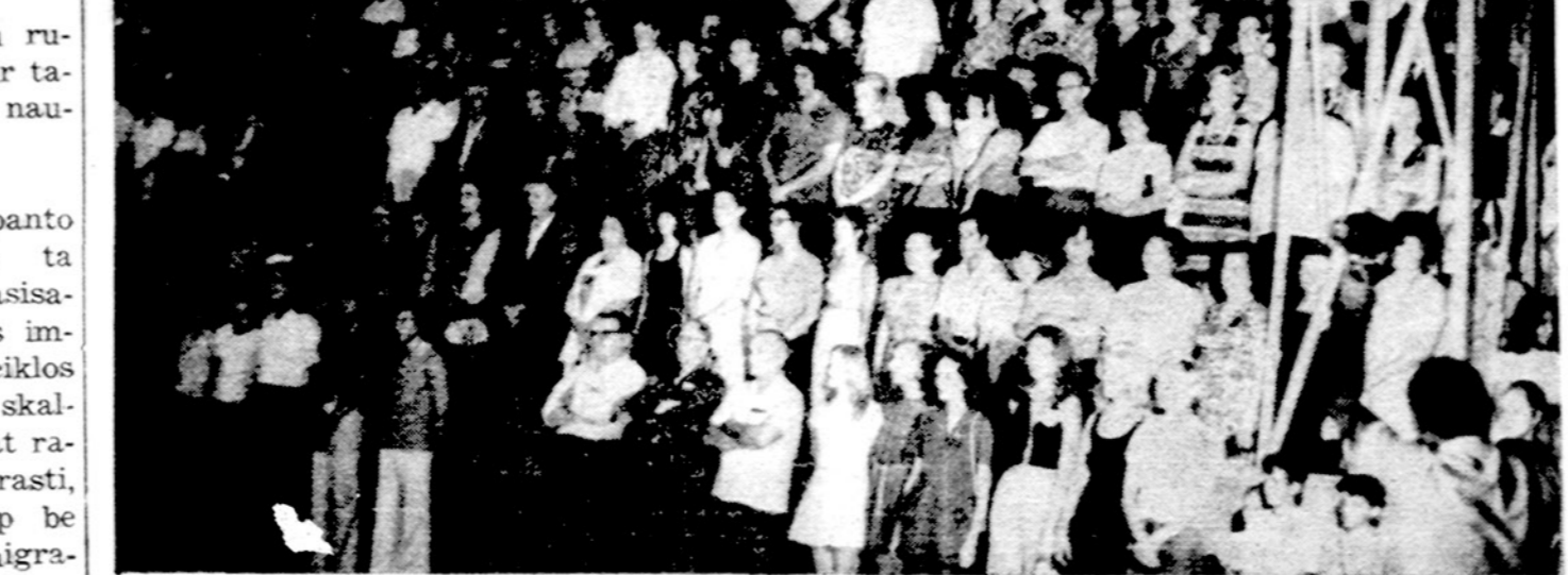
Pietų Amerikos lietuvių kongrese Sao Paule, Brazilijoje, Tautinių šokių festivalio metu dalis žiūrovų.

Mums skaldyti ir komunistinei propagandai skieisti organizacijos vadinamam plenumo posėdyje visi kalbėjusieji pabrėžė, kad pirmasis ir paskutinis uždavinys yra įtaigoti pasaulio lietuvius, kad vadinamoje tarybinėje Lietuvoje yra ekonominė gerovė, kad nėra jokios rusifikacijos, kad vyresnysis brolis — Maskva padeda visom mažom tautom. Žodžių įvairiomis priemonėmis, prisidengiant kultūra ir draugyste, norima pasauliui ir visiems lietuviams, įrodyti, kad kalba apie Lietuvą pavergiama tėra tik kalba, nes Lietuva kaip tik dabar pasiekusi didelių laimėjimų. Ir šalia tos propagandos, šalia to noro įtaigoti apie laimę Maskvos globoje, norima laisvojo pasaulio lietuvius sukirstinti ir suskaldyti. Ir jei kas mano, kad įvairūs kultūros mainai daug padeda lietuviams, tas turėtų pasisąskaityti anuos aukščiausius cituotus komunistų žodžius, įrodančius, kad tie ryšiai skirti skaldyti ir menkinti laisvojo pasaulio lietuvių kovą už krašto laisvimą tautų šeimose, taip sa-