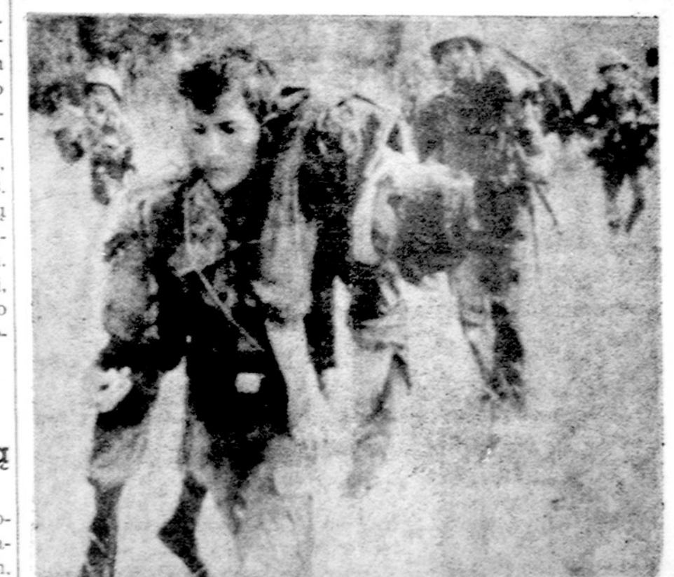
Po dviejų mėnesių nuo "taikos" Vietname. Pietų vietnamietis ir jo sunkiai sužeistas draugas traukiasi nuo šiaurės vietnamiečių puolimo

SAIGONAS. — Amerika pasirošusi siūlyti, kad karinės paltubų komisijos darbai būtų prastėti ir po kovo 28, tol, kol paltubos bus įgyvendintos. Pagal Paryžiaus susitarimą, komisija, susidedanti iš keturių kariavusių kraštų karininkų, savo darbą turėjo baigti kovo 28, iki to laiko turėjo būti ir visuotinė taika, paleisti visi belaisviai, politiniai kaliniai, bet praktiškai taikos nėra ir jos greit nebus.