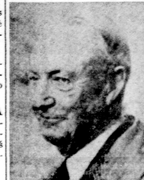
David Bruce, pirmasis neoficialus ambasadorius Pekine. Kiniečių pro tokole jis bus vadinamas "šu jen" ("šešas"). Pekino vadai jo paskyrimą priėmė su dideliu pasitenkinimu

WASHINGTONAS. — Iš privačių, bet įtakingų sluoksnių, yra sumanymas ir spaudimas Kongrese, kad būtų išleistas įstatymas bausti parkų, gatvių ir plentų teršėjus, tik bausti ne pinigine pabauda, bet paskiriant mažiausiai tris dienas rinkti šiukšles, prisidėti prie šūkio: "America Beautiful".