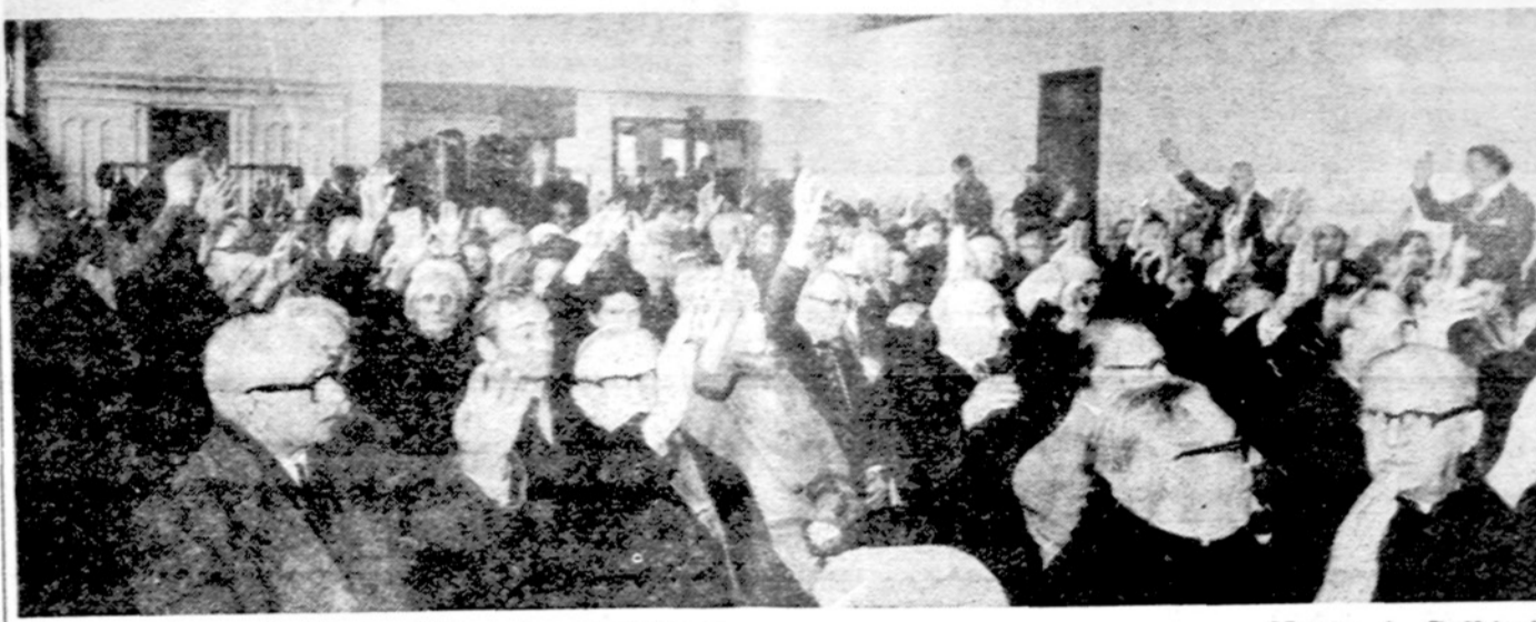
Chicago Marquette Parko LB apyl. susirinkime.