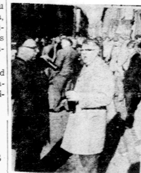
Danijoj darbininkai irgi nutarė streikuoti. Yra daug laiko, yra karas ir alaus gatvėje pagirkšnoti.

KOPENHAGA. — Į gatves išėjo streikuoti ir studentai, mokiniai bei mokytojai. Kokia pusė visų mokyklų Danijoje neveikia. Jų streikas neturi ryšio su darbininkų streiku. Iš tikrųjų, Amerikoj būtų sunku suprasti, kaip galėjo Danijos mokiniai prisidėti prie streiko, kai valdžia taupymo sumetimais nutarė mokyklose pamokas sutrumpinti penkiom minutėm.