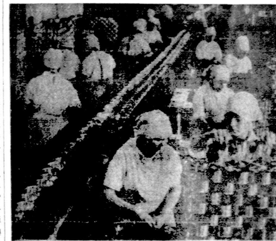
Kažkur Sibiro gilumoje žuvų konservų fabriko darbininkės

Sadatas vėl pakartojo, kad Vid. Rytų padėtis esanti "labai kritiška", kad karas gali prasidėti kiekvienu metu. Jis dar piktai atsiliepė ir apie Ameriką, kad žada Izraeliui naujų lėktuvų ir kitokių ginklų.