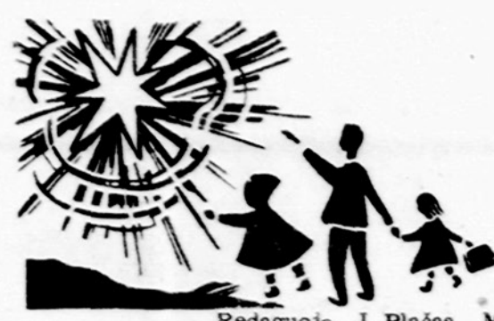
Redaguoja J. Plačas. Medžiaga siūsti: 7045 So., Claremont Avenue, Chicago, Illinois 60636

Field gamtos istorijos muziejuje še. šeštadieniais 10:30 val. balandžio mėnesį bus rodomi filmai vaikams. Programoje: — bal. 7 d. — Lotynų Amerika, bal. 14 — Egiptas, bal. 28 — kelionių filmas. Įėjimas nemokamas.