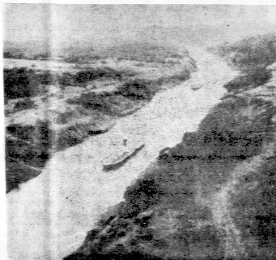
Panamos kanalas, dėl kurio porą savaitių buvo tiek įtempimo

WASHINGTONAS. — Kongrese yra balsų, kad reikia išleisti įstatymą, draudžiantį SST (už garsą greitesniems) keleiviniams lėktuvams skraidyti virš Amerikos teritorijos. Jų kol kas turi tik britai su prancūzais ir sovietai.