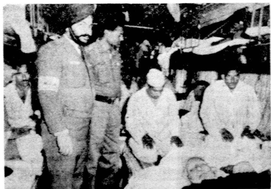
Pakistano belaisviai ir Indijos prižiūrėtojai