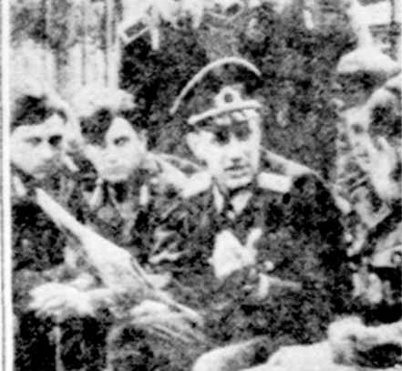
Rytų Vokietijos kariuomenės "dviasios vadas", komunistinis politrukas indoktrinuoja kareivius

Sovietų spaudoj jau spėta paaiškinti, kad konferencijos uždavinys išaiškinti politrukams naujus partijos uždavinius ir rasti būdus pagerinti politinį švietimą. Vakarų diplomatai sako, kad tikrasis uždavinys bus nušviesti apie naują, dabartinių sovietų priešų kėslus ir kaip suderinti komunizmo doktriną su koegzistencija su vakarais.