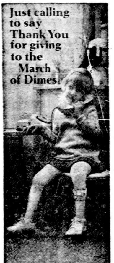
Just calling to say Thank You for giving to the March of Dimes.

Ar domitės lietuviška NUMIZMATIKA? Siūlau parduoti nepriklausomos Lietuvos monetų rinkinį—visas 14 monetų. Susitarus, skambiai išsinečiu, pats padengdamas apdraudus ir pašto išlaidas.