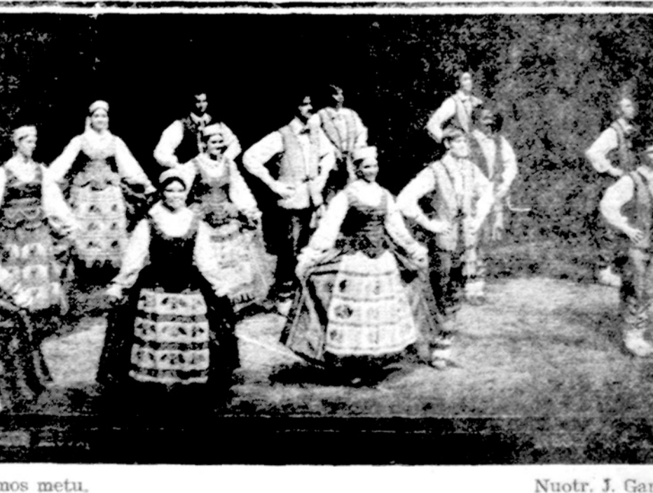
Dalis Grandinėles šokėjų programos metu.