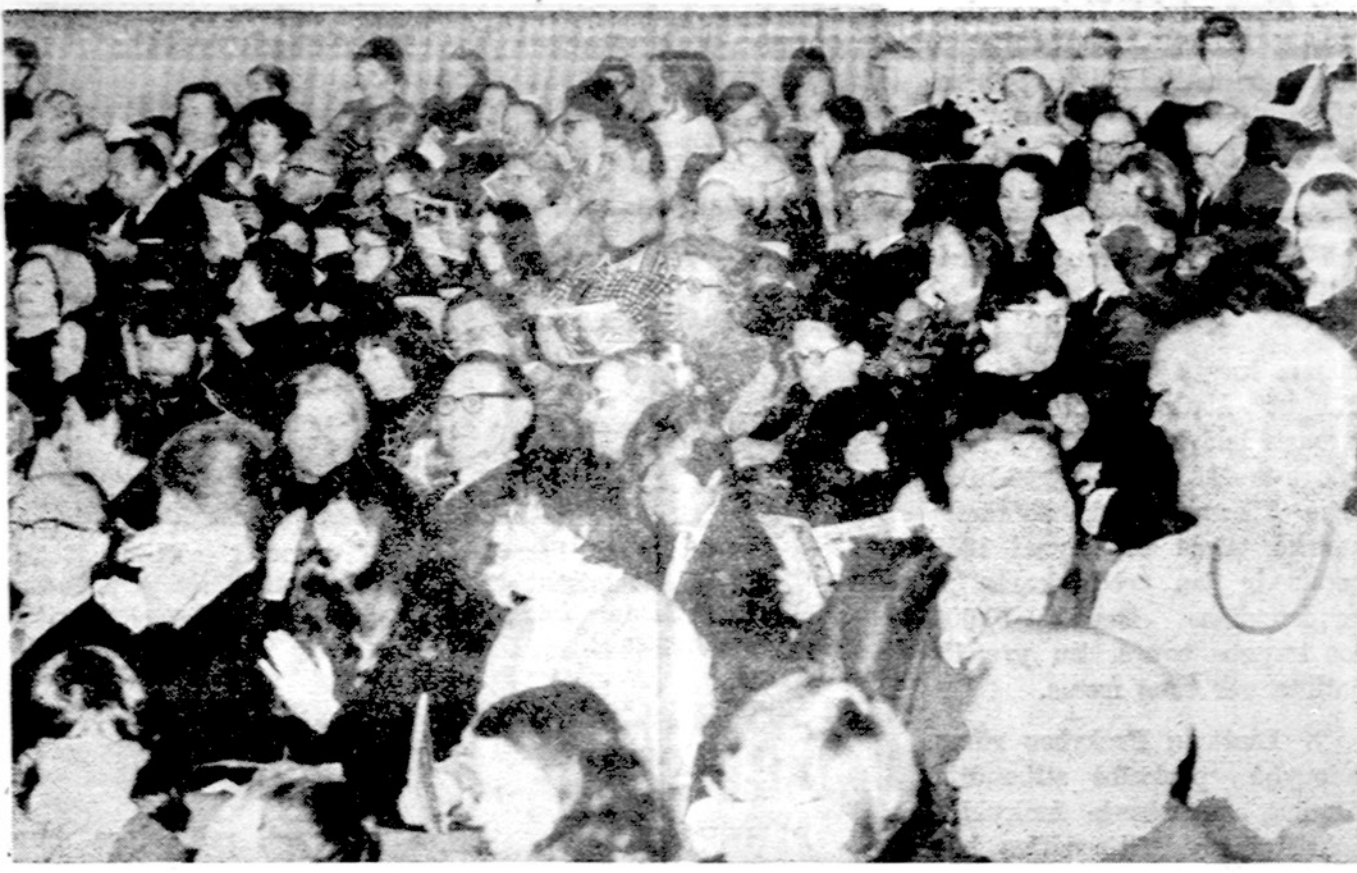
Kovo 18 d. Clevelande Cuyahoga Community College teatro salėje įvyko Grandinėls koncertas. Dalis dalyvių koncerto metu.