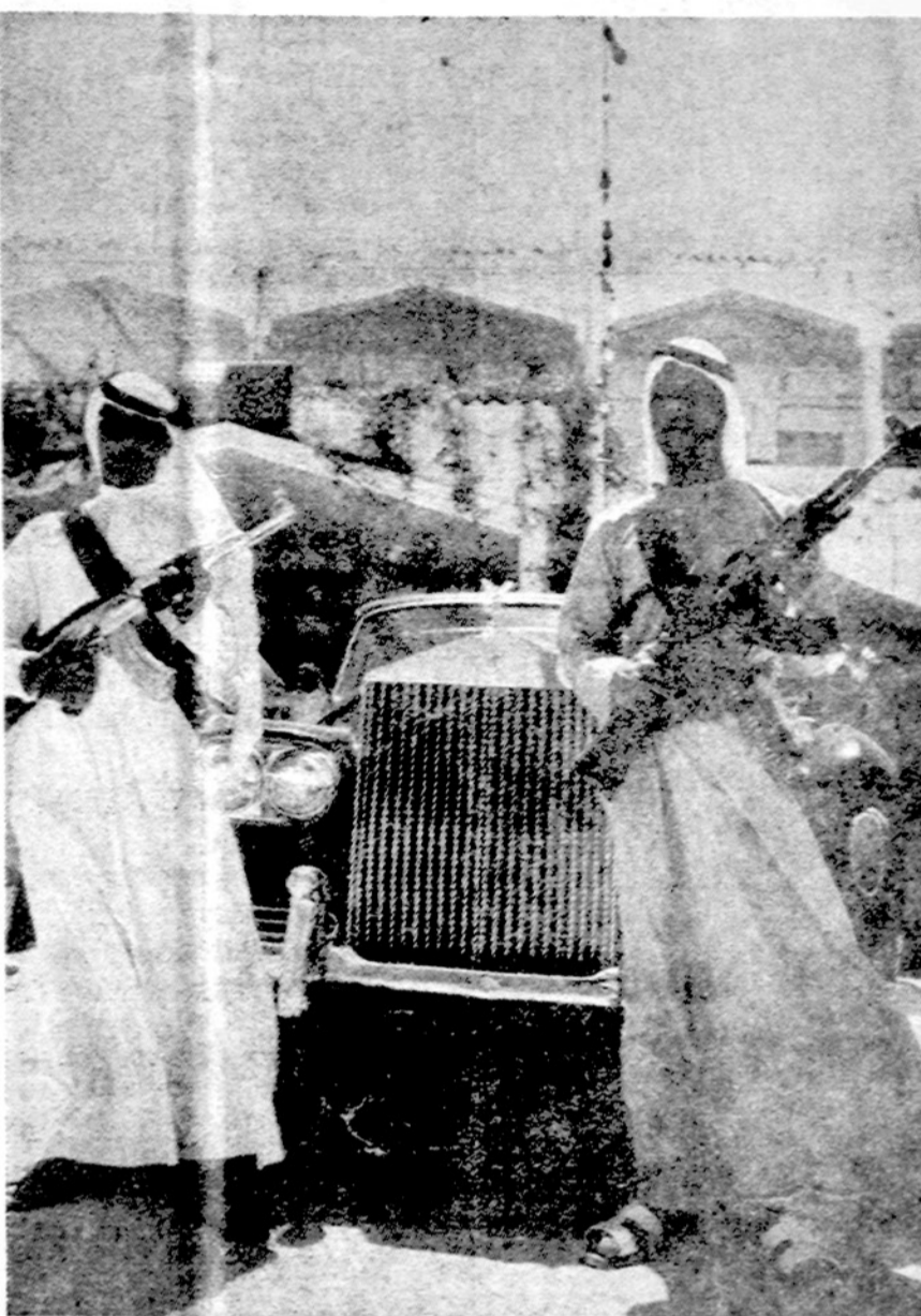
Kuwaito valdovo emiro Al-Sabah asmeninė apsauga

BANGKOK. — Grupė Tajo teroristų, ginkluotų pistoletais ir granata, pagrobė autobusą su 30 keleivių, jį nusivare į Bangkoko aerodromą ir pareikalavo juos lėktuvu nugabenti į Pekiną. Save vadina "juodojo rugsejo" organizacija.