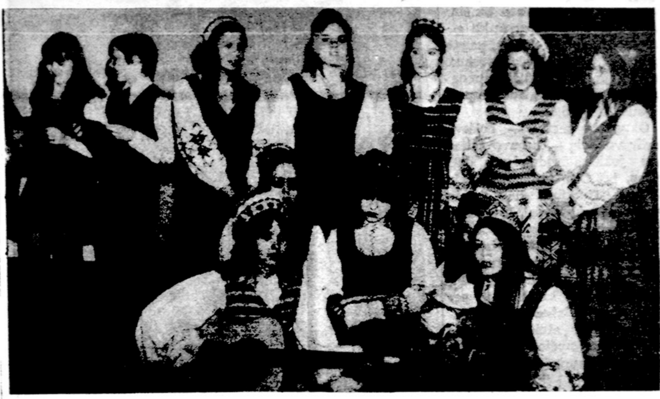
Chicago's Aukšt. lit. mokyklos mokiniai po atliktos programos.

Mokyklų savaitės proga daugelis mokyklų atidarys visuomenei duris, demonstruos programą ir dedamas pastangas, kad būtų išauginamas kraštui ir Bažnyčiai naudingas žmogus. Tėvai, registruodami vaikus į katalikiškas mokyklas, siekia ne tik sau gero, bet ir visai visuomenei, nes kiekvienas asmuo nusikaltimas ar laimėjimas nedalomai paliečia ir visus.