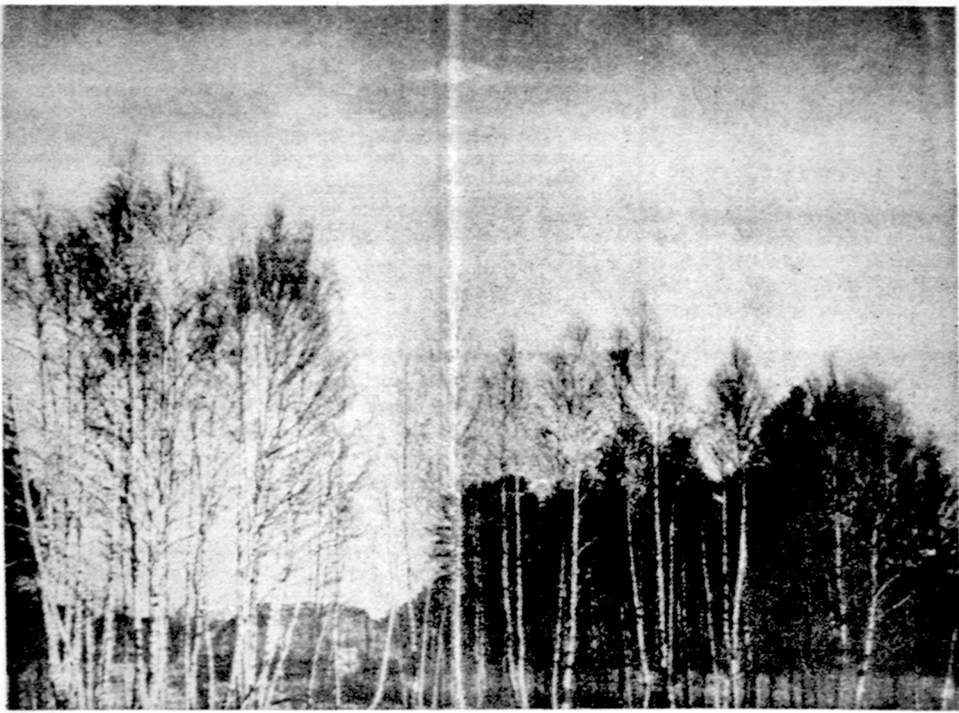
Lietuviškieji beržai laukia pavasario (Varėnos apylinkė)