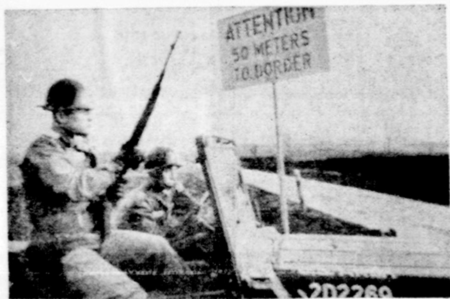
Amerikiečiai kariai prie Rytų Vokietijos sienos

Kinijos artimiausias uždavinys dabar yra sulaukyti sovietų įtaką Azijoje, o įtempimas pasauly kur nors gauti pirmąjį eilę svarbiausia dėl energijos šaltinių, o tik paskui dėl kitų priežasčių.