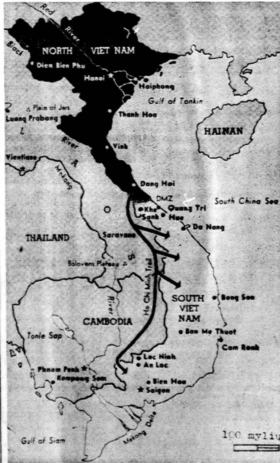
Indokitinos situacinis žemėlapis. Strėlėm pažymėtas Ho Či Minh kelias, kuriuo ir dabar Hanojus gabena sustiprinimus savo daliniams Pietų Vietnamui.

BONNA. — Vakar jau buvo žinoma, kad Brežnevas i Bonną atvyks gegužės 18 ir viešės penkias dienas.