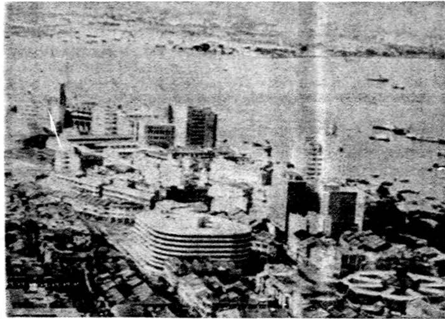
Singapūras, Tolimųjų Rytų vienas gražiausių miestų.

"The Violation of Human Rights in Soviet-Occupied Lithuania" (A Report for 1972). Leidinys gaunamas: Lithuanian American Community, Inc., 405 Leon Avenue, Delran, NJ, 08075