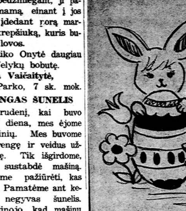
Piešė Rita Kupcikevičiūtė, Marquette Parko lit. m-los 7 sk. mok.