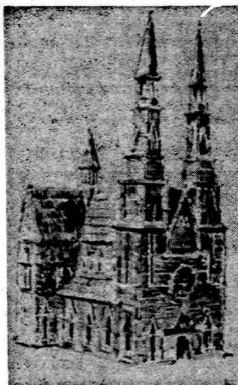
Miniatiūrinė bažnyčia, padaryta 1966 iš 40.000 degtukų Hannover, V. Vokietijoje

Laussane. Pasaulinės Biblinės sąjungos paskelbtai statistiniai duomenimis, šventojo Rašto tekstai yra išversti į tūkstantį penkis šimtus įvairių pasaulio kalbų ir tarmių. Vien tik praėjusiais metais, buvo išleisti 43 nauji šventojo Rašto leidimai įvairiomis kalbomis.