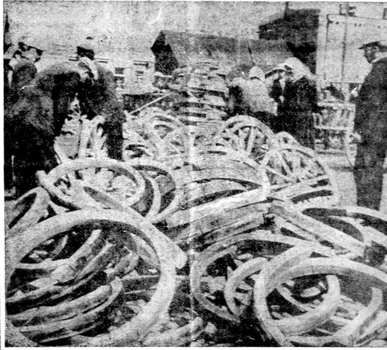
Račių kampas šiaulių turguje

DOCCA. — Bengalija gavo pirmuosius 10 MIG-21 ir pradeda kurti savo šalies karo aviaciją.