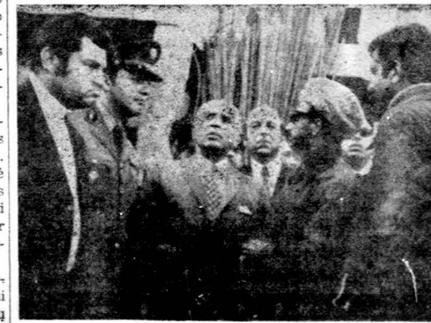
Arabų vada! susirinkę tariasi, ką daryti su Izraeliu. Antras iš dešinės Palestinos partizanų „Al Fatah“ vadas Arafat, vidury buvęs Sirijos premjeras Salam

HELSINKI. — Iš Europos Saugumo konferencijos paruošiamųjų darbų pranešama apie tam tikrus „kompromisus“. Sovietų ambasadorius Varelis Zorin minėjo, kad būtų galima konferencijoj svarstyti ir apie laisvųjų žmonių kontaktus, žinoma, pagal kiekvienos šalies įstatymus. Vadinas, bus galima sutarti ir pasirašyti laisvą susiekimą, bet jei tai prieštarauja sovietų stalinistiniams įstatymams, visi parašai bus verti nulio.