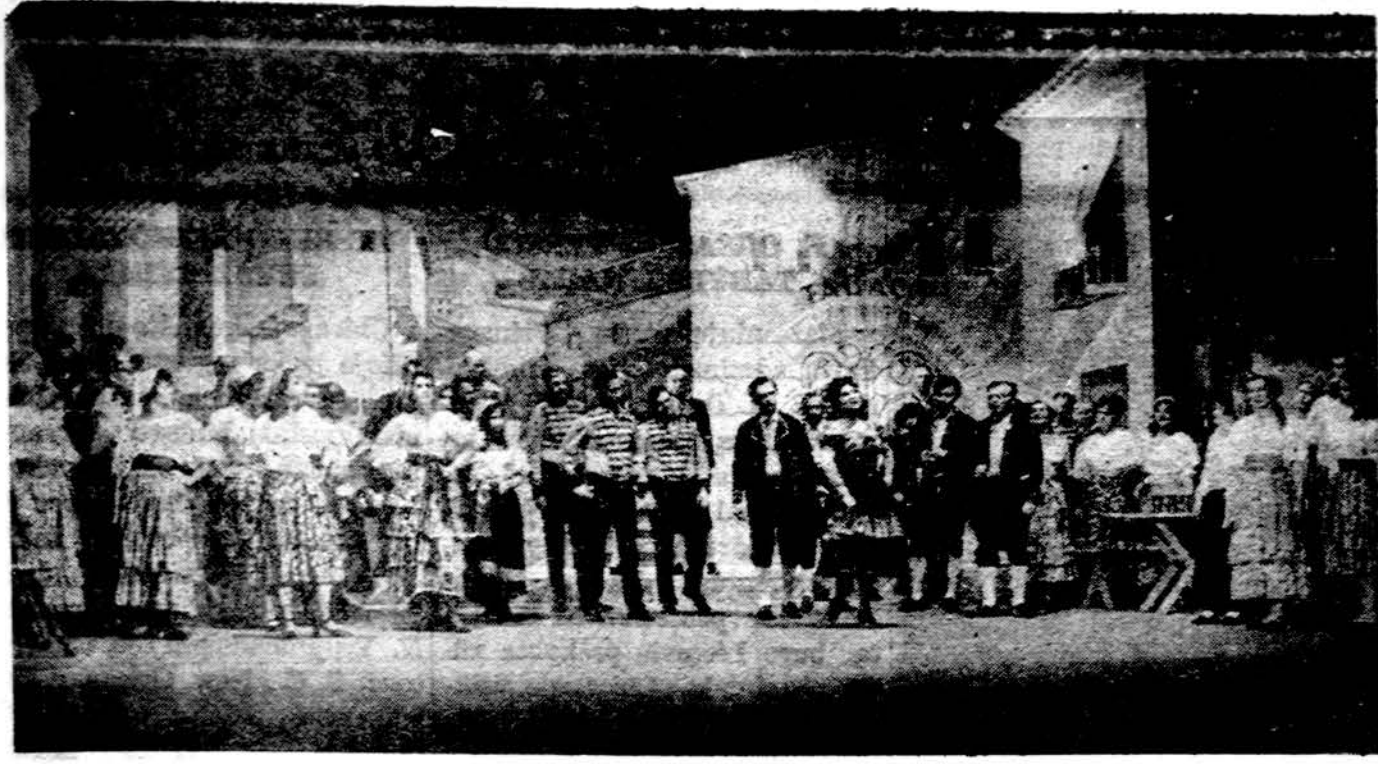
Carmen operos I-jo veiksmo detalės iš generalinės repetitijos. Matyti Chicago Lietuvos operos choras, dail. A. Valeškos dekoracijos. Pirmas spektaklis šį šeštadienį, antras — sekmadienį.