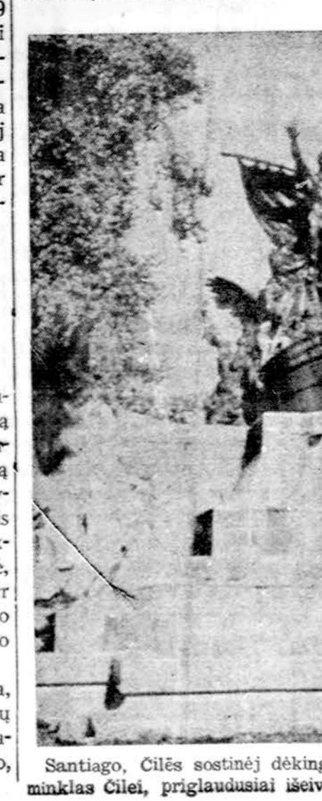
Santiago, Čilės sostinėje dėkingų vokiečių emigrantų pastatytas paminklas Čilėi, priglaudusiai išvėčius iš Vokietijos

Maršalas Andrei Grečko, karo ministeris, pirmas kariškis politbiure nuo 1957, kai buvo pašalintas maršalas Zukovas, II pasaulinio karo herojus. Grečko išrinkimas buvo netikėtus, aplenkė kelis kandidatus. Tik jis jau 69 metų, tai didelės atsakomybės imtis negali. Kariškio parinkimas rodo, kad karinė situacija tebėra rimta problema, žinant įtampimą su Kinija, noras ir karines pajėgas laikyti didesnėje partijos kontrolėje ir atvirksčiai — karinių reikalų reikšmės padidėjimą politinių sprendimuose.