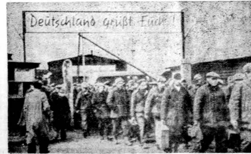
Gegužės 8 sueina 28 metai nuo II pasaulinio karo baigimo ir Vokietijos kapituliacijos. Viršutinėje nuotraukoje kelios dienos prieš karo pradžią kai Hitleris šantams tūkstančių karių žadėjo rojų ir atiduoti žemes, kurias jie užkariaus; apačioje — keliems metams praslinkus po karo tik likučiai pačių sveikusių vokiečių grįžo iš sovietų nelaisvės. Tą nuotrauką išsidėjęs vokiečių žurnalas "Der Spiegel" pridėjo: "Grįžę iš stovyklos, kuri buvo prie Kauno, pasakoja, kad vietiniai gyventojai buvo nepaprastai draugiški ir juos užjautė. Jie visomis priemonėmis slapta sėpė maistui, ir tik dėka jų daugelis vokiečių išliko gyvi."