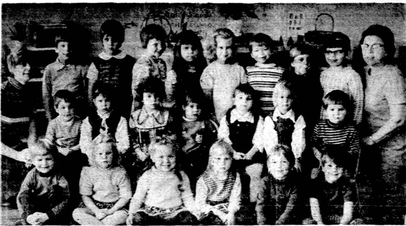
Kriauceliūno vardo Montessori vaikų namelių Chicagoje rytinės grupės mokiniai