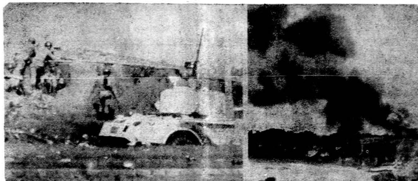
Scena iš neseniai buvusių kovų tarp Libano armijos dalinio ir Palestinos partizanų. Dūmuose skęsta viena palestiniečių stovykla netoli Beiruto, padegta nuo libaniečių artilerijos šūvio

BELGRADAS. — Jugoslavijos vieši Lenkijos komunistų partijos vadas Edward Gierek ir konferuoja su prezidentu Tito.