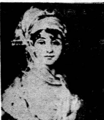
Dona Anatonija Zarate portretas, pieštas Goya, įkainuotas 1 mil. dolerių, kurį Armand Hammer padovanojo Leningrado Ermitažo muziejui

Kaip žinome, visi ligšioliniai kapitalistų susitarimai su sovietais baigėsi šių naudai, ir jiems apibūdinti labai tinka lietuviška patarlė: "Eik su velniu riestauti, paliksi be riestutų ir be krepsnelio". (bk)