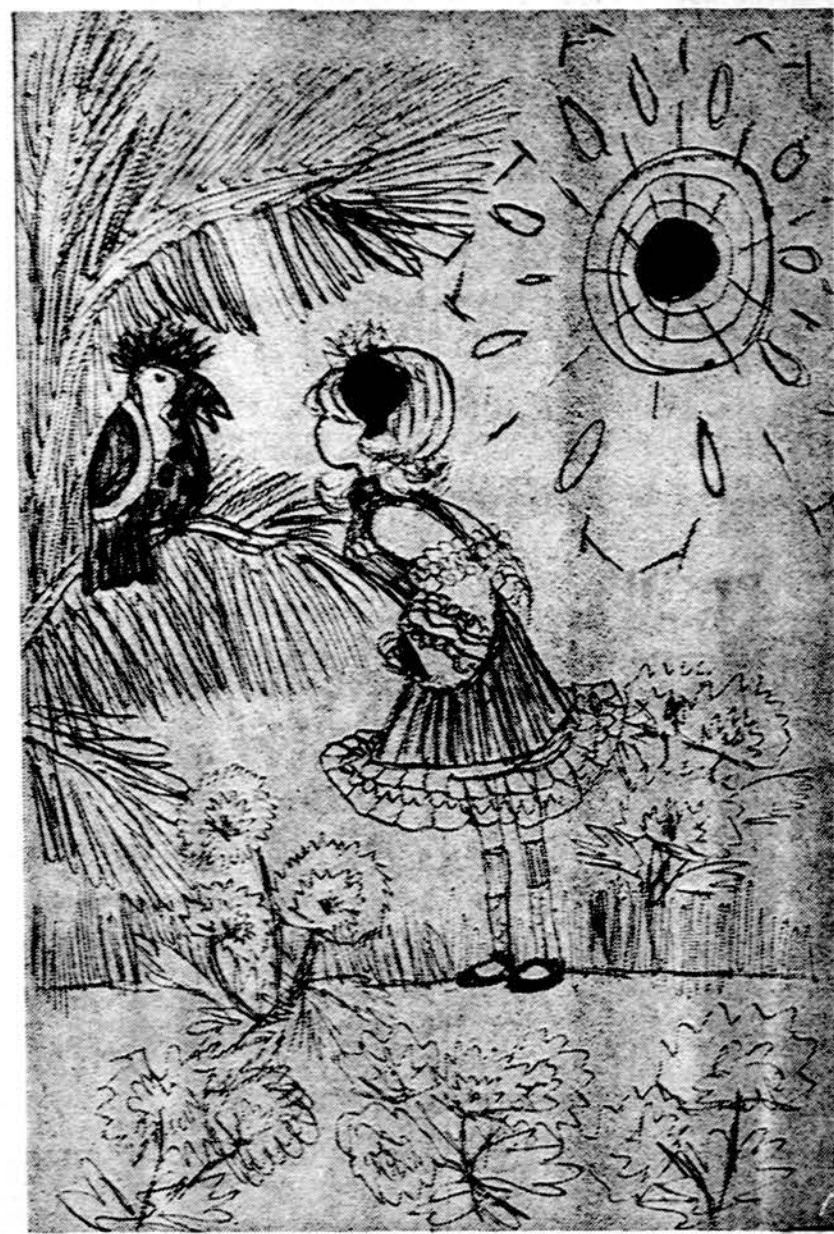
Ar žinai, kodėl aš pasipuošus? Šiandien mamytės diena. Piešė Rima Valiulytė, Marquette Prk. lit. m-la

Isteigtas Lietuvių Mokytojų S-gos Chicago skyriaus Redaguoja J. Plačas. Medžiaga siųsti: 7045 So., Claremont Avenue, Chicago, Illinois 60636