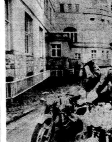
Į Vak. Vokietiją su oficialiu vizitu gegužės 18 atvyksta Sovietų Sąjungos komunistų partijos vadas L. Brežnevas. Svečias bus apgyvendintas šiame Petersbergo viešbutyje, netoli Bonnos. Abiejų šalių saugumo įstaigos jau dabar sėka, kad nebūtų padėta bombų ir kad nebūtų ruošiamos demonstracijos