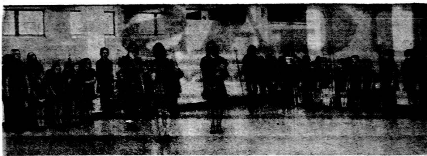
Aušros Vartų tunto paukštytės išsiriakijusios savo sueigoje.