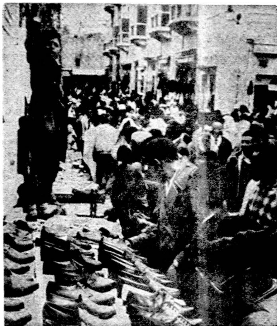
Tripoly, Libijoj, prekyba gatvėje