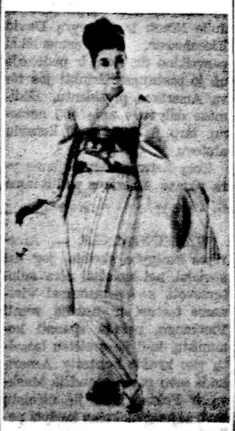
Paakutnės japonų mados

Tvirtinama, kad bioplasta galima pakeisti pakenktus žmogaus kūno audinius, "suklijuoti" lūžusius kaulus, atgauginti sąnarius ir net sujungti pažeistus nervus. Be to, ploni bioplasto vamzdeliai gali net pakeisti kraujagysles. Bioplastą nesunku apdirbti — ją galima štampuoti, gręžti ir teikti. jai