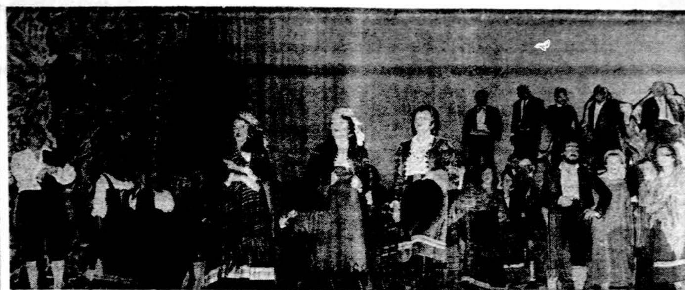
Iš Lietuvių operos Carmen pastatymo Chicagoje.

Chicagos kelionių biuras gegužės 19 ir 20 d. rengia išvyką į ezerą. Iš Chicagos upės ties State gatve ir Wacker Drv. išplaukiama 8 val. 45 min. ryto ir plaukiama netoli kranto į Calumet upę, paskiau Calumet-Sag kanalu, tada Chicagos sanitariniu ir laivų kanalu sugrįžtama atgal apie 3 val. 30 min. p. p. Pakelium bus duodami pusryčiai ir pietūs. Laivas šildomas, apsuotas stiklo sienomis. Teks praplaukti 1000 tiltų. Apie kelionės smulkmenas galima teirautis Chicago Travel