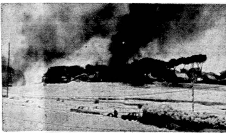
Po susidūrimo su Libano daliniais. Dega Palestinos pabėgėlių stovykla.