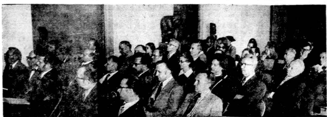
Lietuvių Fronto bičiulių suvažiavimo, įvykusio gegužės 5 d. Jaunimo centre Chicagoje, dalis dalyvių, besiklausančių lietuvių jaunimo simpoziumo.