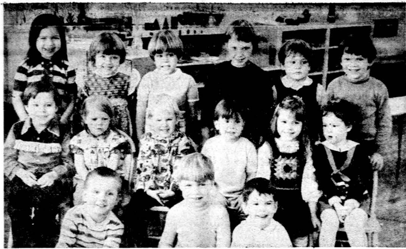
Kriaučeliūno vardo Montessori vaikų namelių popietinės grupės mokiniai