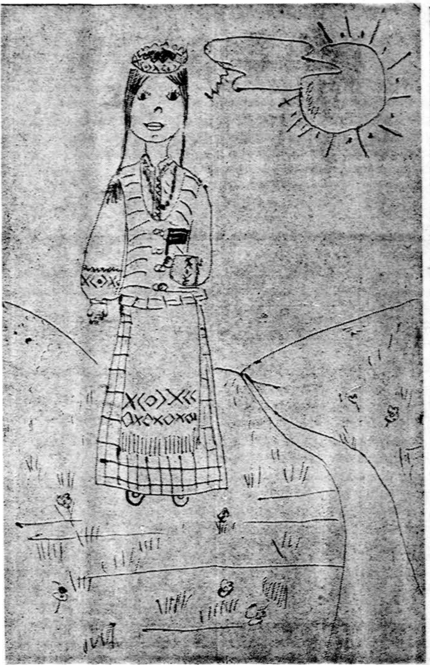
Aš lietuviutė, mamytei įteiksiu trispalvę vėliavėlę Motinos dienos progai. Piešė Dalia Garūnaitė, Marquette Prk. lit. mokykla.

Isteigtas Lietuvių Mokytojų 8-gos Chicago's skyriaus Redaguoja J. Plačas. Medžiagą siųsti: 7045 So., Claremont Avenue, Chicago, Illinois 60636