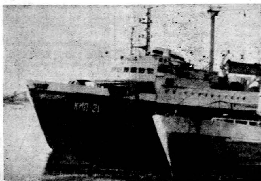
Rusų kariniai laivai Chittagongo uoste, Bengalijoje

Susidaro išpūdis, kad silpna, karo išvarginta, vakariečių apkeista ir jų neremiama naujoji Bengalijos respublika sparčiai rieda į sovietų glėbį. (bk)