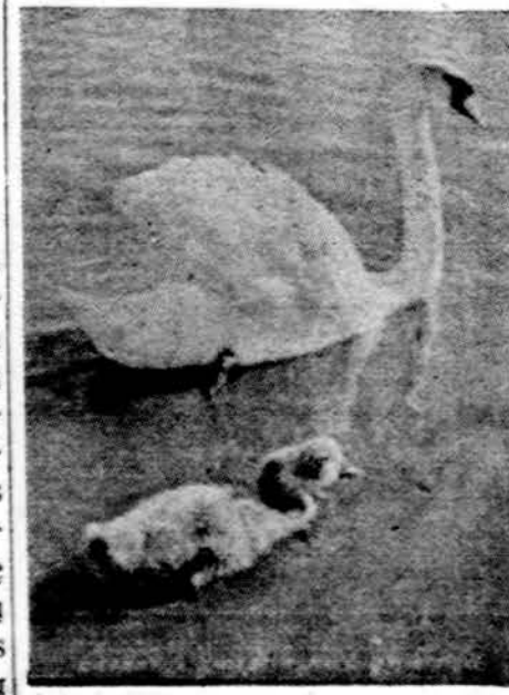
Pirmoji plaukiojimo pamoka

NEW YORK. — Amerikos biržos akcijos praėjusį pirmadienį smarkiai krito, pvz. Dow Jones industrijos akcijos vidutiniškai krito 18.29 punktu ir siekia 909.69, kai pernai buvo iškilusios virš 1000.