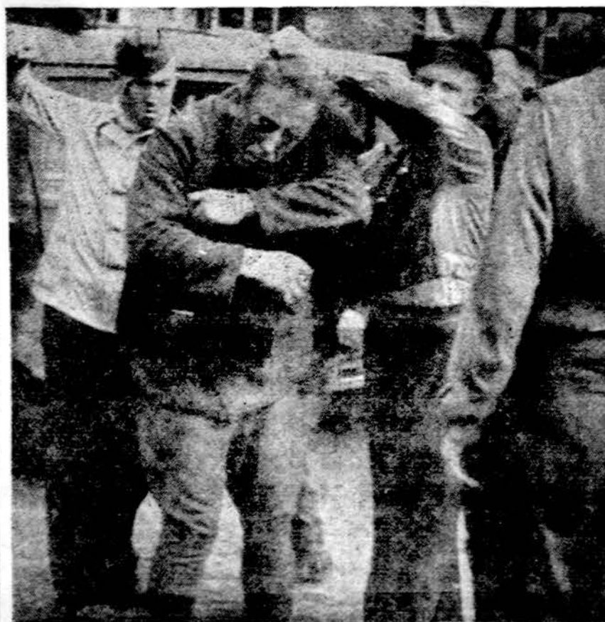
1945 metų gegužės mėnesį, II pas. karui pasibaigus, kažkur Vokietijoje buvo sovietai belaisviai ir darbininkai gatvėje pasigavę daugū nieku nekaltų vokiečių.

SALISBURY. — Kai grupė Kanados turistų lankė Viktorijos krioklį Afrikoje, Zambijos kareiviai paleido šūvius ir dvi moteris nušovė, o amerikietį vyrą persovė. Krioklys yra vienas gražiausių pasaulyje ir yra ant sienos tarp Zambijos ir Rodezijos.