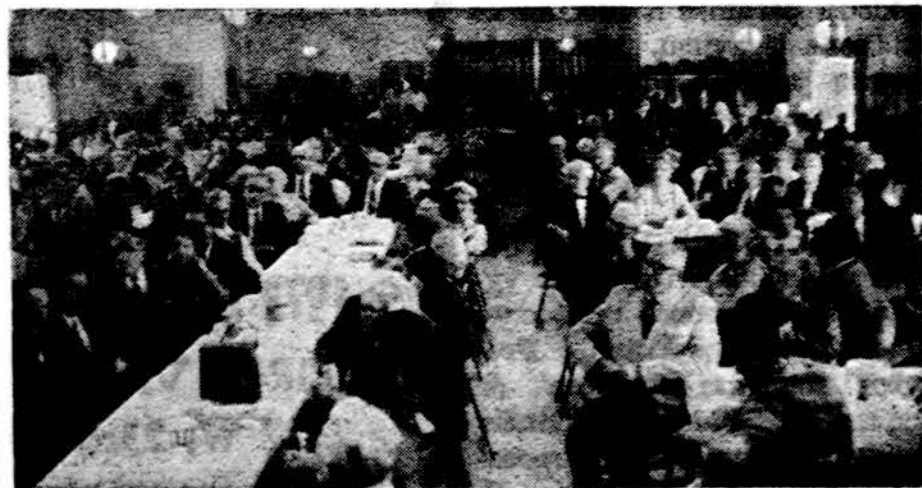
St. Petersburgo Lietuvių klube sekmadienio pietų metu.

Tad padarykime šią šventę lietuvių jaunimo manifestacija. Ne laukime, kad tik visada suvargęs, suprakaitavęs per repeticijas ir visokias programas mūsų jaunimas uždirbtų mums garbę ir pinigų. Bent retkarčiais ir jam parodykime gražią, nuosirdžią padėką. Tegul nelieka Chicagoje ir jos apylinkėse nė vieno lietuvių abituriento, kuris nedalyvautų šitame jam specialiai surengtame pagerbime. O vyresnieji savo susidomėjimu ir dalyvavimu parodykime jaunimui lietuvišką meilę ir jo įvertinimą. Tegul jaunimas grįžta iš šios šventės su gražiais prisiminimais, kad Tautinių namų salėje nerioģojo tuščios kėdės, bet ji buvo pilna ji mylinčios ir suprantantios lietuvių visuomenės. Vietų dar yra. Rengėjos nuosirdžiai kviečia dar neužsiregistravusių abiturientus, jų tėvus, namiškius, draugus ir svečius dalyvauti šioje didingoje jaunimo šventėje. Registruotis pas Vaitkienę telef. 737-1816.