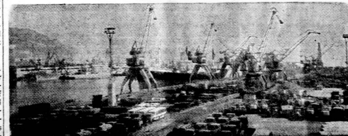
Vienas sovietų uostų Kryme

"1972 pradžioje vandentiekis buvo 1143 respublikos kaimų gyvenvietėse, o kanalizacija — 392 gyvenvietėse. Vandentiekio tinklų ilgis kaime sudarė 1145,5 km, kanalizacijos tinklų — 233,1 km". ("Liaudies ūkis", Nr. 2, 1973, 51 psl.).