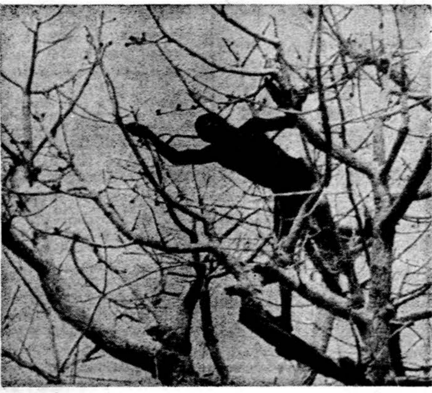
Vakarų vidurio Afrikoje siaučia didelis badas. Aukštutinėje Voltoje negras, penkerius metus nematęs lietaus, išskodamas savo vaikams ir sau maisto, skina sausos medžio pumpurus.

Dalnai apsiniauks, šilčiau, temperatūra netoli 70 laipsnių.