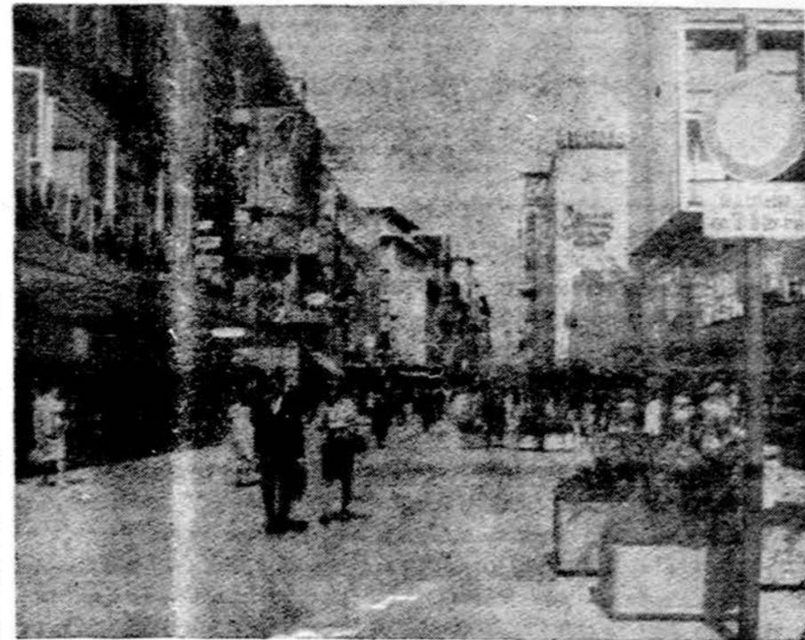
Bonnoje, V. Vokietijoje, Kettwiger gatvė, kur automobiliams judėjimas uždraustas, ir pėstieji džiaugiasi laisve