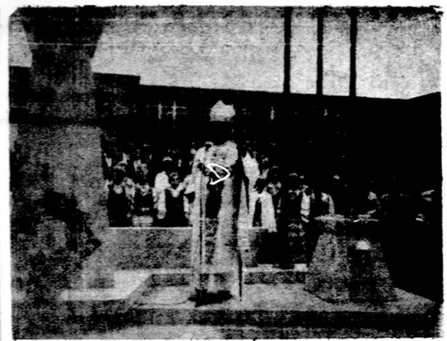
Paminklo šventinimo iškilmės Clevelande gegužės 13 d.

Lipam į antrą aukštą. Čia taip pat nėra jokių baldų, tik kampe sukloti iš lapų panti kilimėliai. Jūs pasitiesia nakties guoliui. Kad nesušaltų, ir naktį nesilakia su karštu puodu. Taip vienam kambary miega