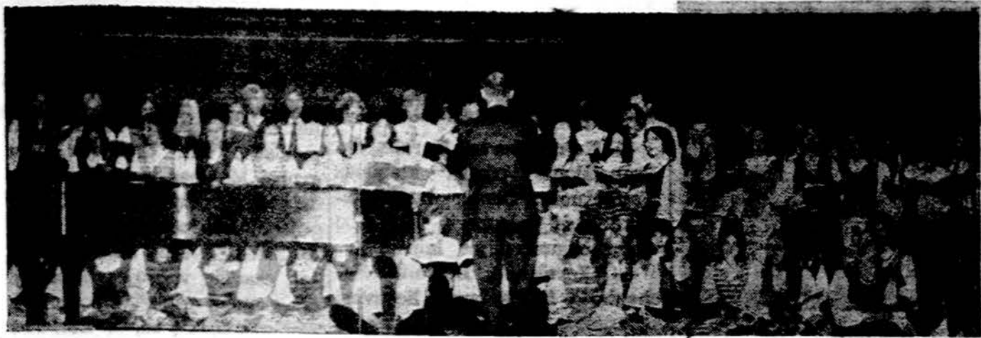
Chicago Jaunimo choras.