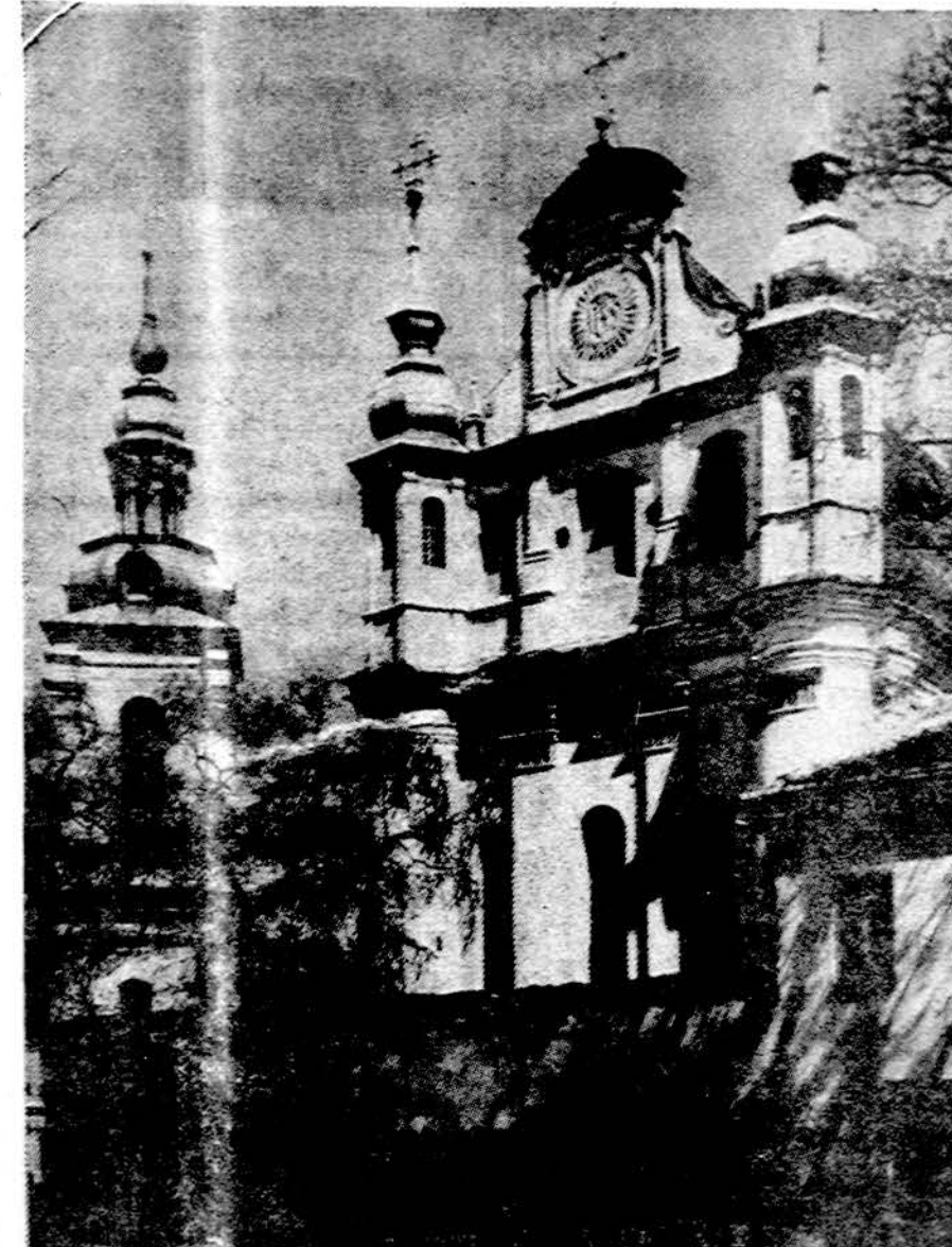
Vilniui — sostinei 650 metų

Šv. Mykolo bažnyčia. Statyta 1594-1625, nukentėjusi per 1655 rusų užpuolimą, vėliau restauruota ir 1652 pristatyti kaminiai barokiniai bokštai. Dabar bažnyčia iš tikinčiųjų atimta, paskelbta turinčia "sąjunginės reikšmės architektūros paminklu ir paversta architektūros muziejum.