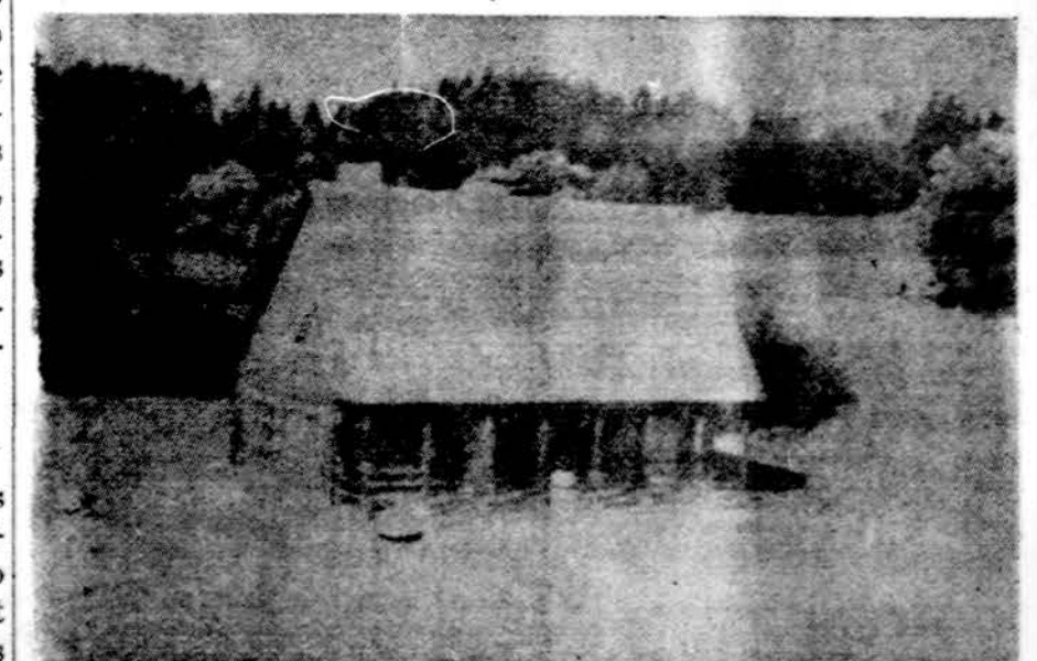
Krišnovės upelio, Raseinių apylinkėje, pirtis, sukūlusį daug pykčio Maskvos spaudoje, kodėl ji įrengta labai ištaigingai. Apie tai rašė The New York Times, buvo rašyta ir Drauge

VIENA. — Rytų ir Vakarų valstybių kariuomenių mažinimo konferencijoj Vakarai savo programą jau įteikė, bet Rytai dar ne. Kokie numatyti ir siūlomi svarstyti klausimai, nežinoma, paaiškės vėliau.