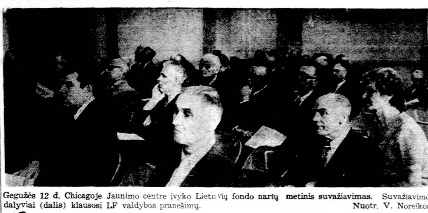
Gegužės 12 d. Chicagoje Jaunimo centre įvyko Lietuvių fondo narių metinis suvažiavimas. Suvažiavimo dalyviai (dalis) klausosi LF valdybos pranešimų.

Man atrodo, kad Nixono vyriausybės su didžiausiu spaudimu veikia, jėgų Sovietų S-ga būtų prekybos požiūriu traktuojama kaip viena geriausių šalių, suteikiant jai visas galimas lengvatas sovietinėms prekėms įvežti į Ameriką. Tą reikalą kiek užvilkinio žydų emigraciniai moksliniai norintems išvykti iš Sovietų S-gos. Tačiau tas reikalas LE apytinkas. Alta suaukinti nepaprastus susirinkimus, išrinkti aktyvių asmenų komitetus Brežneviui pasitikti. Komitetas, susitaręs su pavergtųjų tautų komitetu, turėtų sudaryti smulkų planą propagandai praveisti — supažindinti amerikiečius su komunistinio pavojais. Reiktų 100,000 lapelių, ar brošiūrėlių atspausdinti ir parodyti tikras Sovietų S-gos vyriausybės užmačas tautos pavergti ir visų laisvę bei nepriklausomybę panaikinti. Nereikėtų delsti nė dienos.