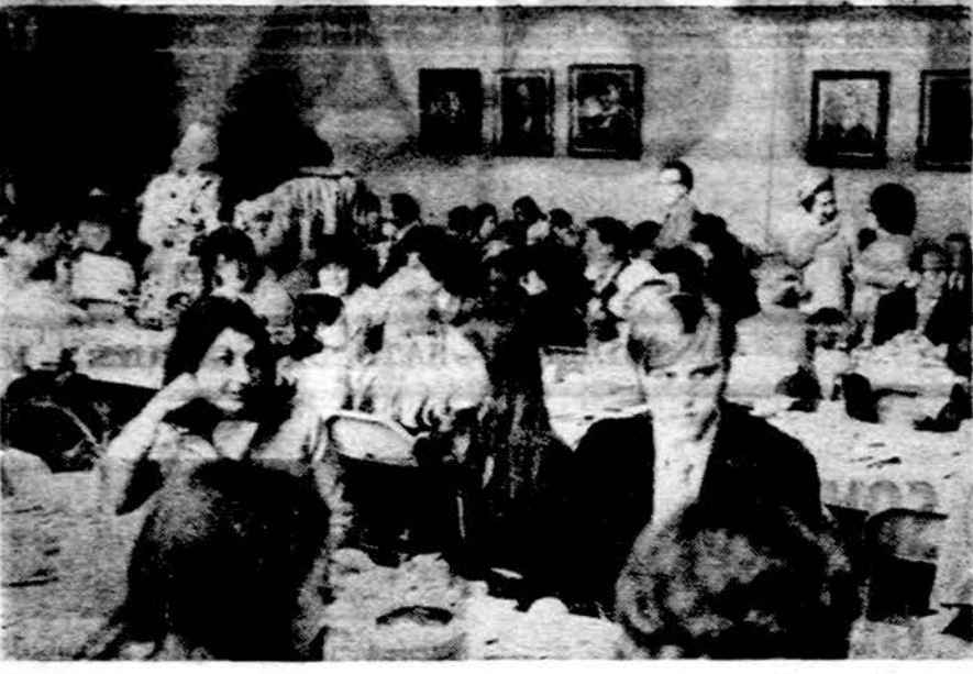
Studentai ir vyresnieji moksleiviai Chicago ateitininkų šeimos šventėje