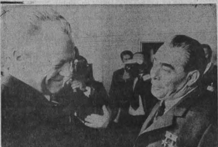
"Abu turime skirtingas sistemas ir gyvenimo filosofijas, bet kam dėl to kėdes laužyti, kaip sakė mūsų Nikolajus Gogolis", — o dabar taip kaltoja Brežnevas Brandtui Bonnoje.

NEW DELHI. — Pakistanas paleido 15 pirmųjų bengalų karo belaisvių. Pakistanas indiešius belaisvius yra paleidęs anksčiau, bet Indija tebeaiško 90,000 pakistaniečių belaisvių.