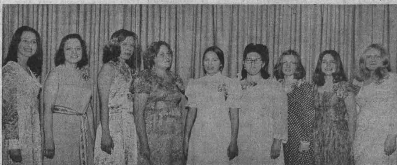
Abiturientės, kurios praėjusį sekmadienį buvo pagerbtos Chicagos Lietuvių moterų klubo.

Visos nekeičiamos šv. Mišių dalys yra atspausdintos vienoj labai gražiai išleisto knygelėje. Su šia knygele kiekvienas gali labai lengvai sekti naująsias šv. Mišias. Kai kunigas ar lektorius atskaito kintamąsias dalis, Jūs šioj naujoj knygelėje galite sekti visas nekintamąsias šv. Mišių dalis. Tekstas stambiomis raidėmis. Taip pat rasite rinkinį dažniausiai giedamų šv. Mišių metu giesmių. Užsisakykit šį naują šv. Mišių vadovą lietuvių kalba. Kaina 50 centų. 10% nuolaida, perkant 50 kopijų; 25% nuolaida, perkant daugiau kaip 50. Rašykite: DRAUGAS 4545 W. 63rd Street Chicago, Ill, 60629