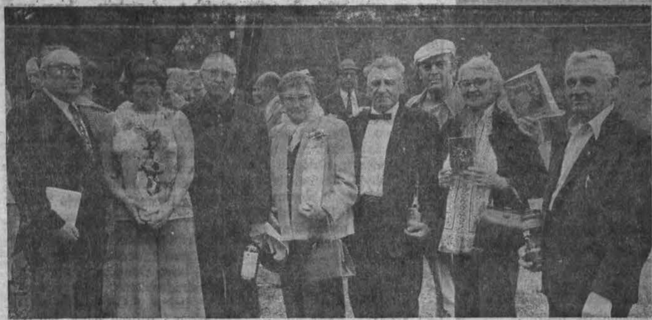
Laimėjusieji dovanas Hot Springs, Ark., Lietuvių Ben druomenės gegužinėje.