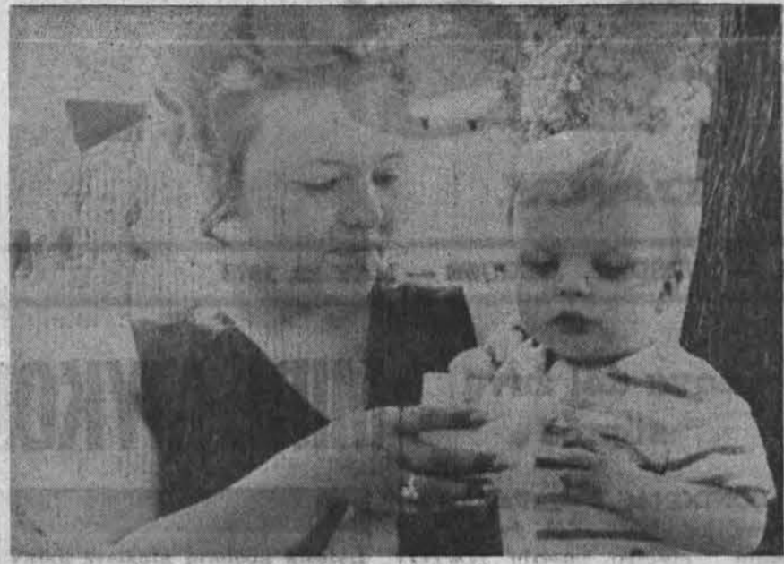
Vaikų sveikata pradeda klestėti namuose. Motinos ir Alvdūdas maitina tikrai sveiku maistu.

gaus sveikatos užlaikymui. Tais sveikata turi būti užlaikoma, trejopai; ne tik visiems suprantama kūno tolia, bet ir proto, o labiausiai jausmų. Tad visi į visiemis naudingiausią veiklą, visokių antraeilis reikalus palikę rytdienai.