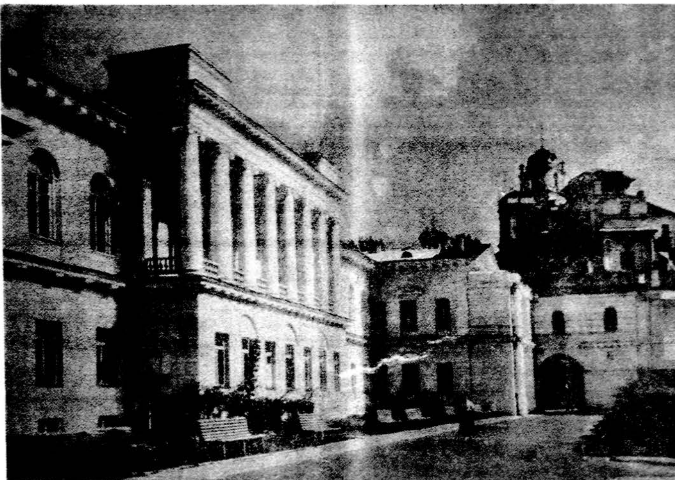
Vilniui — sostinei 650 metų

Neseniai surastas Lietuvos didžiojo kunigaikščio Vytauto 1401 m. vasario 4 d. laiškas Rygos pirkliams. Jis rašo esąs patenkintas prekybos kredito teikimo tvarka tarp Rygos ir Polocko pirklių. Linki Rygai klestėti, nori kad polockiečiai prastų senais prekybos sutartis