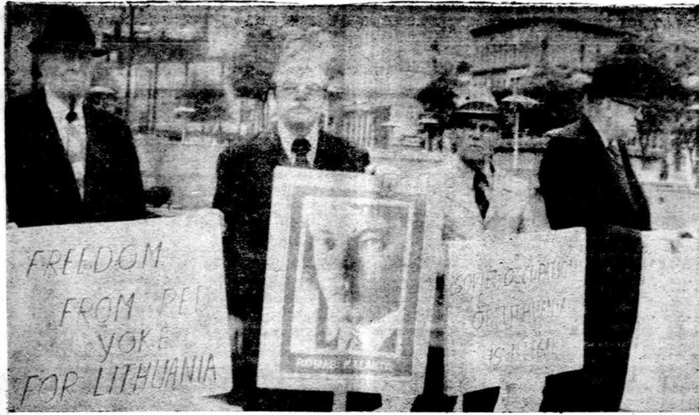
Atžymint Romo Kalamos metinės sukakties gyvybinę auką už Lietuvos laisvę gegužės 19 d. Detroito miesto centre vyko demonstracijos prieš pavergeją. Demonstracijoms vadovavo Detroito Organizacijų centras.

Lietuvių tautos dalis išsivijoje negali lūsti dėl naujų tradicijų, nes jos nepakeičia senos tvarkos santykių žmogui su žmogumi — net su amžinybės iškeliausiu. Daugybė mūsų tautiečių yra jau prisiglaudę amžinajam poilsui svetimoje žemėje, bet ir gyvieji tose pat žemėse kuria savo gyvenimus ir atlieka savo įsipareigojimus. Didelius darbus atlikusių vyresniųjų brolių ir sesių palaikyti išsklaidyti Sibire, pavergtos tėviškės kapinėse ir svetimuose kraštuose. Bet jie visi mums kalba savo praeitimi ir aukos dvasia, kalba šeimos intymia šiluma ir tautos įkvėpimu. Gyviesiems reikiama tik tą kalbą išgirsti, suprasti ir įvykdyti savo laike. Gėlės ir maldos kapų diena turi būti ne tik simbolinis, bet ir tikras mirusiųjų prisiminimas prie jų kapų ir jiems pastatytų paminklų, kad jie būtų mums paskatas kilti dvasiniu gyvenimu, jausti tautinį pašaukimą ir atlikti amžinybėje esančių tautos didvyrių ir savo brolių įpareigojimus. Pr. Gr.