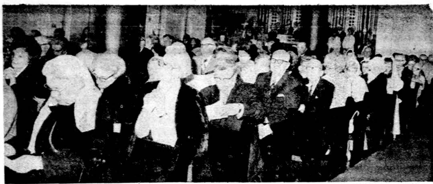
Dalis žmonių, susirinkusių Aušros Vartų par. bažnyčioje paminėti marijonų sukaktis gegužės 19 d.

× Lietuvių Fondas. Jūrų Šaulių Kuopa "Klaipėda", Cicero, IL, atsianti LF $100, padidindama savo įnašą iki $200. B. Butkus, jūrų šaulys, savo laisvėly rašo: "Cicero Jūrų Šaulių Kuopos "Klaipėda" v-bos posėdy vienbalsiai nutarta dar vienu šimtu dol. prisidėti prie jūrų kilmės darbo... Linkime užsimotą tikslą kuo greičiau pasiekti... "Bokim geruoju". Valdyba". LF adresas: 2422 W. Marquette Rd., Chicago, IL, tel. 925-6897 (pr.)