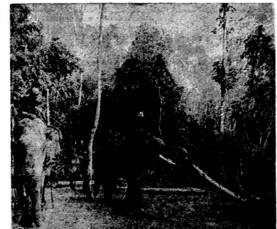
Tajuje dramblys laikomas naminiu gyvuliu ir dirba sunkiuosius darbus, krauna medžių rąstus

Dalinai saulėta, bet vėsu, apie 60 laipsnių.