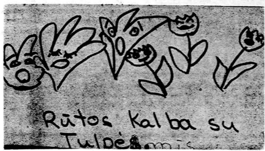
Piešė E. Petrauskaitė, Londono lit. m-los mokinė

Bet urvelyje voverė dar daugiau išsigando, nes ten ji pamatė miegančią Rūtą. Voverė nežinojo, ką daryti, bet mama Tulpė greit pranešė, kad medžiotojas jau nuėjo sau ir kad voverė iš urvelio jau gali išlįsti. Tada voverė visoms tulpėms