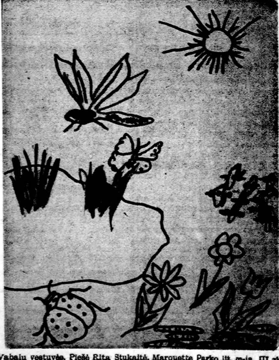
Vabaly vestuvės. Piešė Rita Stukaitė, Marquette Parko lit. m-la, III sk.

— Kaip manai, kodėl žmonės važiuoja atostogų prie jūros? — Todėl, kad pėsčiam toli.