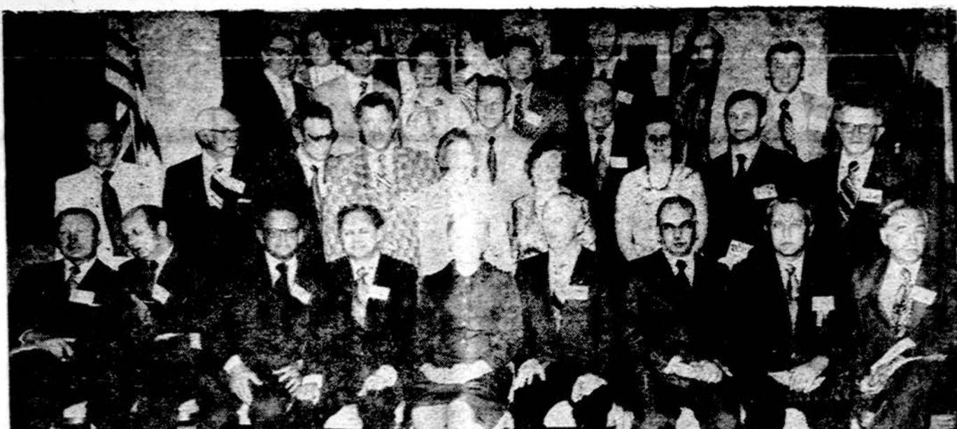
Dalis Amer. lietuvių gydytojų sąjungos suvažiavimo dalyvių Sheraton viešbutyje, Chicagoje.