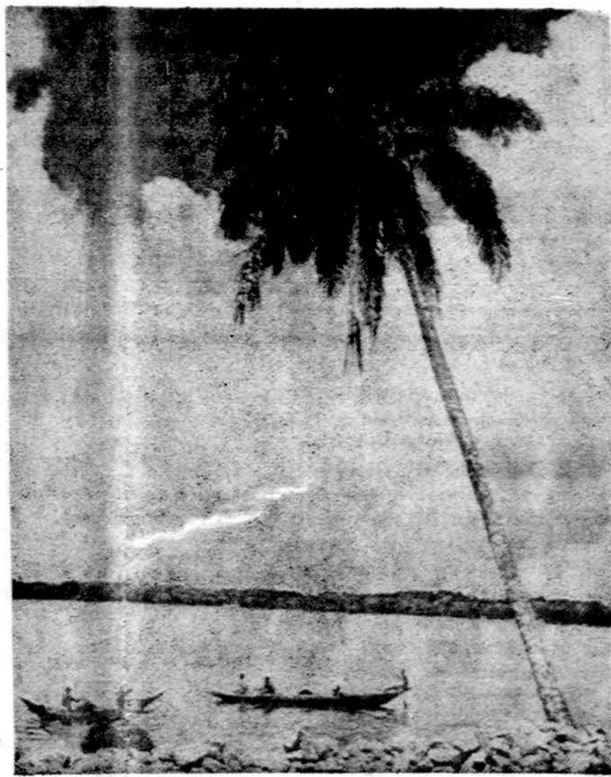
Nigerio upė, Nigerijoje, vakarinėje Afrikoje.