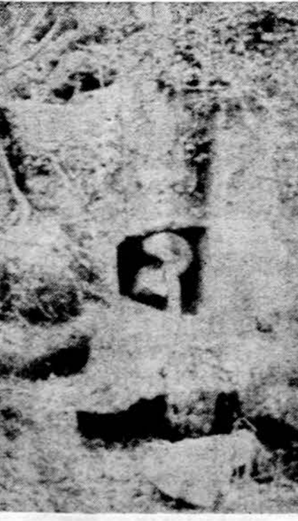
Italijoje plečiasi meno vertybių vagsystės. Pastaruoju metu ypatingai išplėčiami seni romėnų laikų kapai, vagiant jų įkapes. Nuotraukoj apipiektas senas kapas prie Cerveteri.

Pereitų metų lapkričio mėnesį Jugoslavija pasirašė su Sovietų Sąjunga susitarimą, kuriuo sovietai pasižadėjo ligi 1980 suteikti Jugoslavijai įvairių masinų bei fabriku įrengimų už 540 mil. dol. lertų. Iš viso Maskva pasižadėjo duoti Jugoslavijai 1.3 bil. kreditų, įruošti anglių kasyklas, rafinerijas, elektros jėgaines, cemento fabriku, Zagrebo mieste požeminius traukinius ir kt. Visų šių įrengimų statyba turėjo suteikti jugoslavams daugybę darbą ir todėl Tito uždraudė jugoslavams važiuoti uždariauti į vakarų kraštus, Jugoslavija emė mažinti