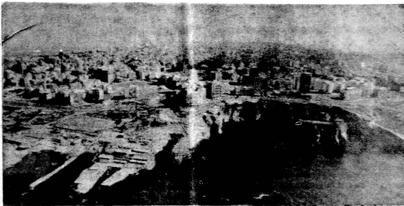
Beirutas, modernus ir vakarietiškas, daugiausia minimas Viduriniųjų Rytų miestas

Pagaliam Maskva emė vis rečiau savo prekes siuntinėti. Iš bendro 50 projektų skaičiaus, iš kurių ligi 1973 IV.1 turėjo būti 22 atgabenai, tebuvo pristatyti vos nepilni