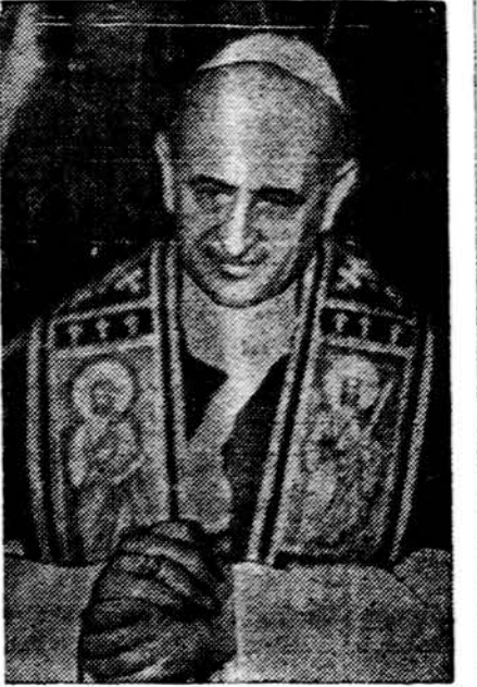
Šv. Tėvas Paulius VI

Žmogus, dirbąs, kurias, pasiūto paskendęs savo kūriniuose,