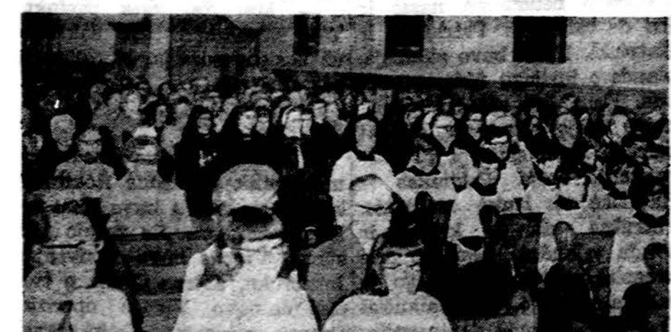
Kun. Alb. Janiūno 25 m. jubiliejinės šv. Mišios šv. Petro bažnyčioje gegužės 6 d. Nuotr. P. Pliškėnio

Perskaite Draugą, duokite kitiems pasiskaityti.