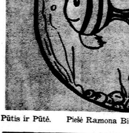
Pūtis ir Pūtė. Piešė Ramona Bielskytė, Marquette Parko, 3 sk. mok.