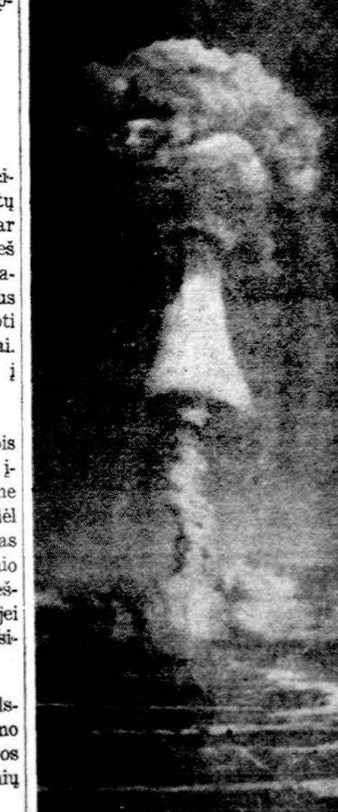
Dailus, bet šurpus reginys. Tai praėjusiais metais Pacifike prancūzų susprogdinta vandenilio bomba. Prancūzai atominius ar vandenilio sprogdinimus ruošiasi daryti ir šią vasarą ir susilaukia smarkių protestų.

WASHINGTONAS. — Sovietų saugumo žmonės, kurie pirmiau, negu lankysis Brežnevas, apžiūrė jo lankymosi vietas, susižavėjo dviem: Californijos Disneyland ir Pontiac, Mich., moderniu GM sunkvežimių fabriku.