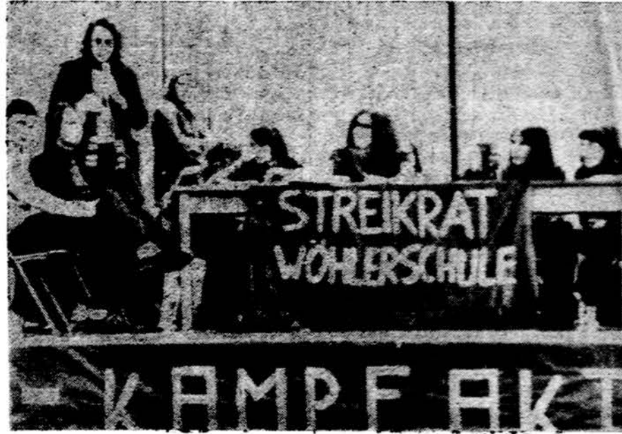
Daugelyje vak. Vokietijos gimnazijų sustreikavo moksleiviai, reikalaudami daugiau laisvės ir įvairių lengvatų. Čia matome streikuojančią klasę Frankfurte

Taigi vargas tas ateizmo propagandininkas neturi nei vadovėlių, nei vaizdinių priemonių, kurios būtų „pritaikytos lektori-