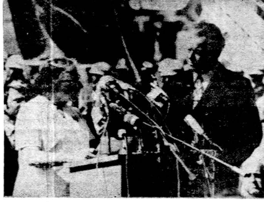
Brandtas išvyksta iš Jeruzalės. Kairėj Izraelio premjerė Golda Meir

Tarp kitų sutartų punktų minima, kad Amerikos lėktuvai nustos žvalgę š. Vietnamo teritoriją; paskubins sulaukyti, minų išėmimą š. Vietnamo pakrantėse, vėl svarstys apie pagalbos suteikimą Hanojui.