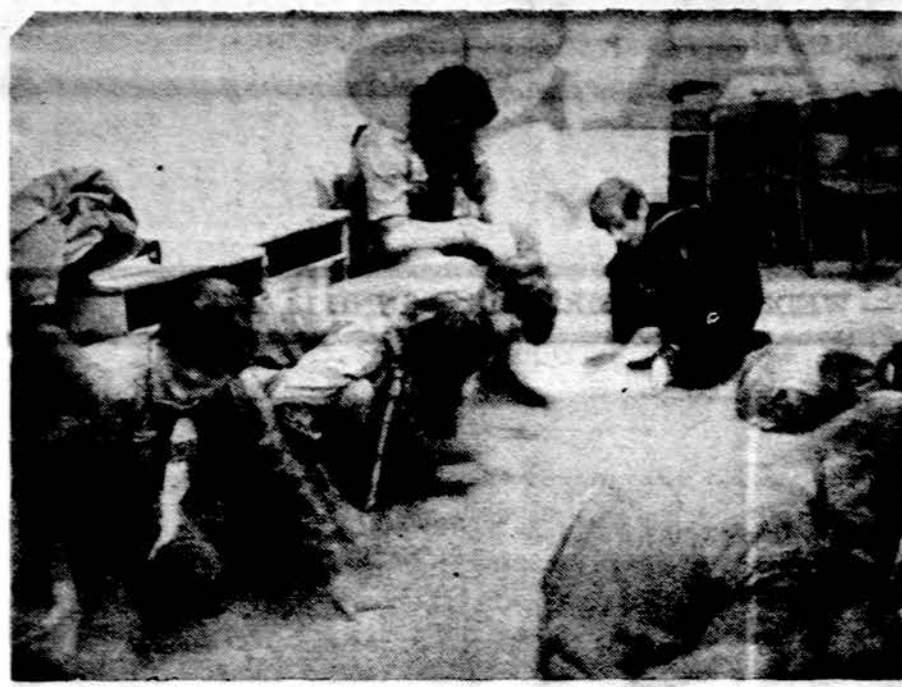
Lituanicos tunto skautai žaidžia sueigos metu.