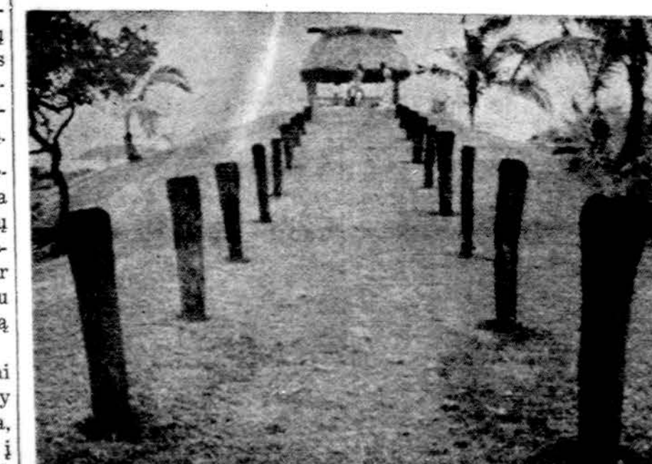
Fiji respublikos Pacifike pakalės polsio vicia

Daugiausia saulėta, vėsiu, sausia, apie 70 laipsnių.