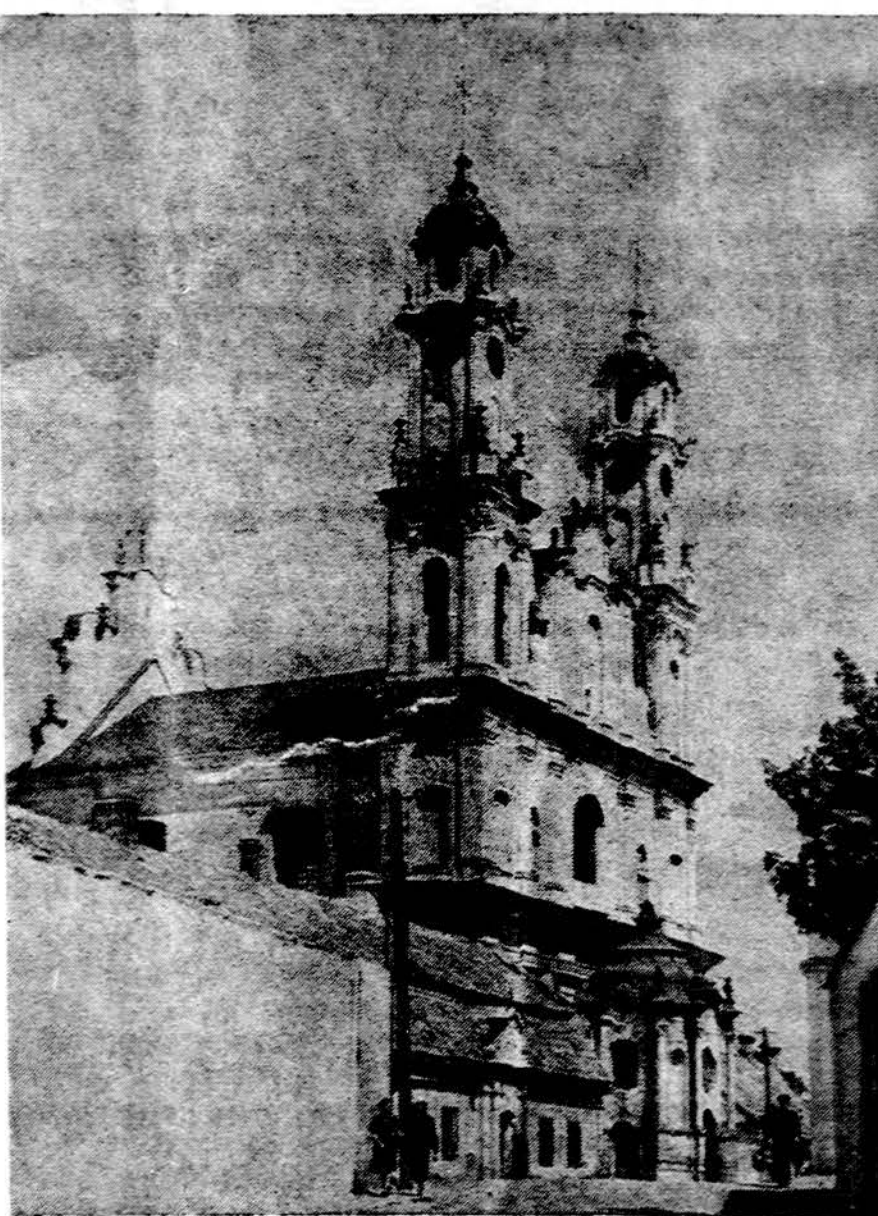
Vilniui — sostinei 650 metų

KOPENHAGA. — Islandijos užsienio reikalų ministeris Einar Agustsson pareiškė, kad dar šį mėnesį jie pradės žygius išvaryti amerikiečius karius iš Keflaviko aviacijos bazės. Amerikiečių ten yra apie 3,000.