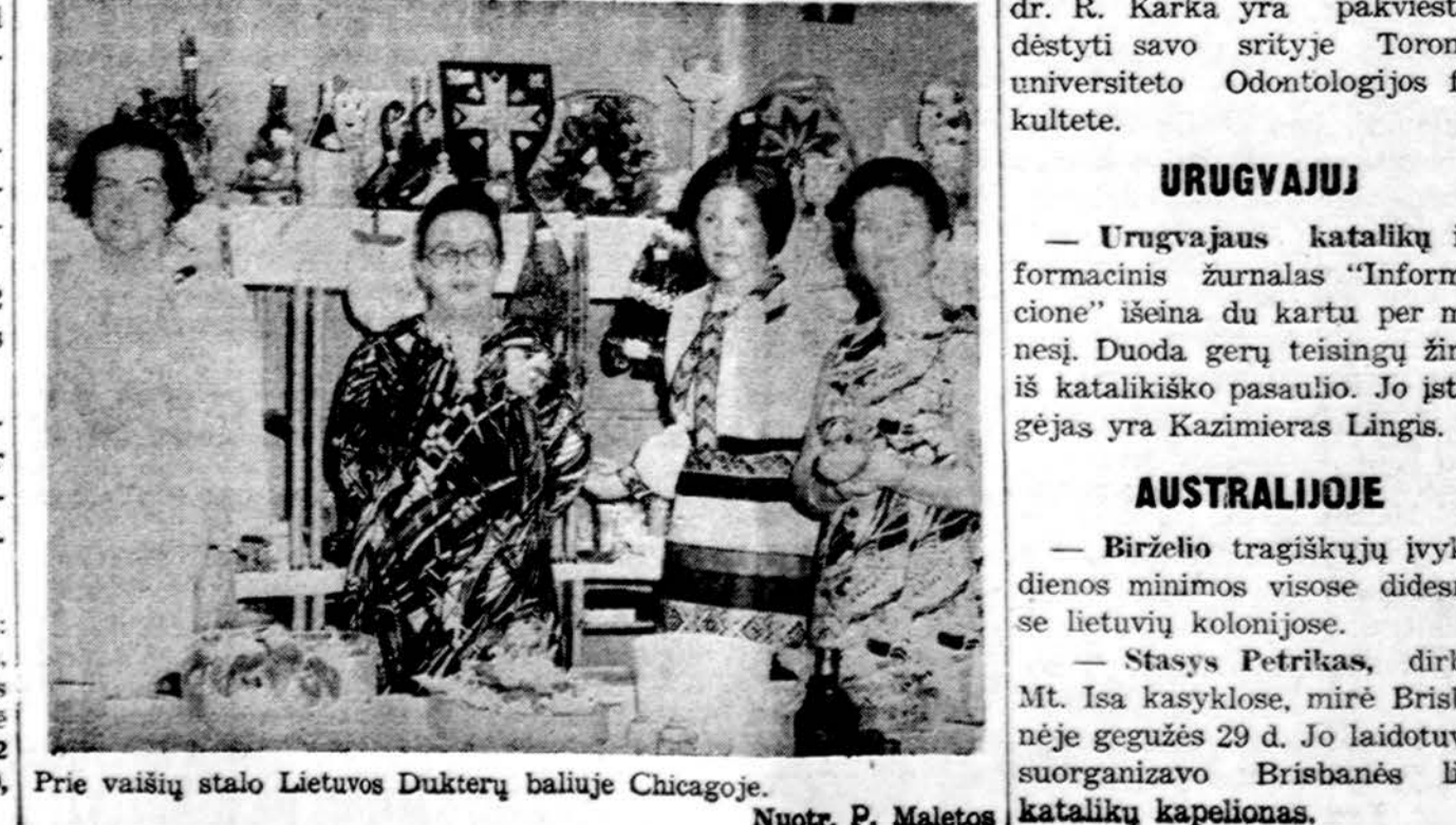
Prie vaišių stalo Lietuvos Dukterų būliuje Chicagijoje.