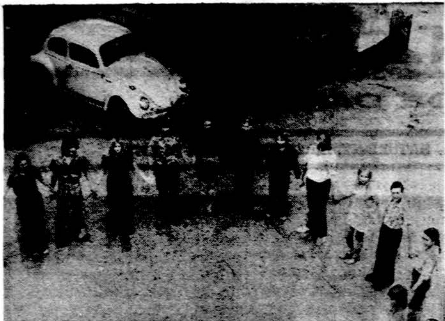
Sao Paulo moksleiviai ateitininkai repetacijos metu