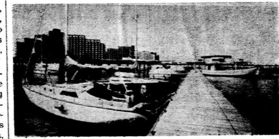
Vakariniai vokiečiai, plėsdami turizmą, prie Šiaurės jūros įsteigė aštuonis naujus turistinius parkus ir pastatė moderniskus viešbučius. Čia matome vieną tokių parkų Schleswige-Holsteine.

Chicago multimilijonierius W. Clement Stone, kaip dabar skelbiama viešai, Nixono išrinkimui paaukojo 2 milijonus dolerių.