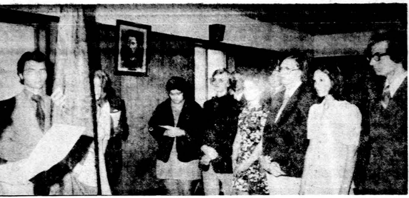
Detroito studentai ateitininkai duoda studento ateitininko priesaiką Detroito at-kų šeimos šventės metu birželio 3 d. Dainavoje.