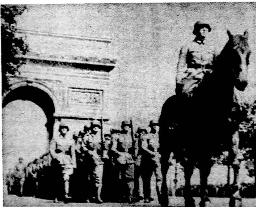
Tuo pačiu laiku, 1940 birželio vidury, kai į Lietuvą įsiveržė rusai, į Paryžių po Triumfaline arka įžengė vokiečiai. Ir lietuviams, ir prancūzams tai buvo liūdniausia šio šimtmečio diena.

MIAMI. — Meyer Lansky, kuriam pilytėbės nedavė Izraelis, jokia kita šalis Lotynų Amerikoje jo irgi nepriėmė, turėjo grįžti į Ameriką ir laukti teismo už visokias didelio masto suktybes. Į pirmą teismą neatsvyko, ir už tai buvo nubaustas vienus metus ir vieną dieną kalėjimo. Jis, grįžęs į Ameriką, buvo suimtas, bet už 250,000 dol. užstato išleistas.