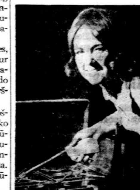
Yra išrastas prietaisas, vadinamas Spark Gun, kurio pagalba greitai galima įdegti anglis kopimui.

O kas bus, jei parkas norės ir likusia dalį Beverly Shores nupirkti? Nieko blogo. Bus tik dvigubas uždavis. Sumokės už namą ir tu juose nei sėjes, nei pioves, kaip tas paukštėlis, gražiai gyvensi. Todėl ir norisi lietuvius paraginti, kol dar nevelu, kurkime Beverly Shores. Kai parkas nupirks, bus per vėlu ir tada at-