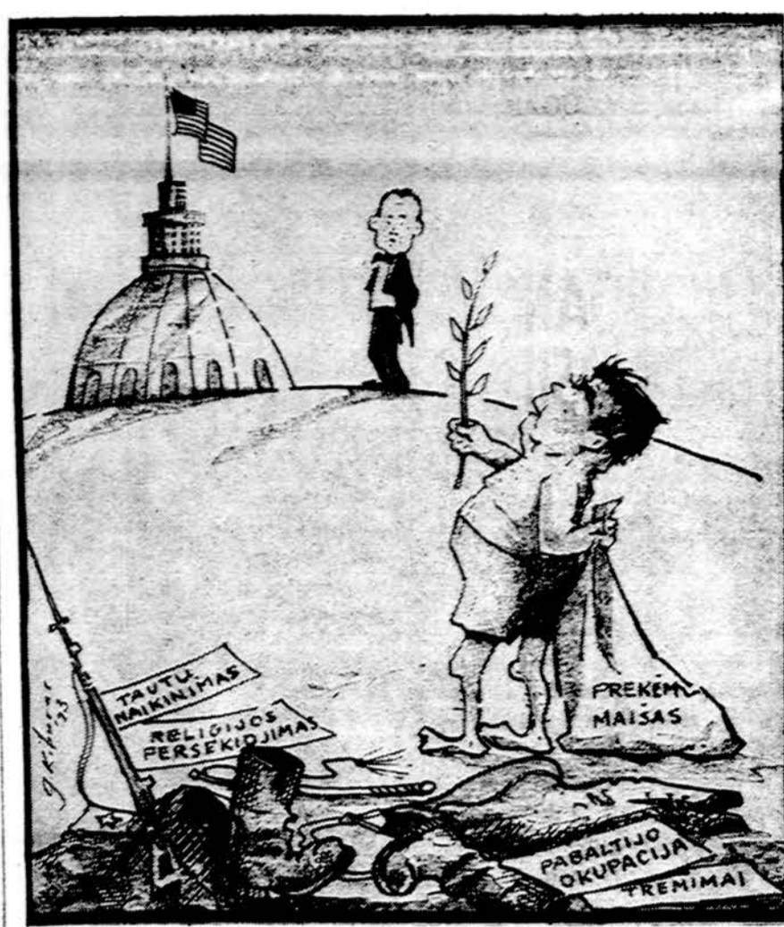
Apnuogintas tautų pavergėjo Brežnevo vizitas Washingtone

1970 m. staiga iškilo daugybė kritiškų grasinimų. Nusizengimų bangos užliejo visą valstybę su griauančiais veiksmais. 1971 m. buvo pavogta 47 tonos svarbių studijų rinkinių ir stabų. Paslaptis išvogimas su-