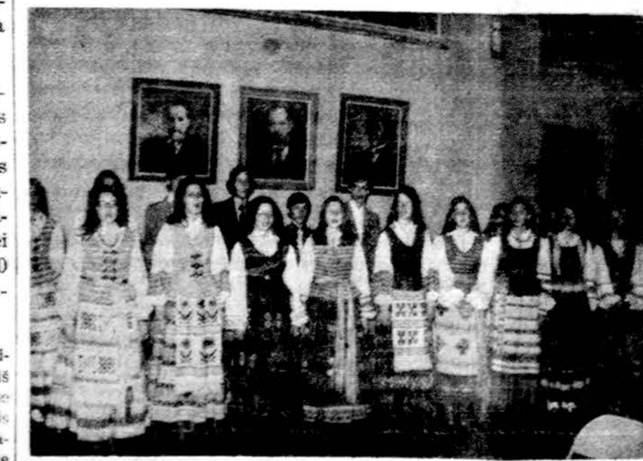
Chicago Aukšt. lit. mokyklos dvidešimt antroji abiturientų laida.

(Užsakant paštu, reikia pridėti 50 centų mokesčiams ir paštui)