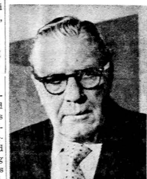
Prezidento paskirtasis FBI direktorius C. Kelly

WASHINGTONAS. — Senate teigiama, kad prezidento paskirtasis FBI direktorius Clarence Kelly bus greit patvirtintas. Vakar jis kalbėjo Senato juridinio komiteto posėdyje ir atsakinėjo į senatorių klausimus. Atrodo, jog daugiausia buvo ir dar bus klausinėjamas apie raišines riaušes Kansas City 1968 metais ir jų numalšinimą. To miesto juodukai protestuoja dėl jo paskyrimo ir siekia, kad Senatas jo netvirtintų.