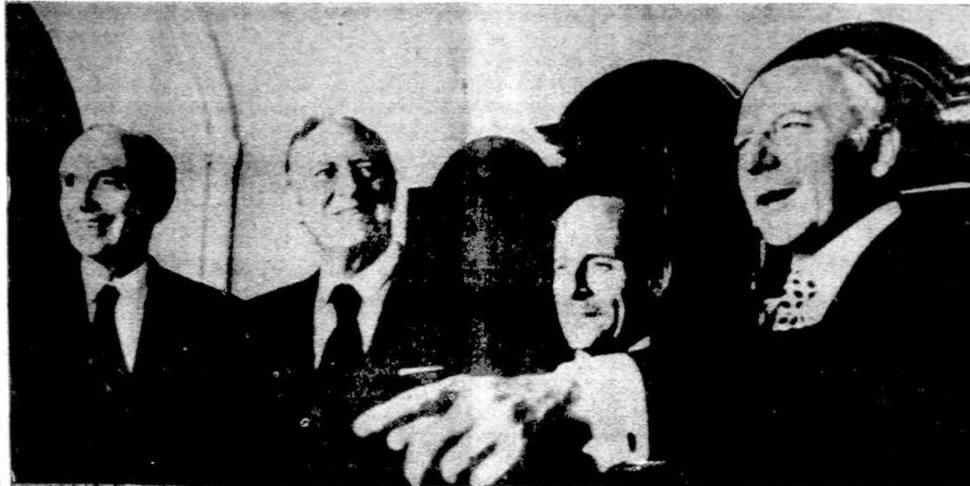
Kopenhagoje, Danijoje, buvo NATO šalių užsienio reikalų ministrų konferencija. Matome keturis didžiulius užsienio reikalų ministrus. Iš k.: Sir Alec Home (Britanija), William Rogers (JAV), Michael Jobert (Prancūzija) ir Walter Scheel (Vak. Vokietija)

Buvęs JAV ambasadorius Maskvoje Jacob Beam Brežneva laiko gudriu politiku, nakties darbo mėgėju. Sprendimus jis daro ryž-