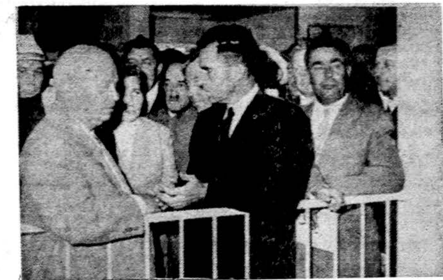
Tada Brežnevas buvo Chruščiovo šešėly (x). Nikita Chruščiovas su viceprezidentu Richard Nixonu garsiuose "virtuvės debatuose" Maskvoje 1959 metais

Birželio 20: šv. Silverijus, šv. Florentina, Genulis, Alva. Birželio 21: šv. Aloyzas, šv. Demetrija, Ramūnas, Vasarė. Saulė teka 5:15, leidžias 8:28. ORAS Daugiausia apsiniaukę, vėsiu, apie 70 laipsnių.