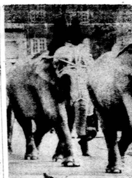
Mogens Glistrup, 47 m., vienos da- nų politinės partijos pirmininkas, rinkimines kampanijos metu, kad atkreiptų į save dėmesį, joja ant dramblių

Dolerio vertės pastovumas po karo ypač buvo palankus turto laikymui dolerio valiutoje. Daul- gelis užsieniečių, nepasitikedami savo po karo nuolatino krašto pi- nigais, savo turta stengėsi laikyti dolerio valiutoje. Dolerį du kar- tus nuvertinus ir jo vertei nuolat krįstant, žmonės ypač užsienyje nebenorė savo turto laikyti dolo- riuose. Dabar visi stengiasi likvi duoti laikomus dolerius ir pirkti pastovesnius valiūtų kaip vokiečių markes, šveicarių frankus ar auksą. Ypač nepasitikėjimą doleriu parodė arabų kraštai, kurie už parduodamą naftą buvo surinkę bilijonus Amerikos dolerių. Arabų kraštų kratydamas doleriais ga- li būti dalinai pagrįstas ir poli- tiškai sentimentaliais sumeti- mais dėl JAV valdžios Izraelio rėmimo. Tas užsienyje sukrautų dolerių likvidavimas ir sudaro beveik svarbiausią dolerio negala- vimo priežastį. Tarptautinėje pi-