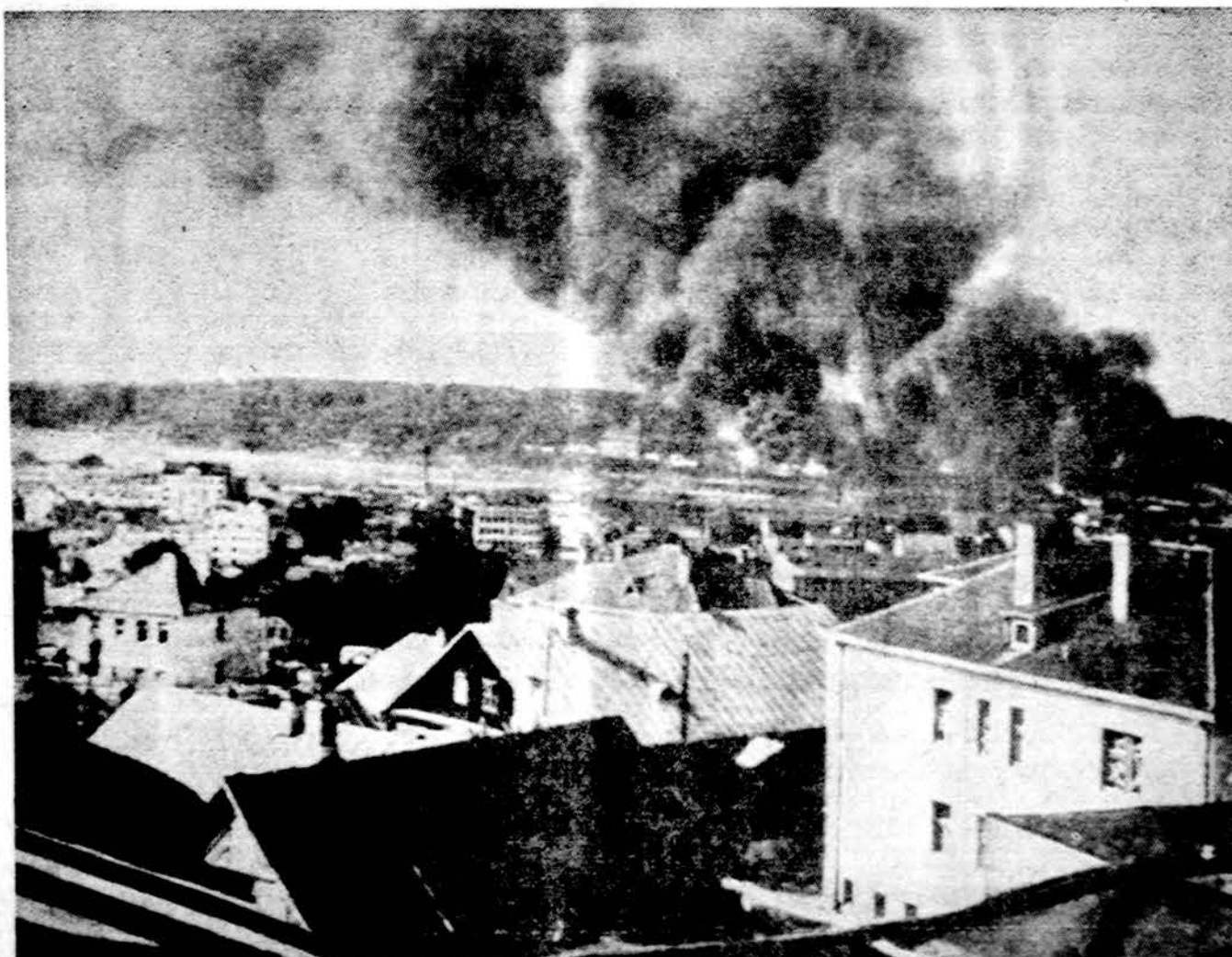
1941 birželio 23 sovietų kariuomenė bėgdama nuo artėjančių vokiečių pradėjo padeginti sandėlius. Dega Aleksotas, Kauzo priemiestis.

TORONTO. — Į Air Canada DC-8 pilant gazoliną, lėktuvas užsėdė ir susprogo, 8 mil. dol. nuostolių. Du darbininkai sunkiai apdegė.