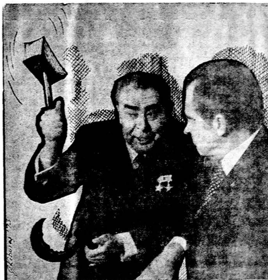
Brežnevas, atvykęs į Ameriką, moko prez. Nixoną, kaip reikia malšinti demonstrantus.

— Dail. Picasso paliko turto už 250 mil. dol.