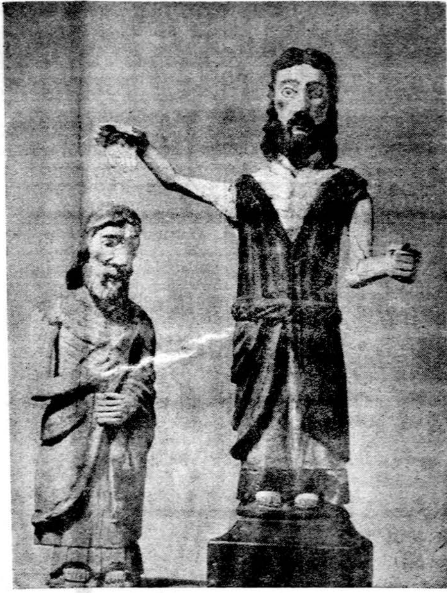
Šv. Jonas Krikštytojas. Nežinomo lietuvių liaudies menininko darbas. Ylakių vis., Mažeikių aps.