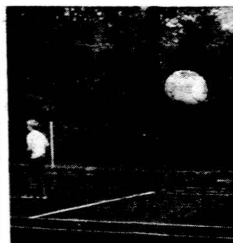
Sendraugių stovykloje praeitais metais Detroito studentai uoliai loškavo tinklinį su sendraugiais.

Iš Baltųjų Rūmų salės apie du šimtai dalyvių persikelia į valgo-