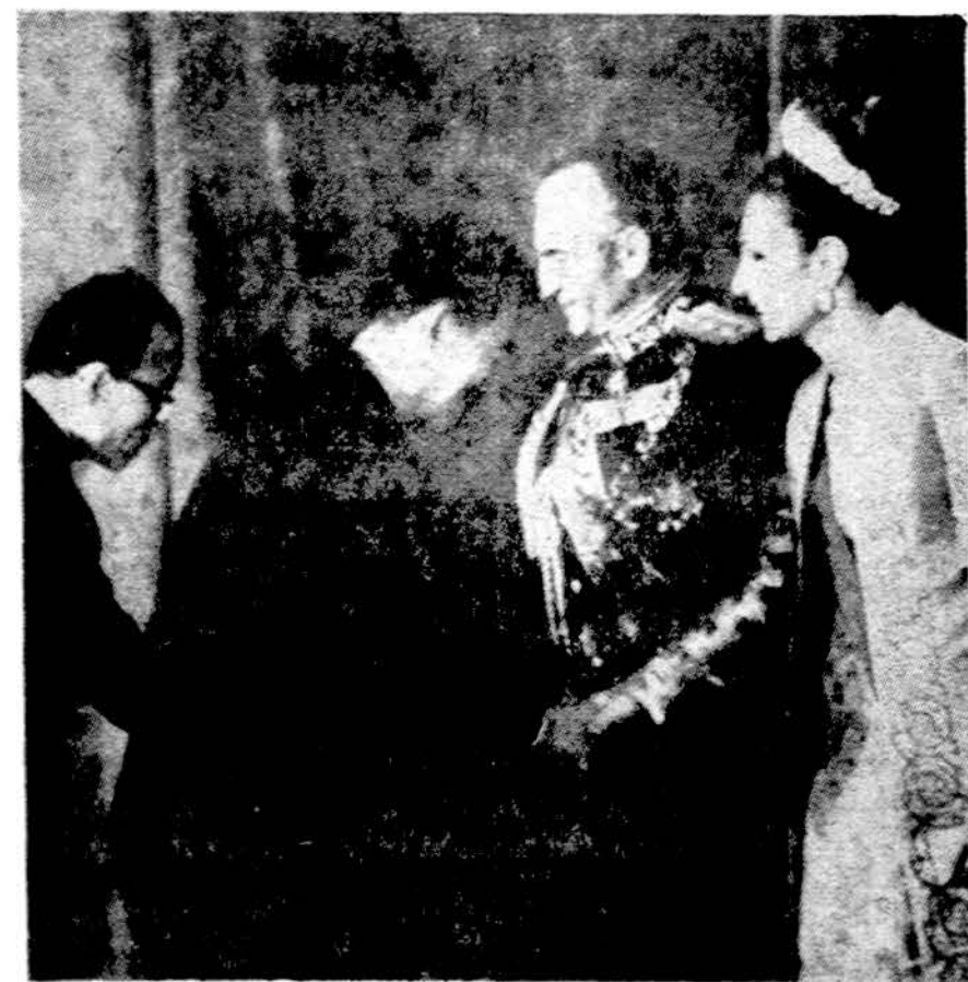
Irano šachas Reza Pahlevi ir jo žmona Farah vienu iškilmių metu sveikinasi su Kinijos diplomatais

Dalnai saulėta, galimas lietus su perkūnija, truputį vėsiu, apie 80 laipsnių.