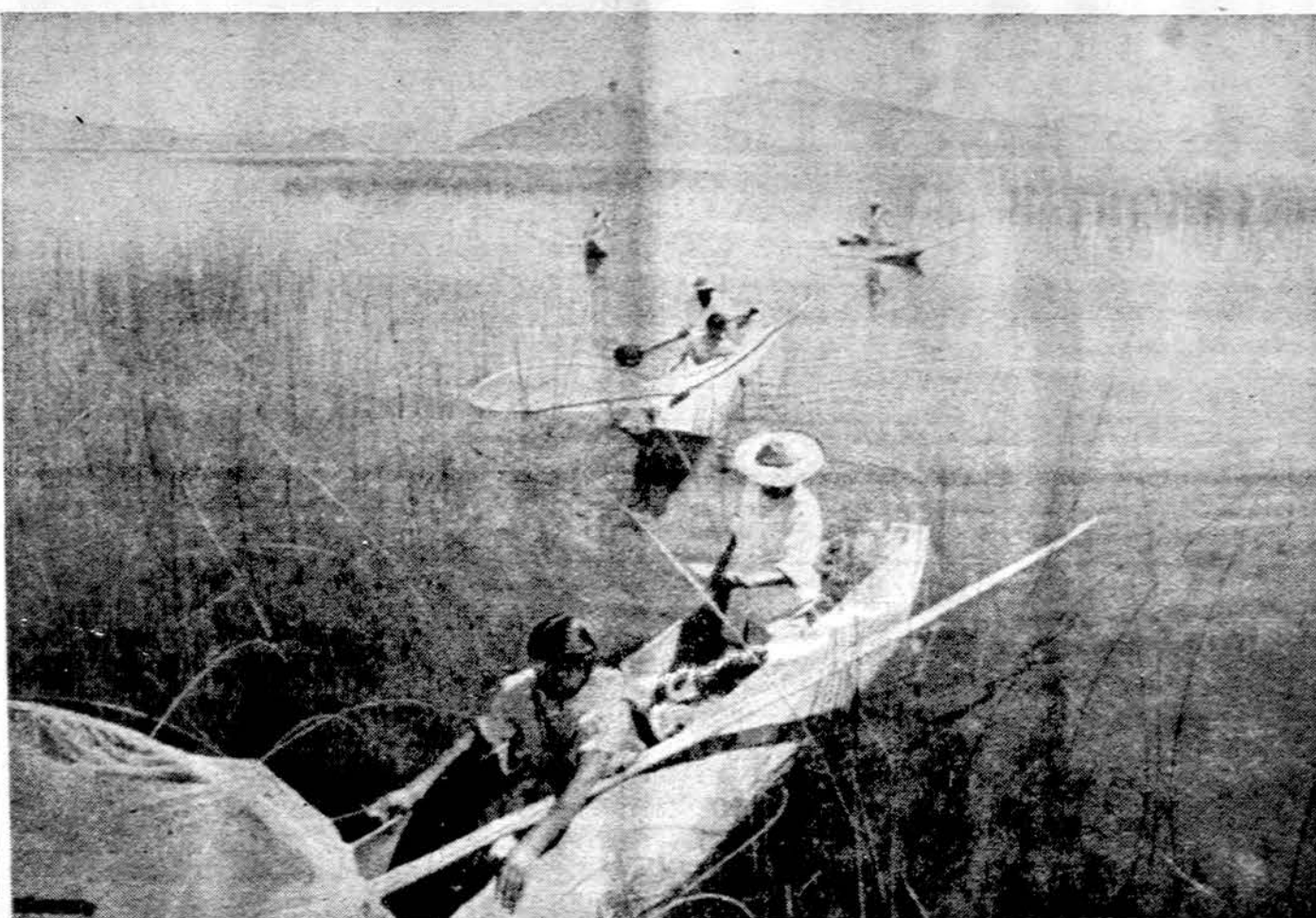
Meksika. Patzeuaro ežero žvejai

Bet kas būtų, jei silpnos, blogai organizuotos arabų valstybės aplink Persų įlanką pajustų grėsmę iš vidaus, jei prasidėtų partizaninis karas? Manoma, jog ne tik jos prašytų Irano pagalbos, bet ir pats Teheranas įsimaistytų, kad svetimos jėgos neišgalėtų. Šachas Newsweek (V. 13) duotame pakalbėjime sakė, kad pagalba bus suteikta visiems, kas tik prašys. Praktiškai jau taip ir yra: Omano sultonas Šabus jau šaukėsi pagalbos prieš sukilelius. Iranas pirmą kartą pasiektas 1,000 gerai ginkluotų vyrų. Partizanai apginklavo Pietų Jemenas, nors