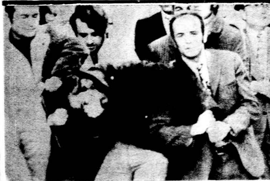
Graikių — nuolatinių neramumų šalis. Saugumo policija suimė ja de-monstruojančius studentus

— Paulius VI specialiu raštu pasveikino tėvų marijonų vie-nuolią, mininčią savo įkūrimo trijų šimtų metų sukaktį.