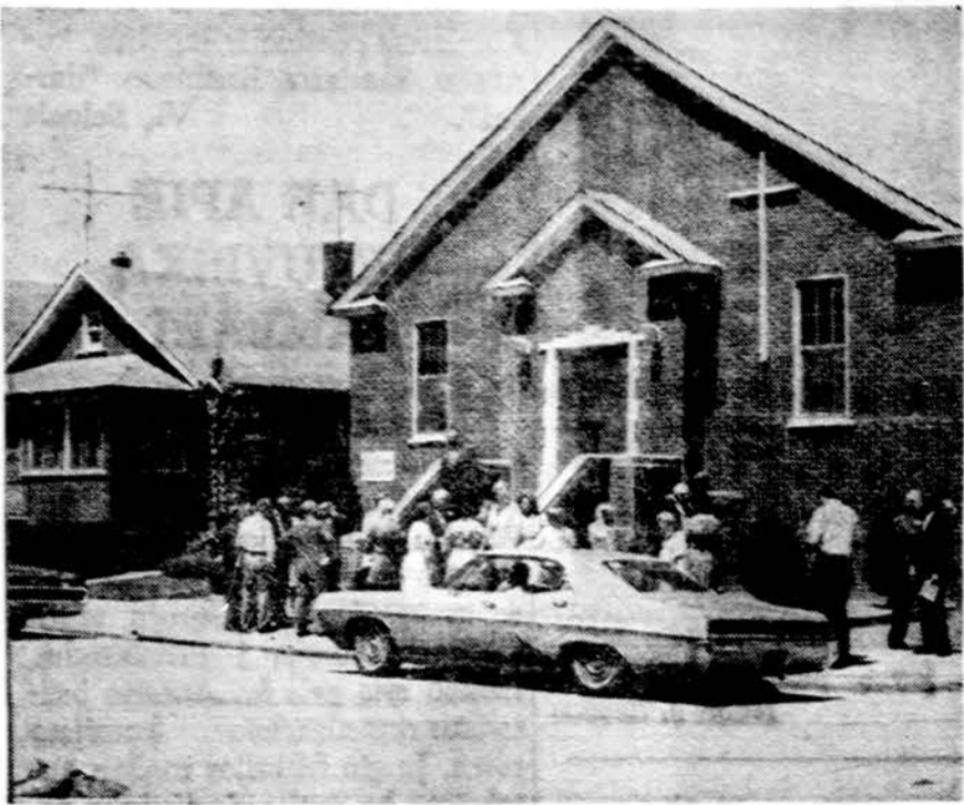
Sv. Petro lietuvių bažnyčia Detroito.