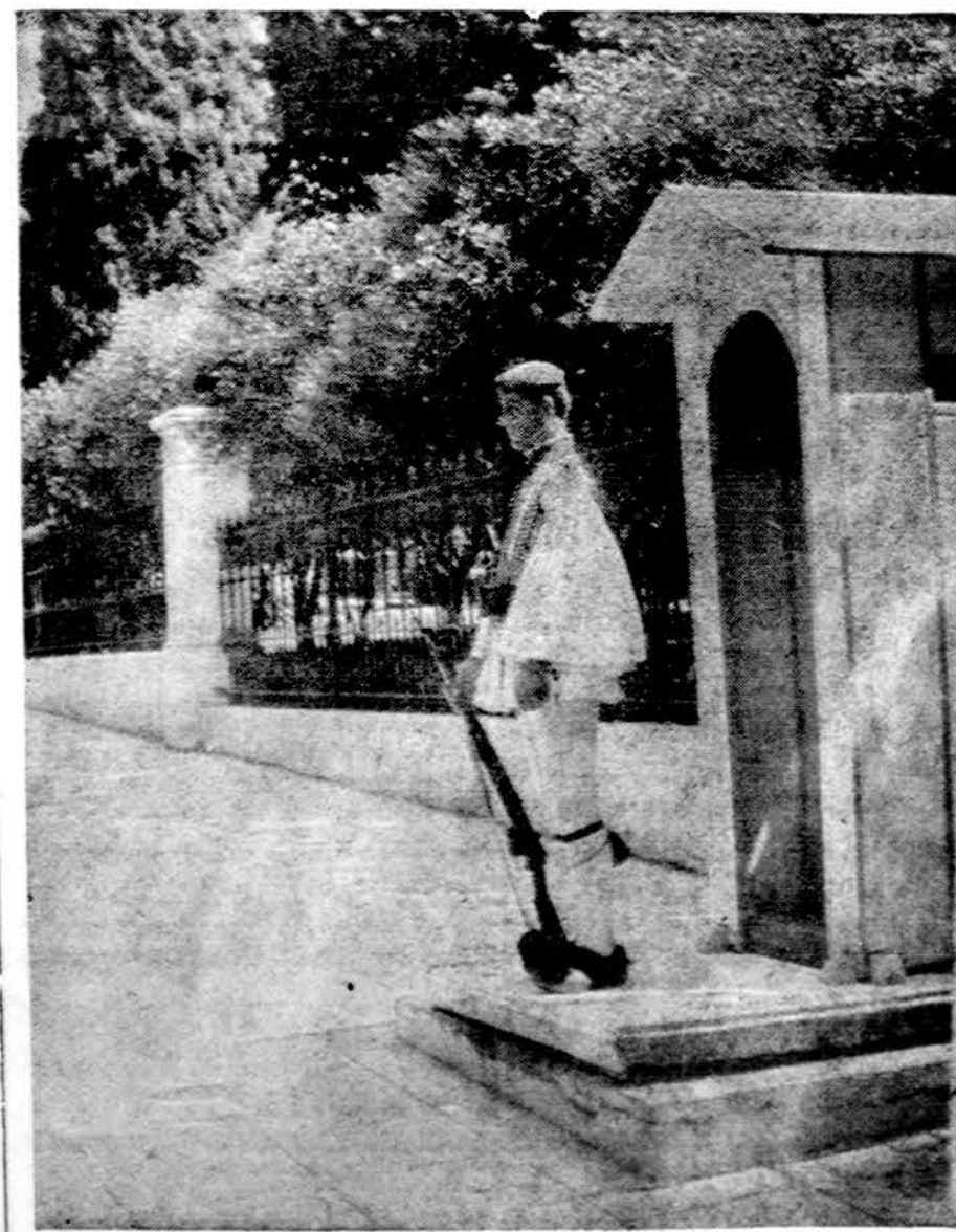
Karaliaus nėra, bet prie Graikijos karaliaus rūmų Atėnuose sargyba

BELFASTAS. — Šiandien 8. Airijoje vyksta rinkimai į vietos parlamentą pagal naują britų planą, kuriuo du kartus daugiau anglių nei airių daugiau neturėtų dominuoti, bet vieną trečdajį atstovų ir valdžios perduoti ir mažumai, airiams. Parlamente bus 74 atstovai. Dvi pagrindinės anglių — protestantų organizacijos tą britų planą atmetė jo paskelbimo dieną ir sakė, kad jų atstovai drauge su airiais nesėdės. Jie sieks, kad Airija liktų nepriklausoma valstybė ir nuo Britanijos, Britų planui pritaria tik socialdemokratai, darbiečiai, airiai katalikai. Kaip pavyks rinkimai, kaip bus sudaryta po to savivalda, dar sunku pasakyti.