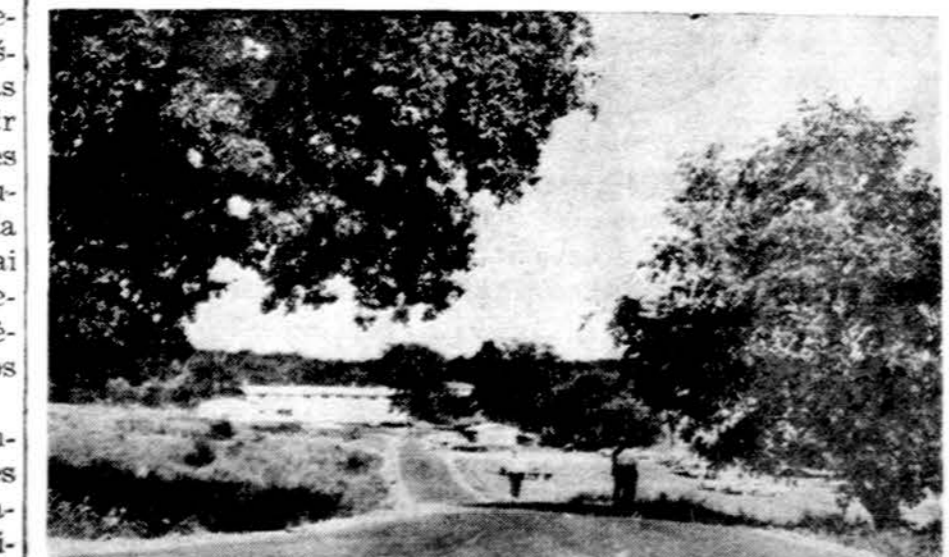
Asfaltuotas kelias, baltieji rūmai ir garažas nuo koplytstulpio į rytus žvelgiant