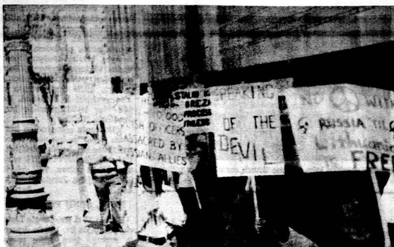
Lietuviai Detroito protestuoja prieš rusų kolonializmą diktatoriaus Brežnevo lankymosi metu.

Birželio tragiškųjų įvykių minėjimai šiuo metu nuslopunami triukšmo, sukulto Brežnevi atvykus į Ameriką. "Darbininko" (1973. 6. 15.) redakcinis straipsnis įžvalgiai primena susidariusią situaciją, kuri užslopina lietuvių tautos liūdnesias dienas. Bet lietuvių, gyvenančių šiose krašte, prisimena ir turi prisiminti jų reikšmę anuo metu ir dabar. "Su jų žuvimu ar išėjimu iš lagerių naikinimo eiga betgi nėra baigta. Lyg naujas naikinimo veiksmas yra užpuolko pastangos kurti tą "naują žmogų". Tokį žmogų, kuris niekintų laisvos Lietuvos laikus, garbintų pavergėjų ir tapę jo pakaliku. Tarnauja tam dabar Maskvos vykdomas ūkinis išnaudojimas, rusų infiltravimas, lietuvių kultūros keitimas rusiškajai. Jei per tiek metų "naujas žmogus" nesukurtas, tai ženklas, kad čia susidūrė ne tik matematiniai dydžiai: 200 milijonų užpuolikas ir 3 mil. užpuoltas; susidūrė čia ir