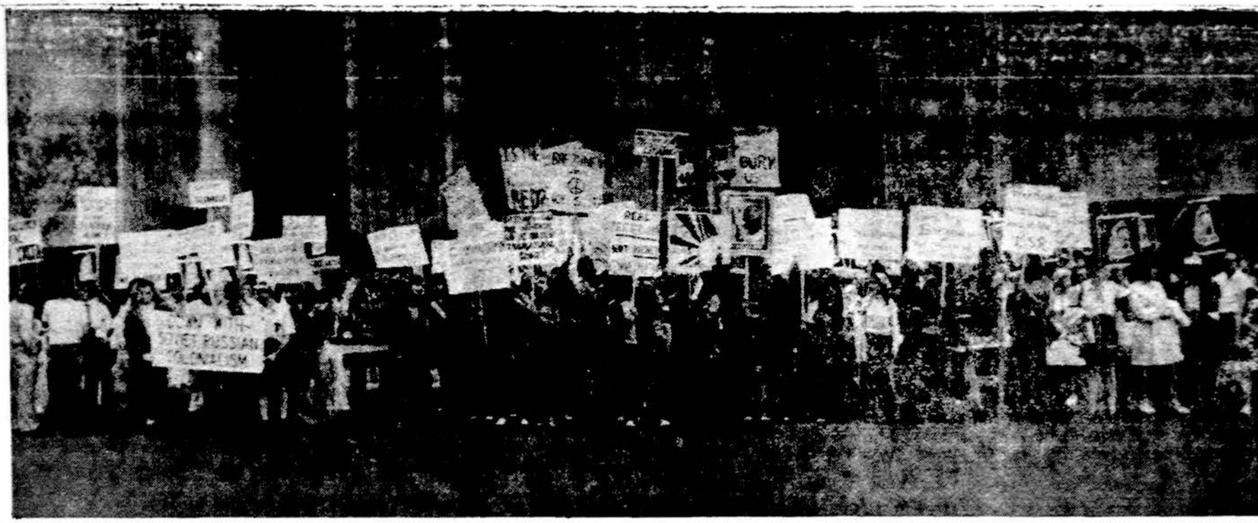
Lietuviai ir kitos tautybės protestuoja prieš rusų kolonializmą ir geno cidą pavergtose tautose. Demonstracijos įvyko praėjusį sekmadienį Detroito, ryšium su Brežnevo lankymosi Amerikoje.