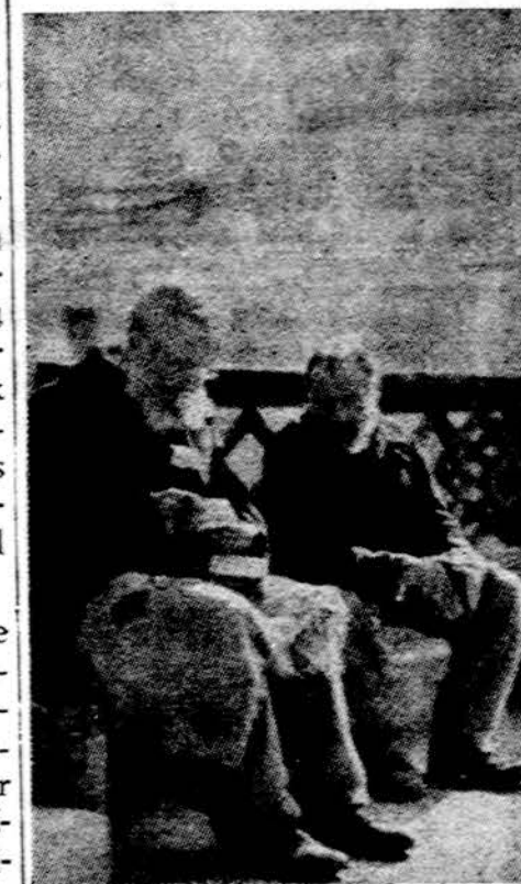
Vilniuje lenkų okupacijos laikais. Du lenkai senukai prie katedros durų su maldaknygėmis. (1936 metų nuotrauka)