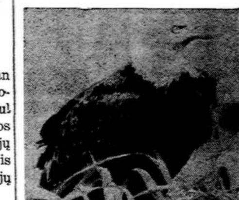
Amerikos simbolis erelis (Bald eagle)

NEAPOLIS. — Italų archeologai atrado dar vieno miesto, Oplenti, griuvėsius. Miestą 79 metais, kartu su Pompėja ir Herculaneum, užliejo Vesuvius. Buvo manoma, kad tas miestas yra visiškai sudegęs, o dabar atkasta viena 40 kambarių vila su gerai išsilaikiusiomis freskomis.