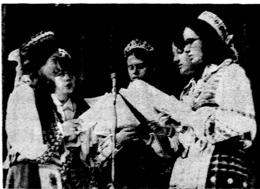
Kr. Donelaičio mokyklos mokslo metų užbaigimo iškilnėse programa atlieka aukštesniąją mokyklą baigiančios absolventės.

Paskutiniaisiais metais Lenkijoje žymiai padidėjo dvasinių pašaukimų skaičius į kunigystę. 1972 metais buvo pašventinti 604 nauji kunigai, tai yra 130 daugiau negu 1971 metais. Taip pat ir šiais metais laukiama žymiai daugiau naujų kunigų, nes Lenkijos kunigų seminarijose kunigystei rengiasi 4.604 seminaristai. Lietuvoje šiemet buvo įšventinti tik 6 nauji kunigai iš 30 seminaristų, kuriem leidžiama studijuoti teologijos mokslus.