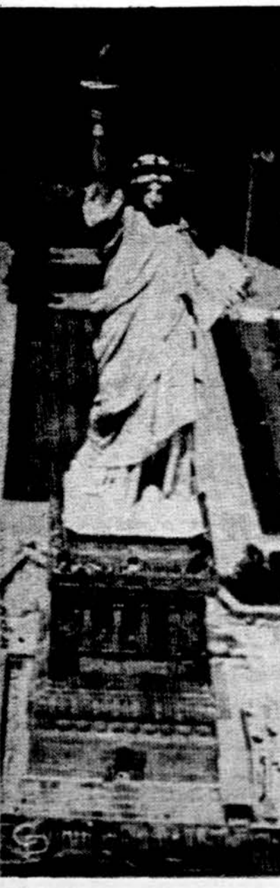
"Ateikite visi, kurie esate pavargę ir persekiojami".

Kainų užsaldymas tęsis tol, kol reikės, nežūrint kai kurių sluoksnių ir labai pikty reagavimų. Naujoji ketvirtoji kontrolės fazė bus griežtesnė nei dabartinė trečioji. Ji bus realesnė ir geriau veiks. Kad dabar maisto kainos aukštos ir nežada greit kristi, svarbiausia, kad pasaulis daugiau perka iš Amerikos, didesnis pareikalavimas.