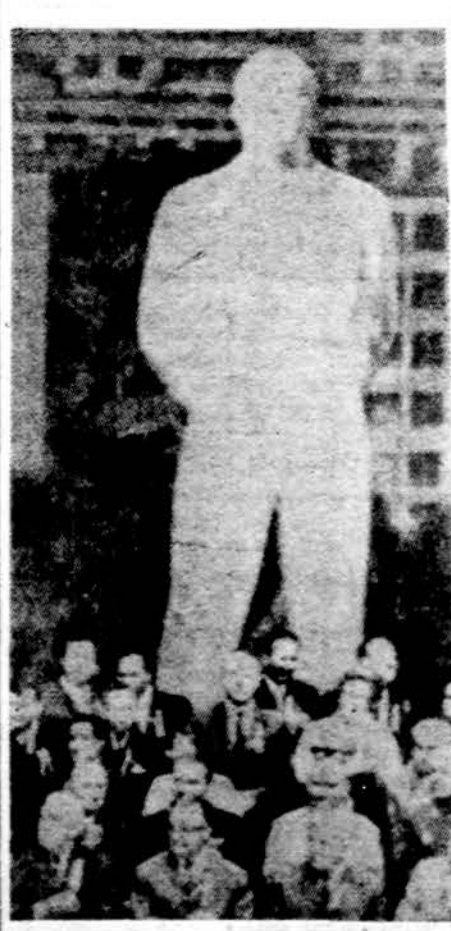
Gramozdiška Lenino statula, kurios šešelyje Vilniuje vyko miesto 650 metų sukakties minėjimas

Poetas A. Jonynas Vilniui skirtame eilėrašty vadina jį "komunizmo statytojų miestu. Toliau buvo iškelti tokie "istoriniai" faktai: daugiau kaip prieš 100 metų Vilniuje įvyko pirmasis darbininkų streikas; 1892 m. kažkoks marksistų ratelis Vilniuje suruošė gegužinę; mieste buvusi platinama "Iskra" ir kita komunistinė literatūra. Prisiminti 1905 m. revoliucijos įvykiai, sustota prie F. Deržinskio, V. Kapsuko ir Z. Angariečio veiklos, pagaliau prie Vilniaus "išvadavimo", kurį atlikusi rusų raudonoji armija. Svarbiausias Vilniaus 650 metų gyvenimo įvykis buvęs šis: 1895m. Vilniuje pravažiudamas buvęs sostinės Leninas. Iškačiuotos Lenino raštų vietos, kada ir kur jis paminėjo Vilniaus vardą. (bk)