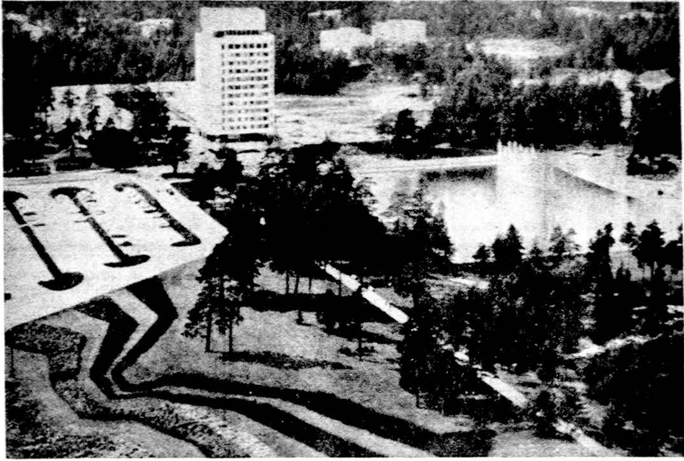
Tapiola, Modernus pažangios ir narsios Suomijos kampelis. Suomija šiuo metu pasaulio dėmesio centre, čia prasidėjo Europos Saugumo ir bendradarbiavimo 35 kraštų konferencija.

VARSUVA. — Varšuvos arkivyskupas kard. Wyszynski, kalbėdamas katalikams mokytojams, pažymėjo, joks niekas neturi teisės suvaržyti tėvus auklėti vaikus pagal savo sąžinę.