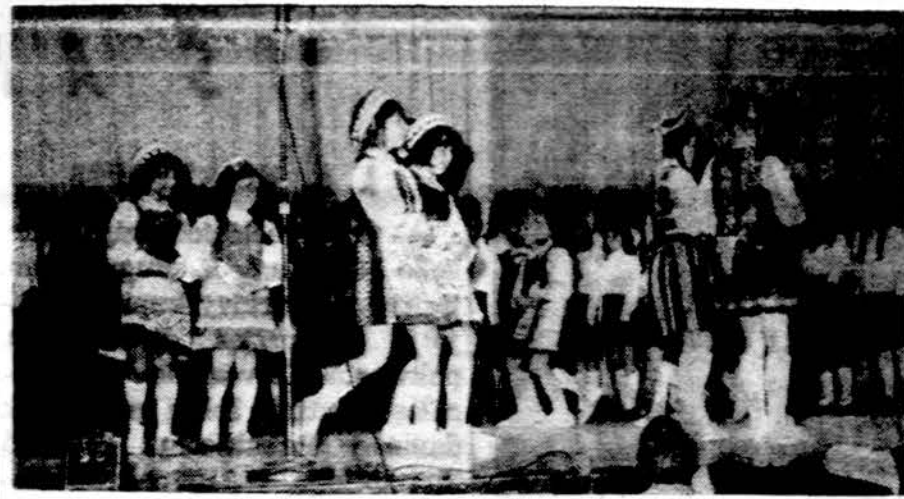
Toronto mažieji šoka ir dainuoja

Atsiskyręs nuo turistų grupės, nužygiuoju sostinės gatvėmis. Rodos, pusė miesto gyventojų čia subėgę. Nelengva vieto-