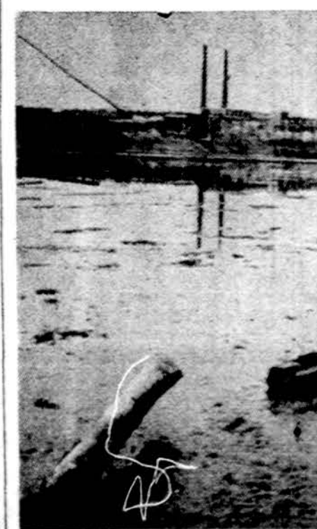
Šiaurės ir Baltijos jūros esančios labiausiai užterštos iš visų jūrų. Daugiausia dėl to, pasirodo, kalti švedai. Nuotraukoj šiaurės jūros švedų pakrantė prie Sundvall, švedijoje.

BEIRUTAS. — Laikraštis „L'Orient-Le Jour“ rašo, kad suduzsiam sovietų lėktuve Amman, Jordanijoje, buvo rastos slaptos informacijos, siųstos sovietams. Informacijos surinktos neseniai emigravusių iš Rusijos žydų agentų. Amman Maskva oro linija informacijom ir buvo naudojama.