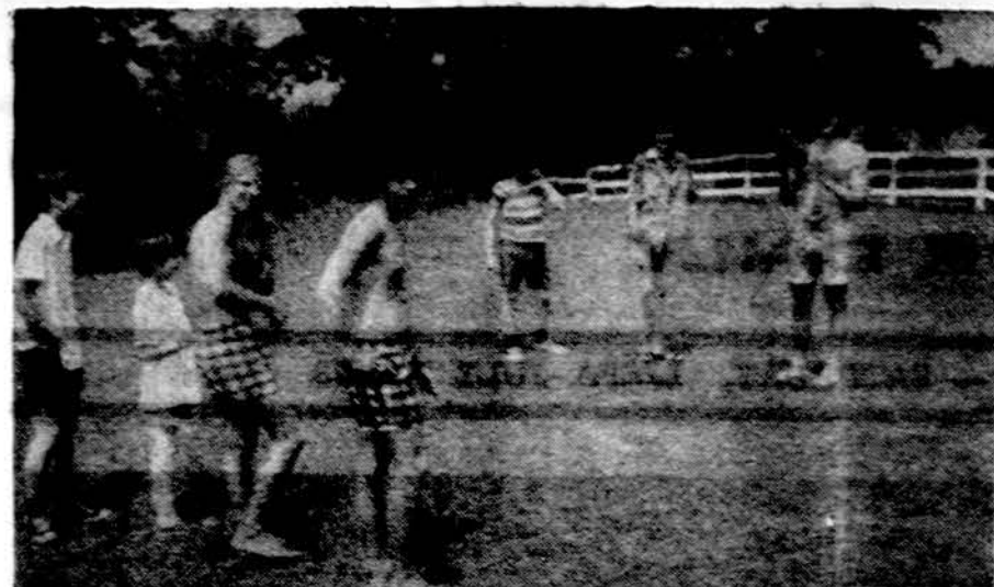
Chicago moksleivių ateitininkų Lipniūno kuopa iškylauja birželio 12, Lieponių sodyboje.