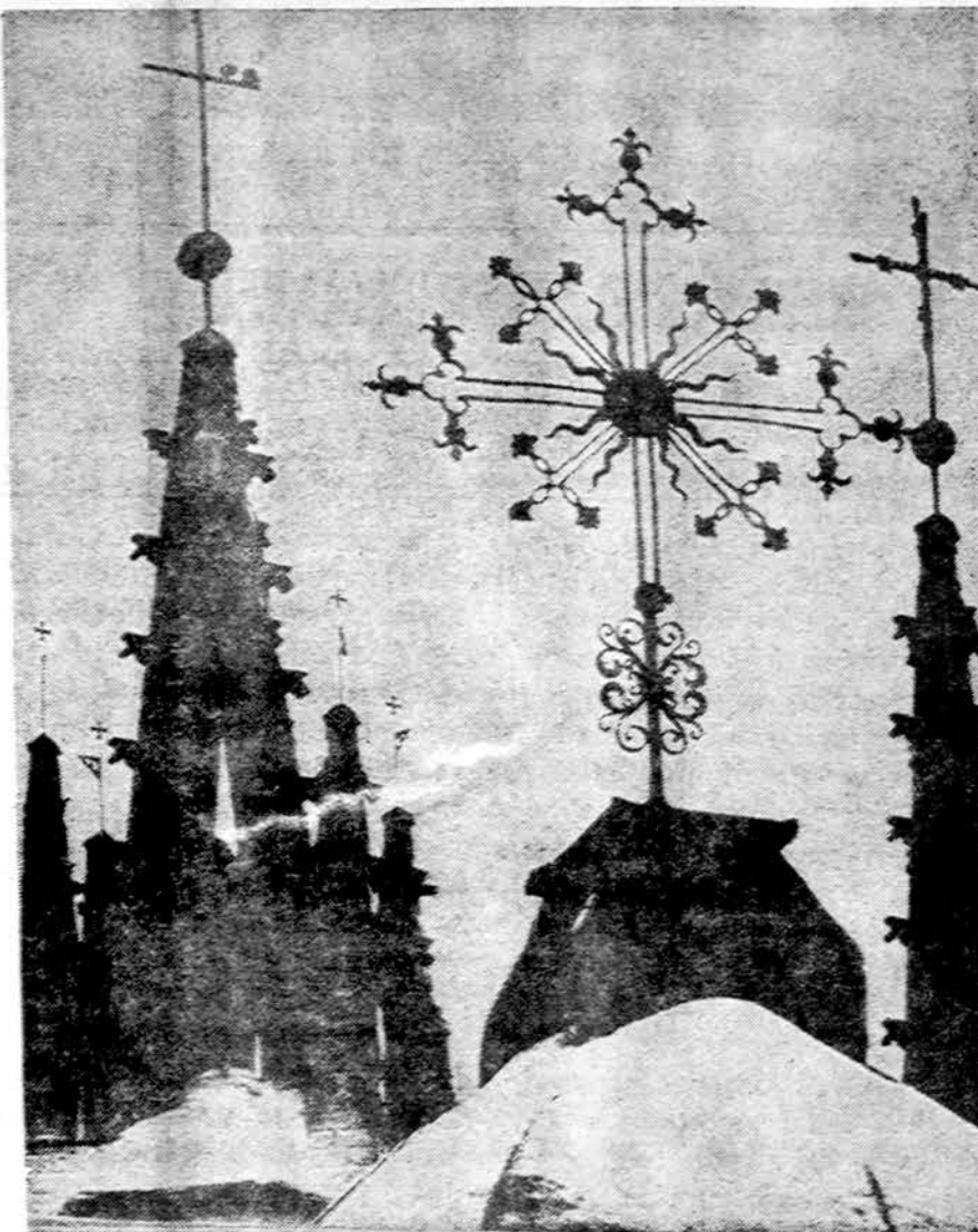
Vilniui — sostinei 650 metų

Senamiesčio ansamblis, vienas gražiausių miesto reginių