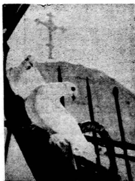
Dieviškosios tautos simbolis

Accra. — Ghanos krašte Afrikoje, iš bendro aštuonių milijonų gyventojų skaičiaus, daugiau kaip milijonas yra katalikai. Juos dvasiniai aptarnauja 360 kunigų, kurių 125 yra vietinės kilmės. Sielovados darbą dirba taip pat 400 sergų ir apie šimtą brolių vienuolių, kurie ypatingai pasižymi auklėjimo srityje. Ghanoje veikia 190 katalikų pradinė mokyklų su 25,000 moksleivių ir 27 gimnazijos, kuriose mokosi apie 10,000 jaunimo.