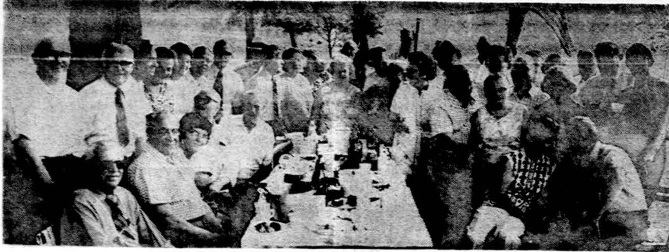
Buvę nepriklausomos Lietuvos paštininkai su svečiais gegužinėje Marquette Parke Chicagoj liepos 1 d.

× Lietuvos Fondas. Našlė, gyv. Europoje, pavadėdė prašė neskelbti, įrašė į LF narių eiles savo mirusį vyrą a. a. X. su $100 įnašu. LF adresas: 2422 W. Marquette Rd., Chicago, Ill. 60629, tel. 312-925-6897 (pr.)