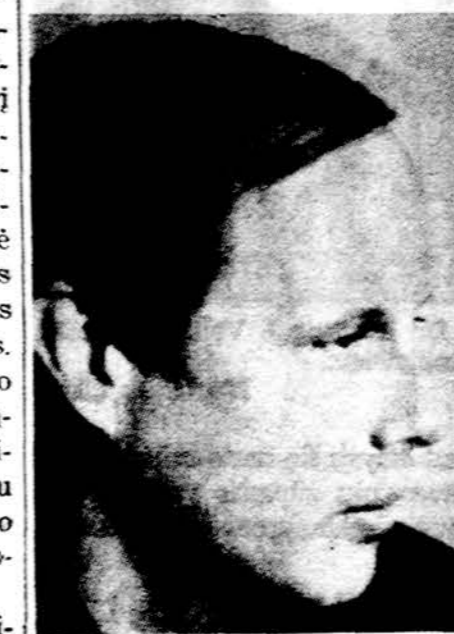
John Wesley Dean III

Visai suprantama ir natūralu, kad Dean savo liudijimuose sten- giasi savo dvasinį vaizdą kiek tik galima padailinti. Dean ne- ginėja, kad jis nusikalto, bet visur stengiasi daryti įspūdį, kad nusikalto labai nenoromis, kitų ar aplinkybių patrauktas ar net verčiamas. Pradedamas savo liudijimą senato specialus komiteto sesijoje Dean "pasakė, jog jis tikisi, kad, visiems fak- tam išaiškėjus, tauta atleisianti Nixonui. Nelabai šmintinga ir neskoninga Deano pastaba, pa- daryta norint pakelti savo liudi- jimų patikimumą. Už ką gi tau- ta atleis Nixonui? I tai atsako Charles W. Colson, kuris buvo trejus su puse metų Nixono specialus patarėjas ir tik šis tuo metu pradėjo iš tų pareigų pa- pasitraukęs. Colson, pasirodęs