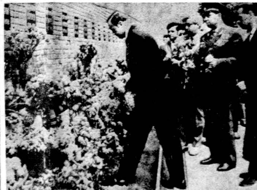
Ir astronautai įtraukiami į Amerikos - Sovietų bendradarbiavimą. Pirmasis žmogus, kuris Mėnulyje iškėlė koją, Armstrong, deda vainiką prie keturių žuvusių sovietų kosmonautų, įmirytų Kremliaus sienoje. Dešinėje sovietų kosmonautai Gararinas ir Komarovas.

Liepos 12: šv. Jonas Gv., šv. Marijona, Margiris, Skaidra. Liepos 13: šv. Henrikas, šv. Mildreda, Vytenis, Austinė. Saulė teka 5:26, reidžias 8:26. ORAS Saulėta, kiek šilčiau, virš 80 laipsnių.