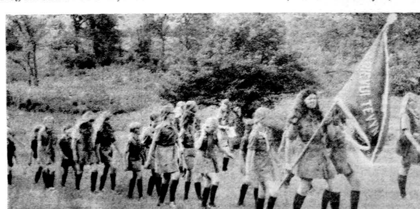
Iš Detroito skautų stovyklos Dainavoje. Jaunesniųjų skautų draugovė žygiuoja į stovyklą užbaigiamąją sveiką.

DRAGAS 4545 W. 63rd Street Chicago, Ill, 60629