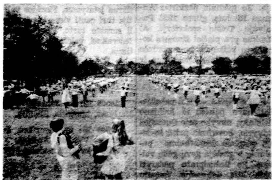
Kr. Donelaičio pradžios mokyklos mokiniai pavasario šventėje atlieka pratimus su vėliavėmis.

Kveglinburgo metraštis mini Lietuvą dar 1009 metais. To pat amžiaus gale mini lietuvių giminės ir rusiškosios kronikos, o nuo XIII amžiaus — ir vokiškosios. Beveik visi senieji kronikininkai lyg sutartinai pabrėžia mūsų prosenių taikingumą ir žmoriškumą. Girdi, jie nemėgdavę klajoti, nemėgdavę ieškoti sau gerbūvio plėšriaisiais keliais. Jie nepaprastai gerbė tą, kas svestima, didelis buvo jų darbštumas, pasitikėjimas savomis jėgomis. Be to, skaištūs papročiai, užkirtę kelią aliai vienam žiaurumui — žmoniškumo suniekimui. MŠKns