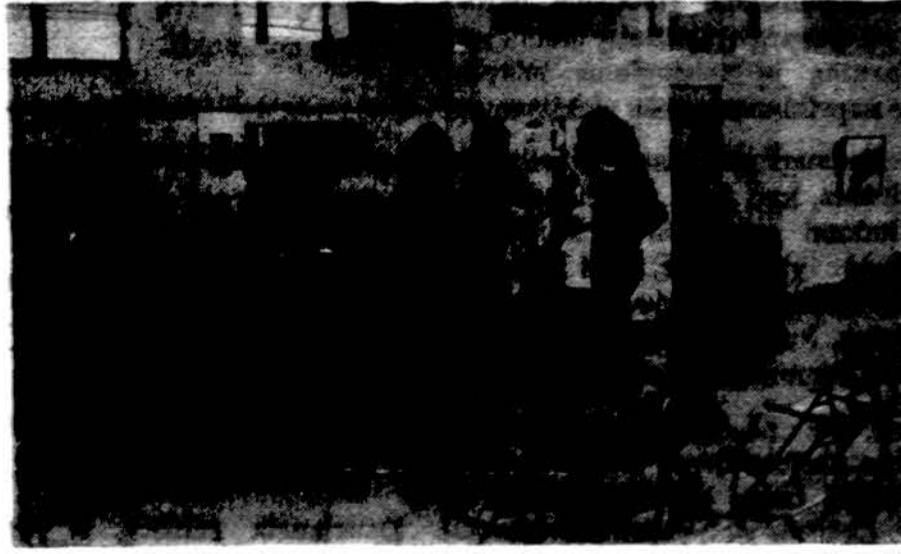
Dalis lankytojų jaunimo meno parodoje Chicagoje, gegužės 18-20 d. Parodą suruošė SAS valdybos nariai.