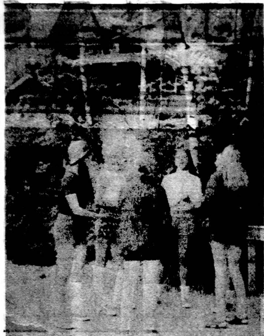
Mergaitės dainuoja praeitos vasaros moksleivių ateitininkų stovykloje Neringoje.

dvi šiuo metu galutinai dar nenusistatytos. Vakaraš bus pokalbiai, dainos, šokiai, jaunųjų talentų pasirodymas ir pan.