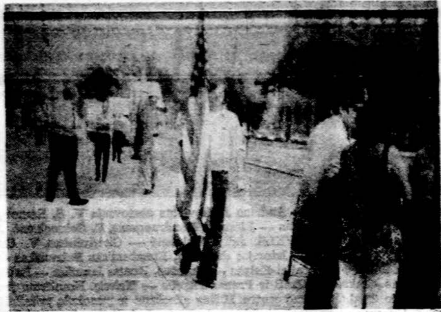
Vaizdas iš demonstracijų Washingtono.

Kai tekančios saulės spinduliai pakėlė iš miego blakstienas, keliauninkai vėl sujudo, sukručto. Moteriškoji lytis pirmoji ėmė nuo kelionės dulkių valytis ir tvarkyti savo tualetus. Apie 9 val. ryto pasiekėme Washingtono priemiesčius. Telefonu buvo susisiektas su Lietuvių res-