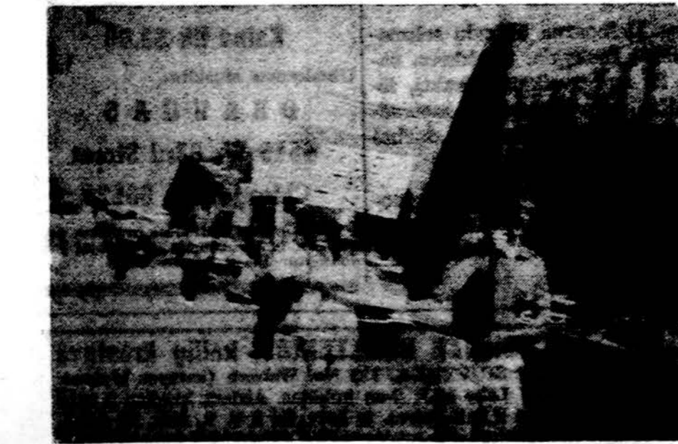
Vaizdas iš demonstracijų Washingtono.

DRAUGAS 4545 W. 63rd Street Chicago, Ill., 60629