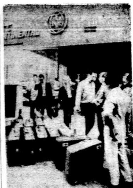
Turizmas Japonijoje plečiasi. Perei-tais metais užsienį aplankė 1.5 mil. japonų. Čia matome japonų turistų grupę Frankfurtu aerodrome. Vak. Vokietijoje

Kalbant šia tema lietuviams, vėl mintis savaime pasiekia Lie-tuvą. Neseniai skaitėm jaudinan-čius vaizdus, kaip kelis ar kelio-lik kilometrų nuo Šiluvos polici-ja, apstojusi kelius, gaudo senus ir jaunuolius, vykstančius į Šiluvą atima iš jų susisiekimo priemones