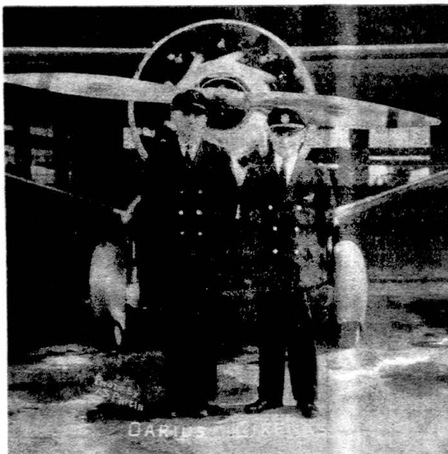
Siandien sueina lygiai 40 metų nuo Atlanto nugalėtojų Stepo Dariaus ir Stasio Girėno žuvimo. Jų drąsa, gyvybės auka ir Lietuvos vardo išgarsinimas niekadados nebus užmiršti. Nuotraukoj abu lakūnai ir jų vienmatoris lėktuvas "Lituanica".