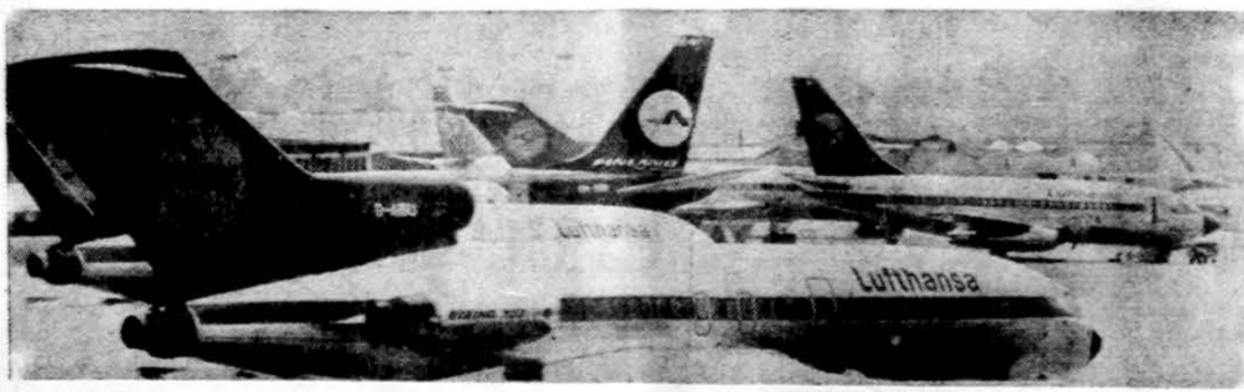
Vakary Vokietijoje susitikavo lėktuvų mechanikai ir patarnaujantis personalas. Streikas pažeidė vidaus ir tarptautinį lėktuvų susisiekimą

PHNOM PENH. — Situacija Kambodijoje laikoma ypatingai pavojinga. Vyriausybės daliniai mėgina atremti komunistų infiltruotus būrius jau šlapus gyvenbos linijos. Amerikos lėktuvų bombardavimai smarkiai sustiprinti. Kambodijos prezidentas Lon Nol greit atvyks į Ameriką. Oficialiai sakoma, jog atvyks pasigdyti, bet pradedama spekuliuoti, kad jau jis į savo kraštą negrįš. Jam nesant, kiti jo įgaliotiniai galės lengviau susitarti su komunistais ir gal baigs karą kompromisu.