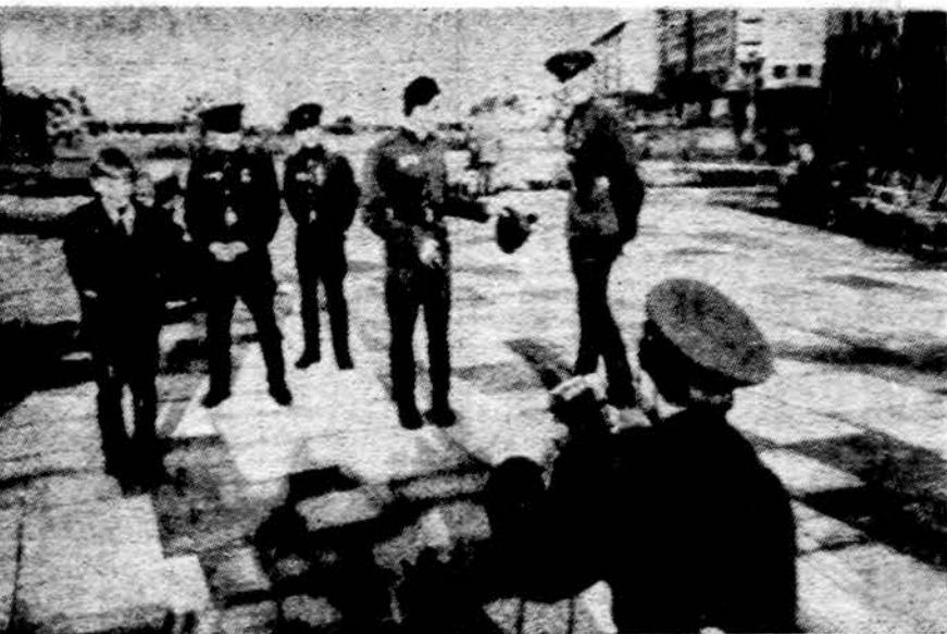
Sovietų kareiviai, su medaliais, Rytų Berlyno gatvėse

Daugiausia saulėta, kiek šilčiau, temperatūra apie 80 l.