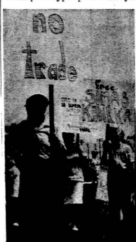
Iš demonstracijų, įvykusių liepos 11 d. St. Petersburg, Fla.