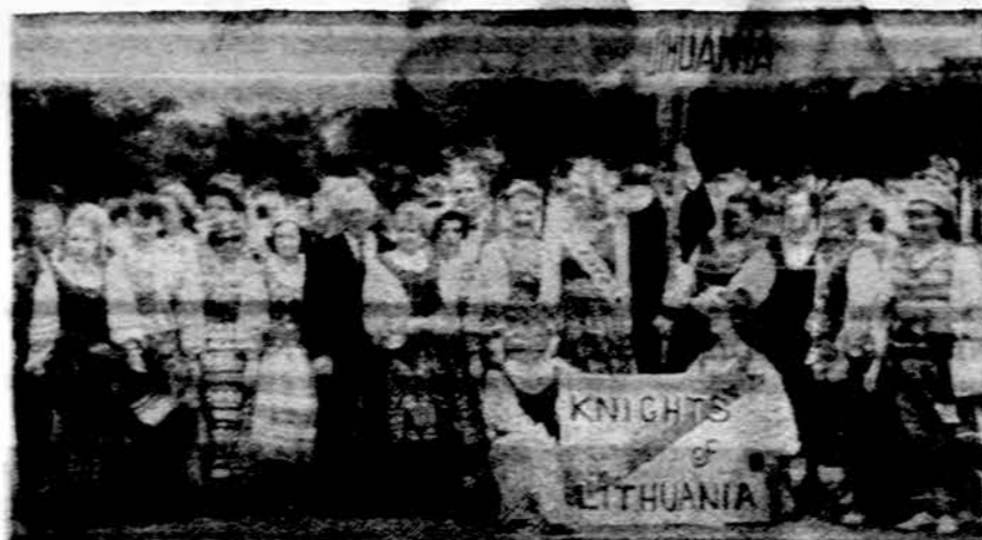
Vyčiai pavergtųjų tautų parade

Buvo ir kugelio varžybos. Pirmą vietą už skaniausių kugelių