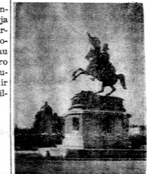
Karolio paminklas Vienoje, Austrijoje

Kaip jau dabar rašėm, tų dviejų stočių išlaikymui Senatas pinigų paskyrė, ir ne vieniems metams, kaip buvo pernai, bet dvejiems. Už stočių išlaikymą daugiausia ir kovojo sen. Percy ir sen. Humphrey.