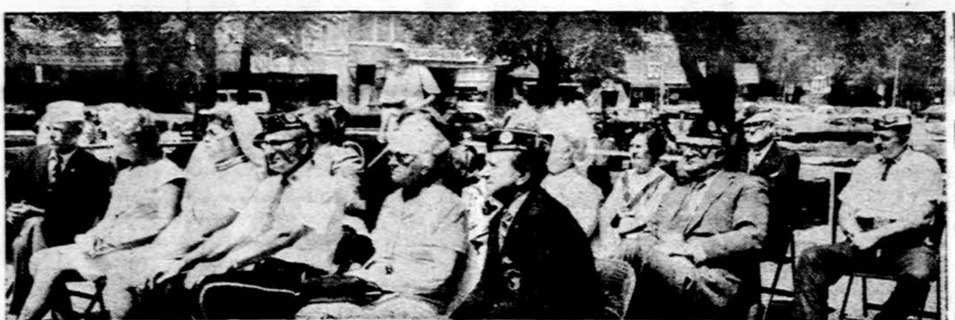
Garbės svečiai estradoje stebi Darius Girėno sukakties minėjimą Marquette Parke. Platesnis aprašymas buvo "Drauge" liepos 17 d.

× Lietuvių Fondas. Kas lietuviškai galvoja — į LF stoji. Tai šventa kiekvieno tautiniai sąmoningo lietuvių pareiga. LF adresas: 2422 W. Marquette Rd., Chicago, IL. 60629, tel. 925-9997. (pr.)