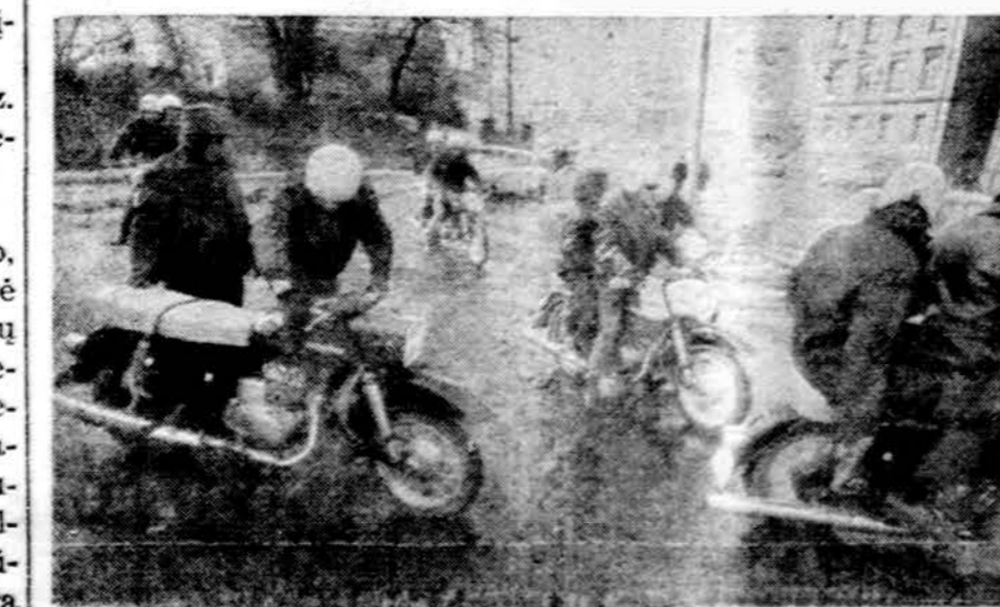
Leipigo, Rytų Vokietijoje, jaunieji motociklistai

PEKINAS. — Mao į senatvę pradeda praręgti ir pavedė Cu En-lajui pranešti, kad kai kuriuos kinečiai perdaug konservatyvūs ir priešingi kontaktui su užsieniu. Jis taip pat atsiprašė, kad kultūrinės revoliucijos metais nemaža kinečių nukentėjo ar net išbėgo iš krašto. Prašė grįžti ir kurti naują, geresnę Kiniją.