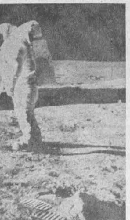
1969 liepos 20. Svarbiausias įvykis nuo Kristaus gimimo. Neil Armstrong ir Amerikos vėliava Mėnuly

LONDONAS. — Britanija pripažino šiaurės Vietnamą, bet jos santykiai su Pietų Vietnamu nepasikeis. Dar daugiau: Saigono vyriausybė bus ir toliau pripažįstama kaip vienintelė, teisėta Pietų Vietnamo vyriausybė, Vietkongo nepripažins.