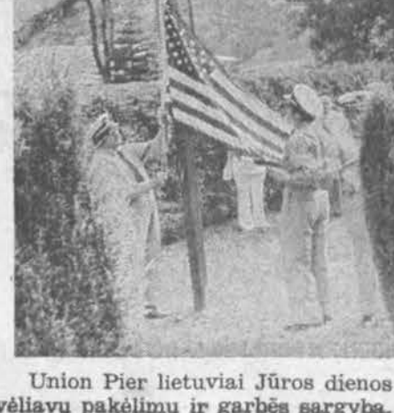
Union Pier lietuviai Jūros dienos iškilmes pradeda JAV ir Lietuvos vėliavų pakėlimu ir garbės sargyba.