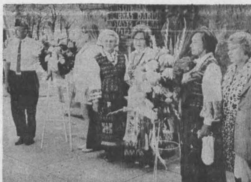
Iškilmės prie Dariaus Girėno paminklo Chicagoje, minint 40 m. nuo perskridimo per Atlantą ir tragiško žuvimo sukaktį.

× Lietuvių Tauragės Klubo valdyba prašo savo narius dalyvauti Pavergtųjų tautų Eisenoje liepos 21 d., šeštadienį, 12 val. Lietuviai pradeda rinktis 11:30 val., Wells ir Wacker gatvių rytiniame kampe. Eisenoje lietuviai turės 16 nr.