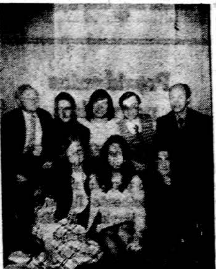
Washingtono, D. C. studentų ateitininkų draugovės kandidatai, išlaikę egzaminus, ir egzaminų komisija