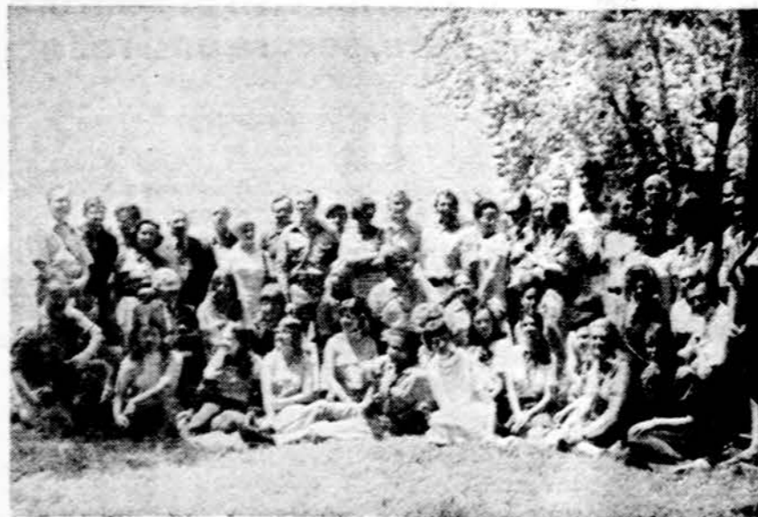
Dalis Akademinių skautų sąjūdžio suvažiavimo dalyvių Christiana Lodge, Mich.