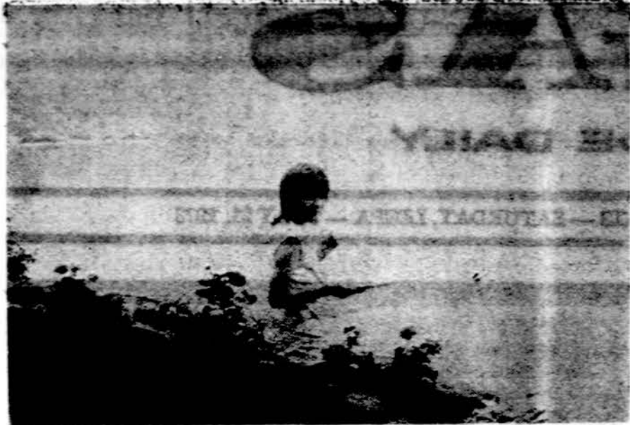
Jaunutė stiprinasi prieš darbo posėdį Philadelphia ateitininkų metinėje šventėje

Posėdis baigtas Tautos Himnu. Po posėdžio buvo pasikalbėta, pasivašinta ir tuo užbaigta dar viena graži ateitininkų šventė. Kor.