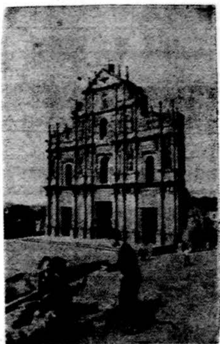
Macau, Portugalijos kolonijos Kinijos žemėje, šv. Pauliaus bažnyčios fasadas. Bažnyčia statyta 1602, sugriauta 1835

VATIKANAS. — Paulius VI priėmė apie penkis šimtus seserų vienuolių, dalyvavusių Romoje įvykusioje seserų kongregacijų vadovių generalinėje asamblėjoje. Šia proga pasakytoje kalboje Paulius VI ypatingai išskėlė seserų vienuolių misijos svarbą. Bažnyčiai ir šiuolaikiniam pasauliui. "Pačių savo vienuolinių gyvenimu ir jo rėmuose vykdoma sakota veikla jų paliudijate pasauliui, jog tikrosios, laiko tėkmėje neišėstančios vertybės yra dvasinės vertybės. Jūs esate pašauktos geriau pažinti pasaulio kančias ir negeroves ir kartu padėti jas pašalinti. Būkite kelrodžių pagalbos reikalingiems žmonėms. Dirbdamos jaunimo ir darbininkų tarpe, slaugydamos ligonius ir senelius, padėkite jiems teisingą gyvenimo kryptį. Paliudykite jiems, kad Evangelija yra gyva ir kad Dievo karalystė yra mūsų tarpe", — pažymėjo popiežius.