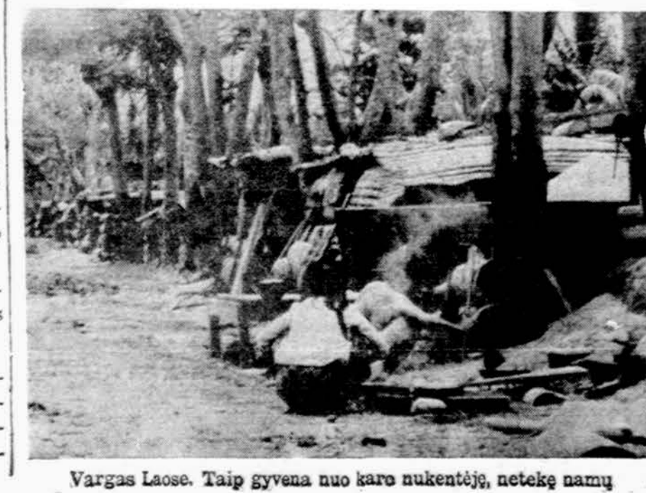
Vargas Laose. Taip gyvena nuo karo nukentėję, netekę namų

PHOENIX. — Arizonos gubernatorius Jack Williams paskelbė, jog paskutinį rugsėjo sekmdienį bus "senelių diena".