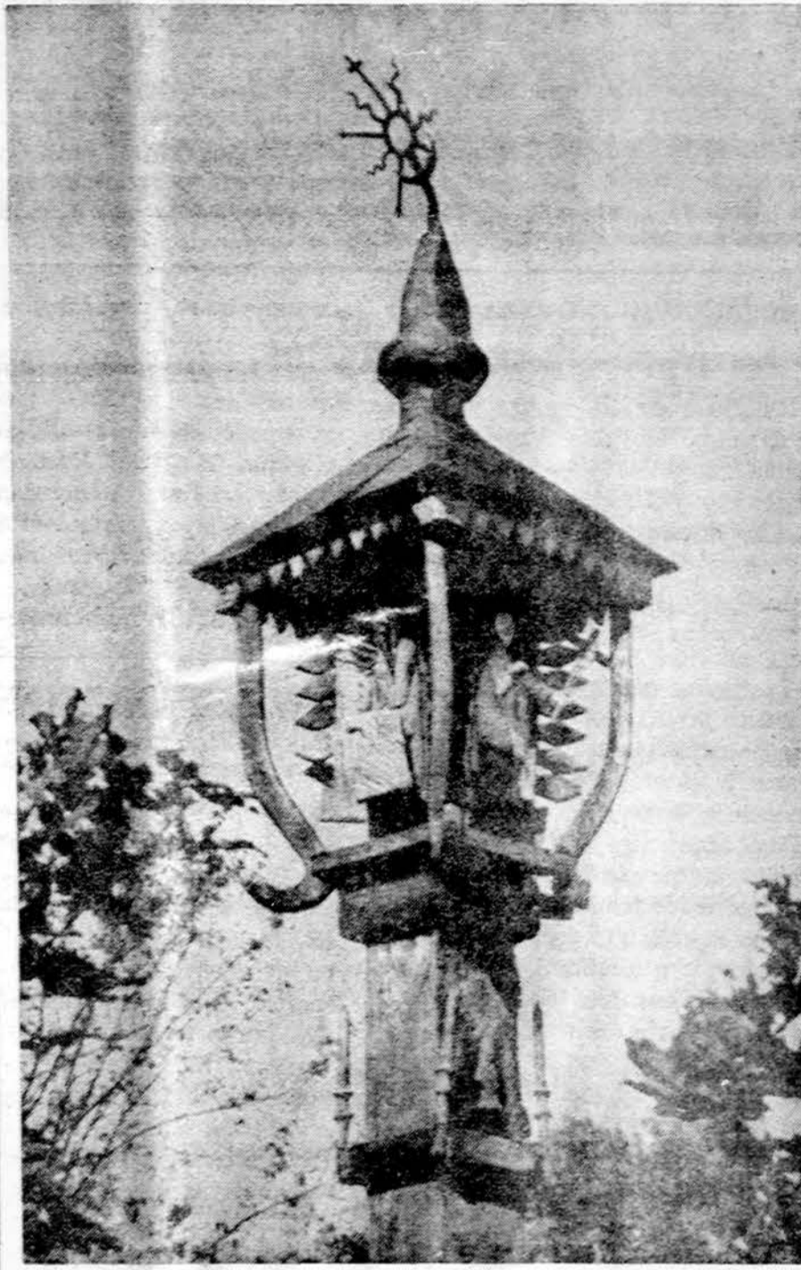
Lietuvos laukų papuošalas — nežinomo liaudies menininko kipiylstulpis. Kretingo apskr. Lietuva.

Didelę reikšmę turi munduro pasiuvimas. Taigi, apibūdinant kokio nors veikėjo padėtį visuomenėje, galima sakyti: "Tai atsakingas asmuo, nešiojantis tris plunksnakočius, šešis megztinius ir Sanchajaus siuvėjo siūtą mundurą su keturiomis kišenėmis", ("L'Aurore")