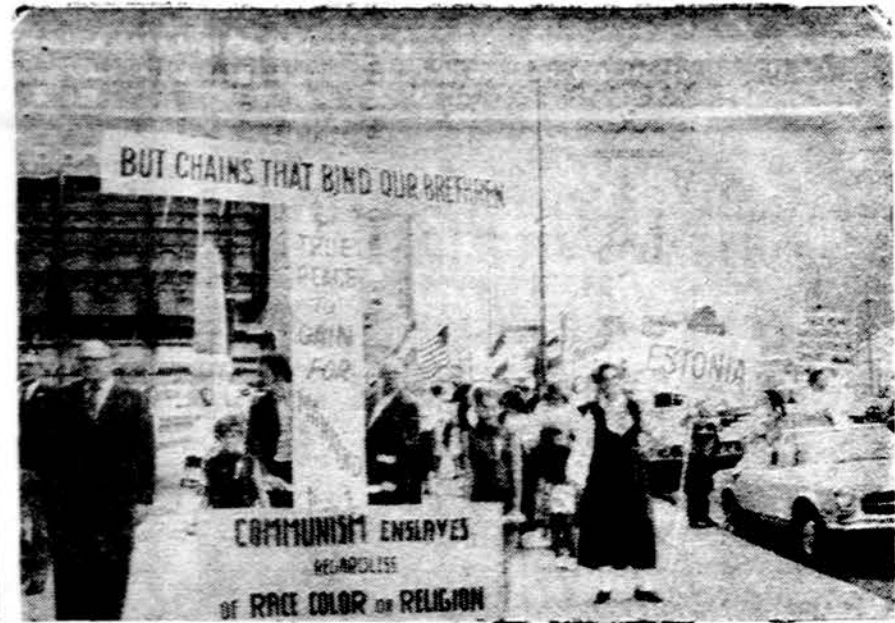
Pavergtųjų tautų parade Chicagoje liepos 21 d.

Taip pat chaotiškas yra ir maisto gaminių paskirstymas bei pristatymas. Reikia žinoti, kad Sov. Rusijos žemės ūkio zonos nėra modernių kelių ir todėl transportas yra labai sunkus. Praeitą rudenį vienas netoli Kijevo esantis kolchozas užsakė 120 specialių vagonų javams pervežti. Vagonai atvyko nedengti, javų vežimui nepritaikyti. Kol jie pasiekė paskirties vietą, vėjas ir važivimo greitis išbarstė kviečius, vagonai atvyko pustūšiai. Dažnai ir mineralinės trąšos yra siunčiamos nedengtuose vagonuose, be apsaugos nuo lietaus.