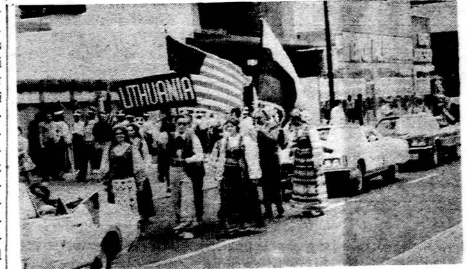
Pavergtųjų tautų parade Chicagoje liepos 21 d.

Tokiai padėčiai esant, nereikia stebėtis, kad didelis kaimiečių skaičius verčiasi juodąja rinka. Kolchozų vadovai nesunkiai duoda gabalėlį žemės miestiečiams, kurie nori įsigyti sau „dabotą“ — vasarnamį. O tokie vasarnamio rotoriai būna gerai aprūpinami kolchozininkų, žinoma, už gerą atlyginimą. Kolchozuose, pradėdant jų vadovais, baigiant pensininkais, visi vagia, tkas tik po ranka papuola: vinis, sraiguts, cukrinius runkelius, grūdus, o ko patys nesunaudoja, parduoda kaimynams arba mainais gauna ką kitą.