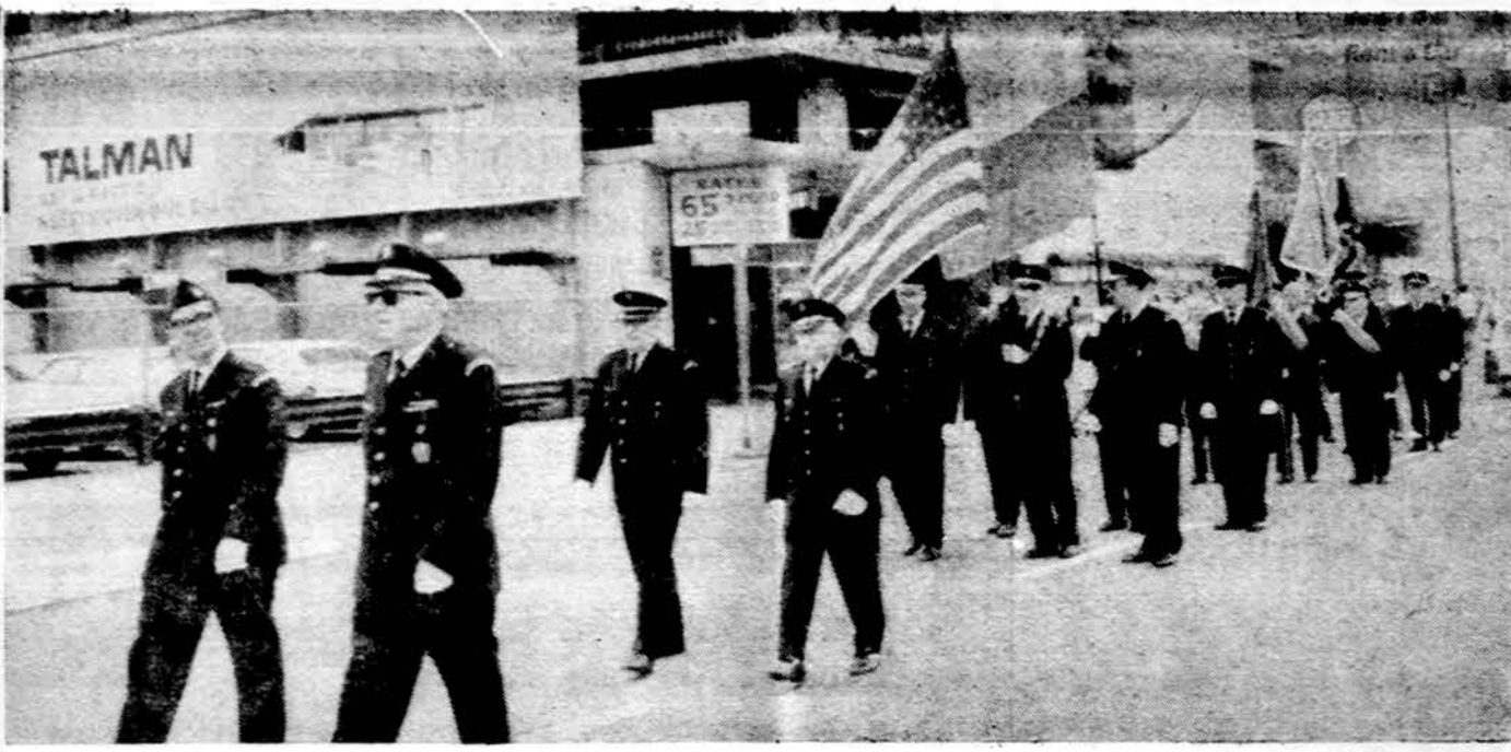
Lietuviai sauliai Pavergtųjų tautų parade Chicagoje

× Lietuvių Fondas . Visi lietuviai, dvias dar gyvi savo tautai, jungiasi į LF narių eiles, įsiamžindami savo vardą mūsų tautos istorijoje. LF adresas: 2422 W. Marquette Rd., Chicago, IL 60629, tel. 925-6897. (pr.)