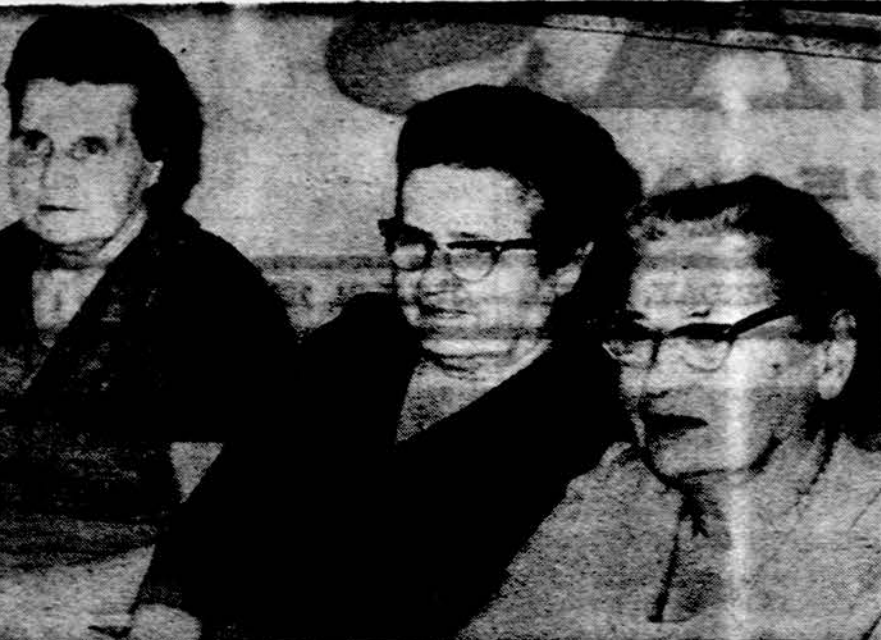
Joks pasaulio grožis neprilygs šiam lietuviškų motinėlių meilumui ir nuoširdumui.

Atsakymas. Vien nurodymas - dietos parąšymas nieko negelbės, kaip negelbsti vien šventųjų knygų skaitymas, vien dekalogo išleidimas, vien važiavimo ženklų prie kelio pastatymas, jei nėra žmoguje žmogaus tvarkytojo, asmenybės, pajėgiančios labai naudingus dalykus savame gyvenime dalimi paversti. Už tai visi kreipkime visą dėmesį ne į pilulę, ne į dietą, ne į įstatymų leidimą, bet į savo ir artimo asmenybės sužmoginimą, didesni nuo prietarų jos atpalaidavimą. Tik tada visi virš mėtų ir dar gausybė kitų žmogaus gyvenime teigiamų dalykų turės žmogų įtakos ir atneš naudą. Šitokią priešvalgių suvirškinę, galime sėkmingai suvaldyti tai galvoti, svetimiems savo praktiškai laistyti paliove. Visų kitų (jų čia neišvardysiu) - sriubų nevalgykite. Dabar suprasime, kaip mes save žudome, visokių niekus su sriubomis iš savo sveikata kūną prinišdami. Juk ir geriausias automobilis toli nevažiuos, jei jį jo širdį pilnime gatvės purva.