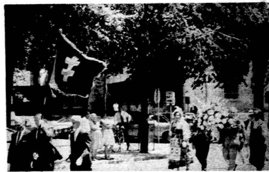
Chicago ramovėnai liepos 15 d. žygiuoja Dariaus Girėno minėjimo parade.