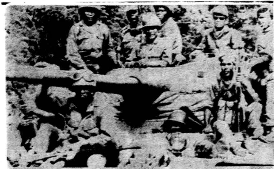
Kambodijos vyriausybės daliniai prie Phnom Penh

PARYŽIUS. — Prancūzijos atnaujinti atominiai bandymai Mururoa salyne sukėlė protestų bangą. Tahiti savivaldos seimelis nutarė prancūzų vėliavą nuleisti pusiau stiebo ir pirmą kartą prabilo, kad jie sieks nutraukti ryšius su Prancūzija. Tahiti iki šiol džiaugdavosi Prancūzijos apsauga ir jiems duodama visiškai laisve tvarkytis viduje, o jei dabar ir čia prasidės nacionalinis judėjimas, šios kolonijos ateitis gali būti panaši į Afrikos ir kitų kraštų kolonijų likimą. Protestų notas Prancūzijai įteikė jau Japonija, N. Zelandija, Australija, Kanada, Švedija. Amerika neduoda jokių komentarų.