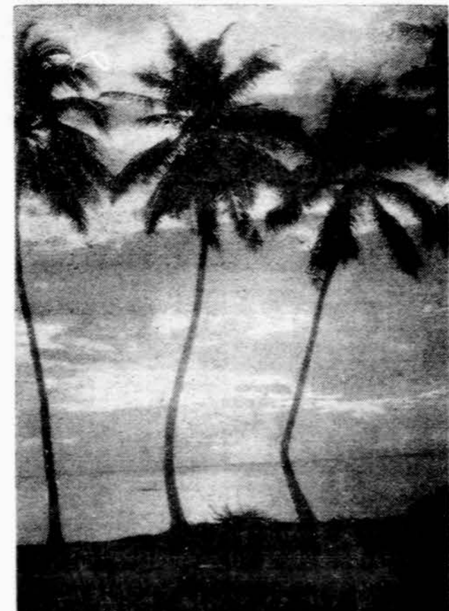
Tahiti, Pietų Pacifikas

Kambodijos raudonieji, atrod, savo ofensyvą dabar susilpnino ir laukia. Nežiūrint amerikiečių bombardavimo, jie pajėgia atkirsti kokius tik nori susisiekimo kelius vyriausybės daliniams, bet sostinės Pnom Penh jie tuo tarpu nepuola. Jie nebenedu veltis į puolimus, kurie gali pakeisti jiems taip palankų JAV Kongreso nusistatymą. Dabar ekspertai pramato, kad prez. Lon Nol režimas Kambodijoje ilgai negalės išsilaikyti. Jis dabar priklauso nuo JAV, Kinijos, Rusijos ir Šiaurės Vietnamo susitarimų malonės. Tokius komentarus skelbia gerai informuotas "US News and World Report" žurnalas.