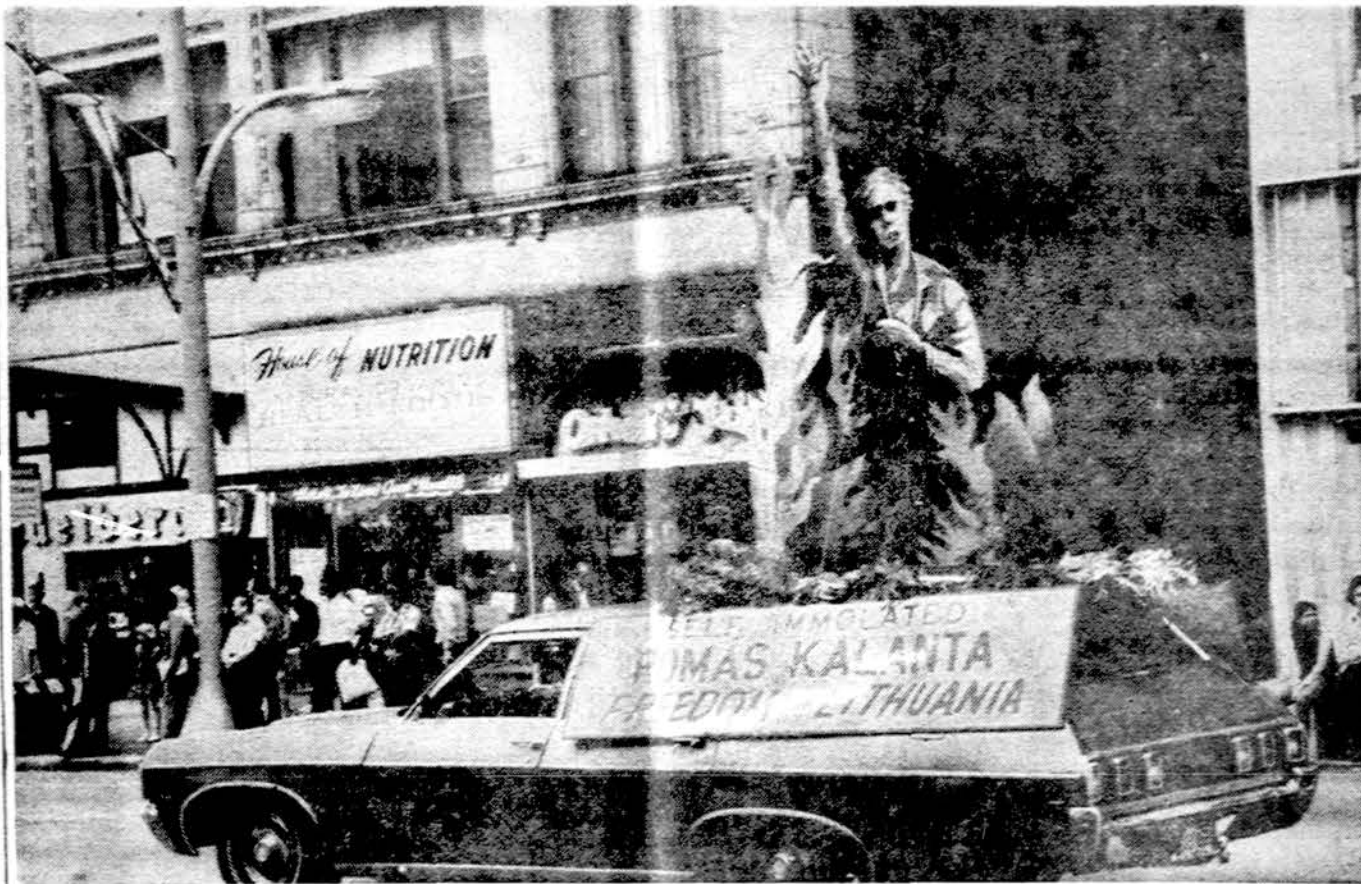
Is Pavergtųjų tautų demonstracijos Chicagoje liepos 21. Paveikslas pats kalba apie save.

Pasibaigus karui Kambodijoje, toje srityje liks stambi JAV karinė jėga: 200 B-2 bombone-