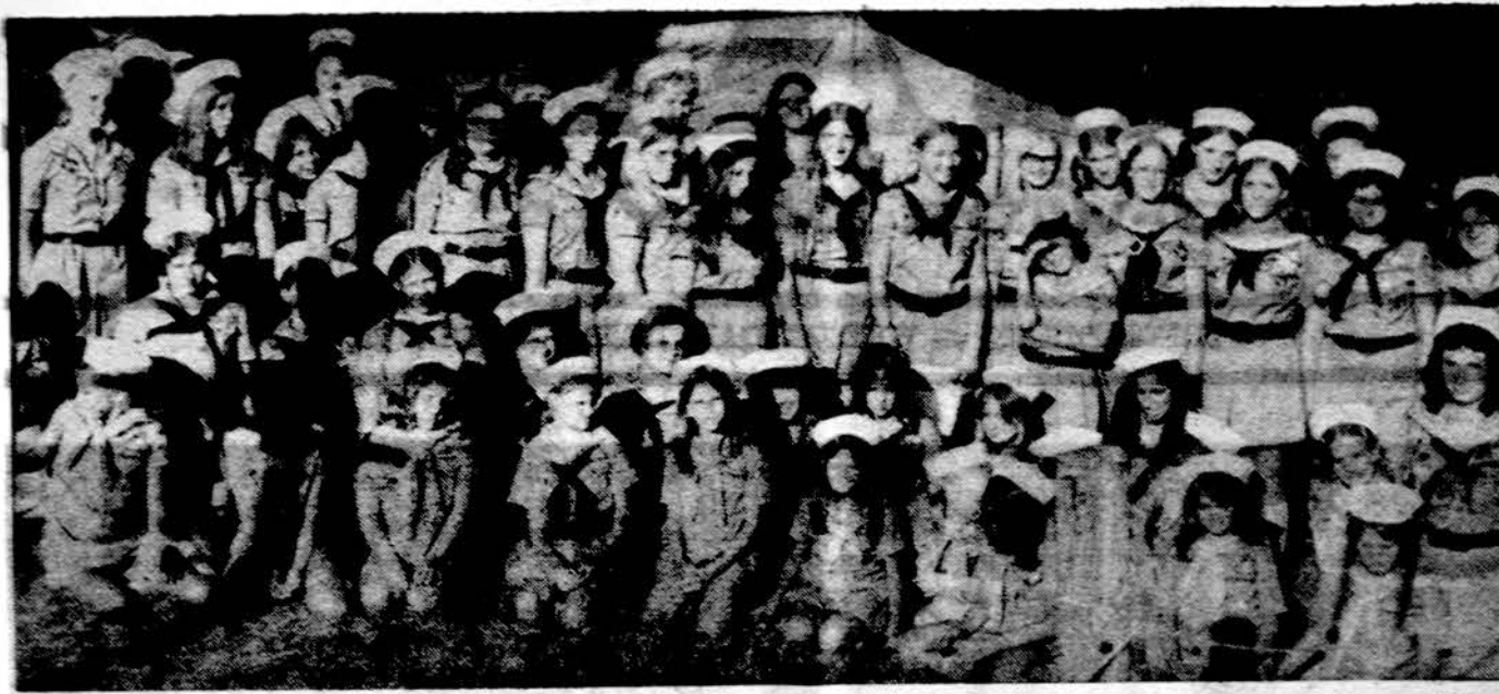
Nerijos tunto jūrų skautės šių metų Baltijos stovykloje.

Lituanicos tunto Dariaus-Girėno stovykla šiais metais buvo kiek mažesnę, sutraukusi 140