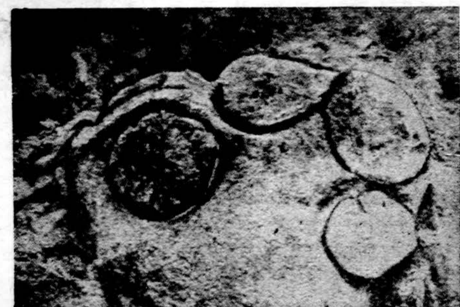
Dapšių Alkos kalno akmuo su iškaltais saulės ženklais (Iš Tarasenkos knygos "Pėdos akmenyje", 1958)

Dalnai saulėta, kiek vėsiu, mažiau drėgmės, 40% galimybė lietaus su perkūnija, apie 80 l.