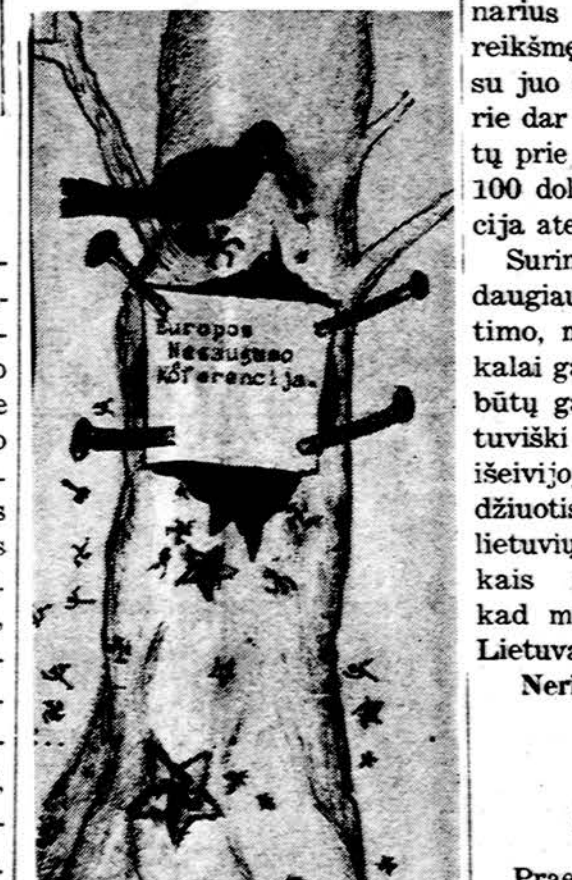
— Geneli, Geneli, tas tavo beldimas man ligą įvarė. (Gromyko taip tarė) Piesė Daiva Barškėtė, Marijos mokyklos mokinė

Atsirado lietuvių, kuriems gimė idėja suorganizuoti fondą, kurio kapitalas būtų nejudinamas, o iš kapitalo gautą pelną naudoti švietimo, mokslo ir kultūriniam reikalams. Fondo pradžia reikiama laikyti 1960. XII 8 d., kada tos dienos "Drauge" dr. A. Razma parashė straipsnį apie tokio fondo kūrimą. Tai