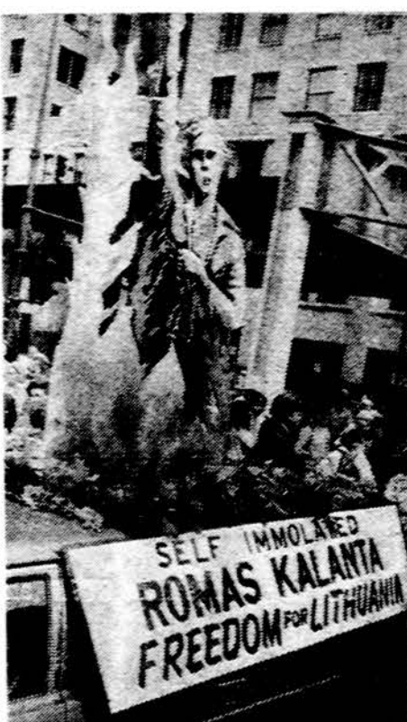
Gyvasis paveikslas, vaizduojantis Romo Kalantos susideginimą pavergtųjų tautų parade Chicagoje.