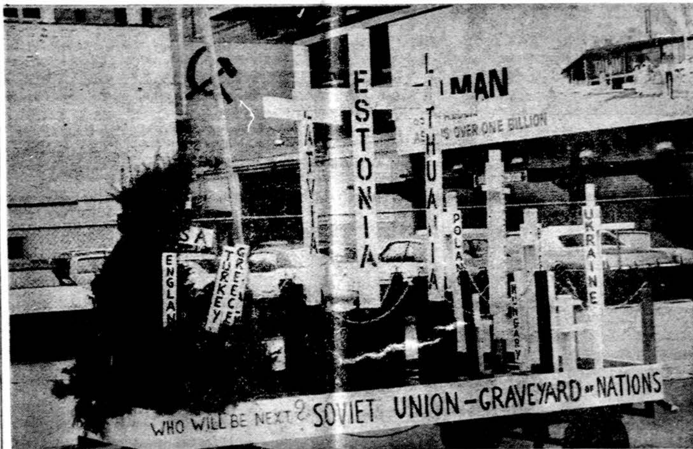
Kas sekantis Sovietų Sąjungos aukų eilėje? Vežimas paruoštas Pavergtųjų tautų demonstracijoms Chicagoje liepos 21

WASHINGTONAS. — Irano šachas Pahlevi atvyko į Ameriką oficialiam vizitui. Jo atsilankymas sako, kad Iranas ir toliau lieka palankus vakarams. Iranas labai svarbus strategiskai ir dėl savo naftos atsargų, taip pat vienas didžiausių Amerikos ginklų pirkėjų. Per penkerius paskutiniuosius metus Iranas pirkė iš Amerikos už 2,5 bil. dolerių visokios karinės medžiagos ir ginklų. Ir dabar šachas sako norįs pirkti Amerikos naujausių F-14 kovos lėktuvų. Vieno tokio kaina yra 14 ml. dolerių.