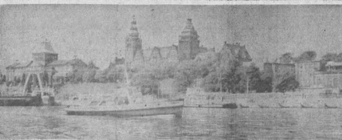
Stettin, buvęs Vokietijos uostas Baltijos jūroje, po II pasaulinio karo priskirtas Lenkijai ir vadinamas Szczecin. Taip jis atrodo šiandien.

Šiandien vis labiau aišku, kad maoizmo politika ir ideologija nukreipta prieš visų socialistinių šalių interesus, prieš visą pasaulinį komunistinį ir nacionalinį išsivadavimo judėjimą. Tai labai kenkia tautų kovai už taiką, demokratiją, nacionalinį