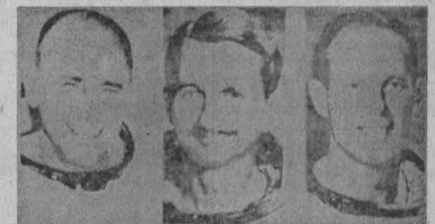
Antroji pamaina Erdvių laboratorijai. Iš k. į d.: Alan Bean, Owen Garriot ir Jack Lousma. Astronautai pakils rytoj, liepos 28, 6.10 val. ryto Chicago laiku.

Kremliaus nesutarimų objektu nėra vien tik prekyba ir užsienio kapitalo investavimas, bet ir kiti politiniai reikalai, kurie kartais ima ir iškylo į paviršių, kaip pvz. Chruščiovo nuvertimas arba dviejų narių šiais metais išmetimas iš politbiuro.