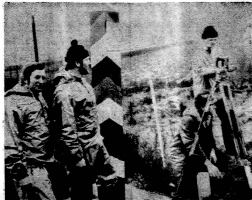
Pagerėjus Vakarų ir Rytų Vokietijos santykiams, abudu kraštai sutarė vienu kitur išlyginti sienas. Abiejų Vokietijų specialistai atlieka matavimo darbus Luebecko-Schlutupo srityje

PAPEETE. — Lėktuvas, kuris seka atominį bandymų radioaktyvumą, iš Tahiti aerodromo jau pakilo. Iš to daroma išvada, kad antrasis sprogdinimas bus netrukus.