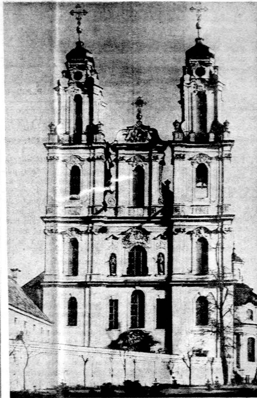
Vilniui — sostinei 650 metų