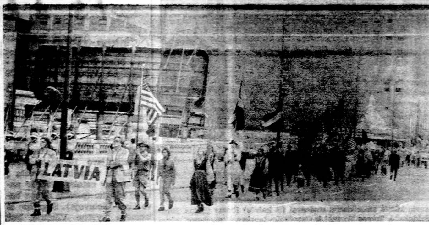
Latviai žygioja pavergtųjų tautų parade Chicagoje.