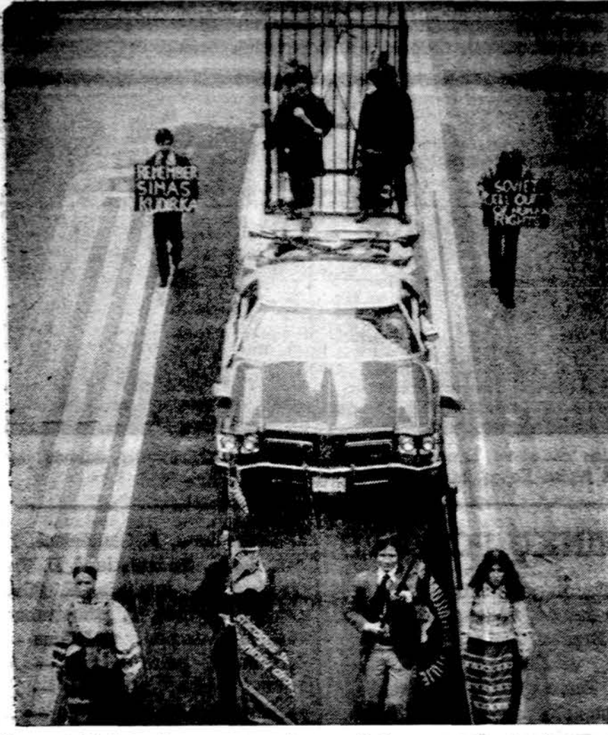
Cicero ateitininkų kuopos gyvasis paveikslas pavergtų tautų parade Chicagoje.

Pasauly yra apie 300 rūšių karvelių. Jų galima rasti visu-se žemės kampeliuose, išskyrus Antarktidą ir Afriką. Be to, Lenkijoje yra viena karvelių rū-šis, nepanaši į kitas. Šis karve-lis vadinami karveliojais ju