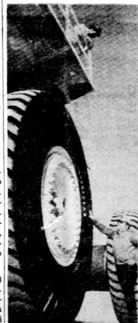
Nieko sau padanga. Ji sveria „tik“ 4 tonas ir yra 12 pėdų aukščio. Jas gamina Goodyear kompanija specialiems 200 tonų pakėlimo sunkveikimams

Philadelphia arkivyskupijos organas „The Catholic Standard and Times“ birželio 14 straipsnyje „Unresolved Problems“ rašo, kad iš antrojo pasaulinio karo užsilikęs neišspręstas palikimas — Pabaltijo tautų statusas — pagaliau turi būti sutvarkytas. JAV nėra pripažinusi Pabaltijo kraštų į Sovietų Sąjungą inkorporacijos legalumo. Ta aplinkybė yra didelė moralė parama pabaltiečiams jų kovose dėl savo tautų laisvės ir nepriklausomybės. JAV 89-sis Kongresas priėmė Rezoliuciją Nr. 416, kuria šio krašto prezidentas raginamas iškelti Pabaltijo tautų — Lietuvos, Latvijos ir Estijos — klausimą tarp tautiniame forume. Helsinkyje šiuo metu vykstanti Europos Saugumo konferencija kaip tik esanti toks tarptautinis forumas, kuriame JAV delegacijai derėtų drąsiai iškelti Pabaltijo tautų laisvės ir nepriklausomybės klausimą ir priminti JAV jų inkorporacijos nepripažinimo politiką. (E.)