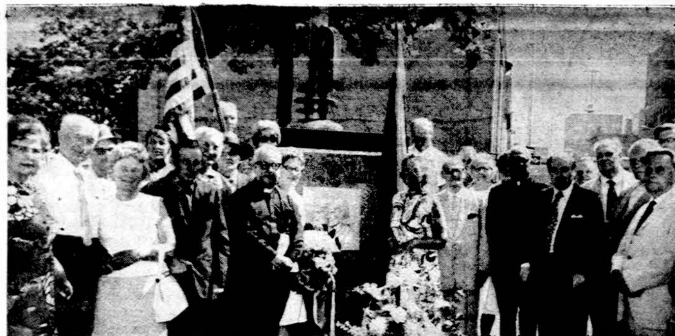
Darius ir Girėno 40 m. mirties sukakties minėjimo Brooklyne, Lietuvos aikštėje, būrelis dalyvių prie Dariaus ir Girėno paminklo. Minėjimas įvyko liepos 14 d.