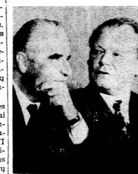
Prancūzija prez. G. Pompidou ir Vak. Vokietijos kancleris Willy Brandt tarėsi Europos saugumo reikalais

Šie žodžiai, kuriuos sąmoningai perteikia, aiškiai rodo, kad