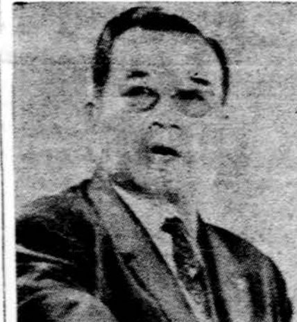
Souvanna - Phouma, Laoso ministris pirmininkas.

WASHINGTONAS. — Australijos premjeras Gough Whitlam pakelė į Ameriką. Noro sako, kad jo vizitas yra privataus pobūdžio, bet jis susitiks su prezidentu Nixonu ir kalbės daugiausia miršančios SEATO organizacijos reorganizavimo reikalais. SEATO yra karinė pietryčių Azijos - Australijos organizacija, bet prarado savo efektingumą ir negali lygintis su NATO.